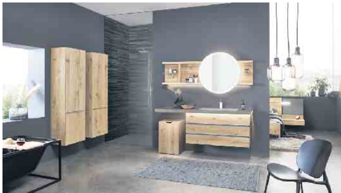
Gerade im Badezimmer herrscht temporär eine hohe Luftfeuchtigkeit mit der Massivholzmöbel gut umgehen können.

„Auch Putzmuffel wissen das zu schätzen“, sagt der Möbelexperte und schließt: „Das Thema Wohngesundheit wird für viele Deutsche immer wichtiger. Daher ist es nicht verwunderlich, dass heute viele Einwohner bevorzugt Möbel aus massivem Holz auswählen, denn das Naturmaterial ist atmungsaktiv, verbessert die Luftqualität und ist ein wahrer Segen für Allergiker.“ (IPM/RS)