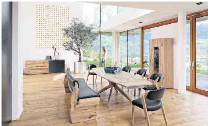
Massivholzmöbel sind größtenteils mit einem offenporigen Oberflächenfinish wie Ölen oder Wachsen behandelt.