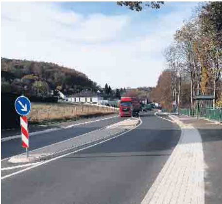
Haltestelle Rempert: Überquerungshilfe und Radweg

telpunkt-Markierung zu platzieren. Die Gegner können auch versuchen, den gegnerischen Eisstock wegzuschießen. Ein wirklich spannendes Spiel für Jung und Alt. Alles was man braucht, sind feste Winterschuhe mit Gummisohle und einige nette Freunde/ Kollegen. Vorkenntnisse sind nicht nötig, genau das Richtige, für ein weihnachtliches Zusammentreffen mit nachhaltig lustiger Erinnerung. Nähere Informationen zu allen Angeboten und Anmeldebedingungen unter www.eissporthalle-wiehl.de