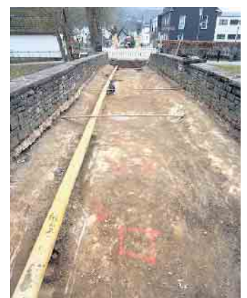
Die historische Mühlenbrücke erhält eine neue Betonschicht und wird rundum saniert.

Während der Bauarbeiten bleibt die Brücke für Autos und Fußgänger gesperrt. Frühestens Ende März 2026 kann sie wieder zu Fuß überquert werden. Die Freigabe für Fahrzeuge ist für Juli 2026 geplant, wenn auch die Gesamtmaßnahme fertiggestellt sein soll. Ob der Zeitplan eingehalten werden kann, hängt auch vom Winterwetter ab. Die Erreichbarkeit der Häuser ist gewährleistet.