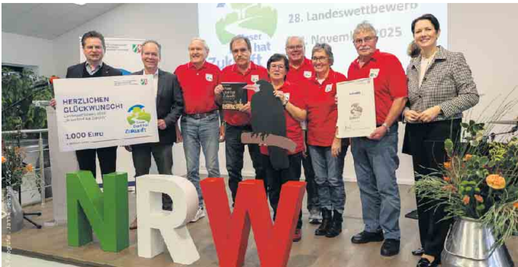
Bronze für Oberwiehl: Bei der Preisverleihung in Bad Sassendorf freuten sich die Vertretenden der Dorfgemeinschaft mit Landrat Klaus Grootens (2.v.l.) und dem Bürgermeister der Stadt Wiehl, Ulrich Stücker über die gute Platzierung im Landeswettbewerb „Unser Dorf hat Zukunft“.

Oberbergischer Kreis. Landrat Klaus Grootens gratuliert den beiden oberbergischen Siegerdörfern, die sich im Landeswettbewerb „Unser Dorf hat Zukunft“ erfolgreich platziert haben. „Der Oberbergische Kreis ist stolz auf Hülsenbusch und Oberwiehl und deren Bewohnerinnen und Bewohner, die sich engagiert dem strukturellen, demografischen und gesellschaftlichen Wandel stellen und ihre Dörfer und das Dorfleben gemeinsam lebenswert, liebenswert und zukunftsfähig gestalten. Diese guten Platzierungen im Landeswettbewerb belohnen einmal mehr das bürgerschaftliche Engagement im ländlichen Raum.“ Daneben bedankt sich Klaus Grootens bei allen Dorfgemeinschaften, die sich in diesem Jahr an dem Dorfwettbewerb mit viel Mühe, Zeit und Aufwand beteiligt haben. „Es geht darum, dass sich unsere Dörfer mit ihren individuellen Bedingungen für eine gute Dorfentwicklung einsetzen und aktiv und selbstbestimmt Zukunftsperspektiven erarbeiten. Der Oberbergische Kreis unterstützt dieses Engagement mit vielen Serviceangeboten und Förderprogrammen für Dorfgemeinschaften.“