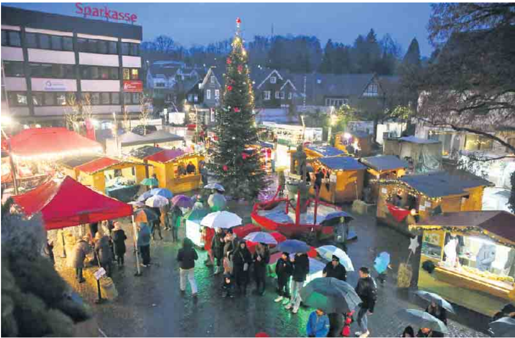
Am zweiten Adventswochenende wird die Wiehler Innenstadt wieder zur kleinen Weihnachtswelt.

Am Sonntag, 7. Dezember, öffnen die Wiehler Geschäfte von 13:00 bis 18:00 Uhr für entspanntes Weihnachtsshoppping. Dort sind auch die Adventskalender erhältlich.