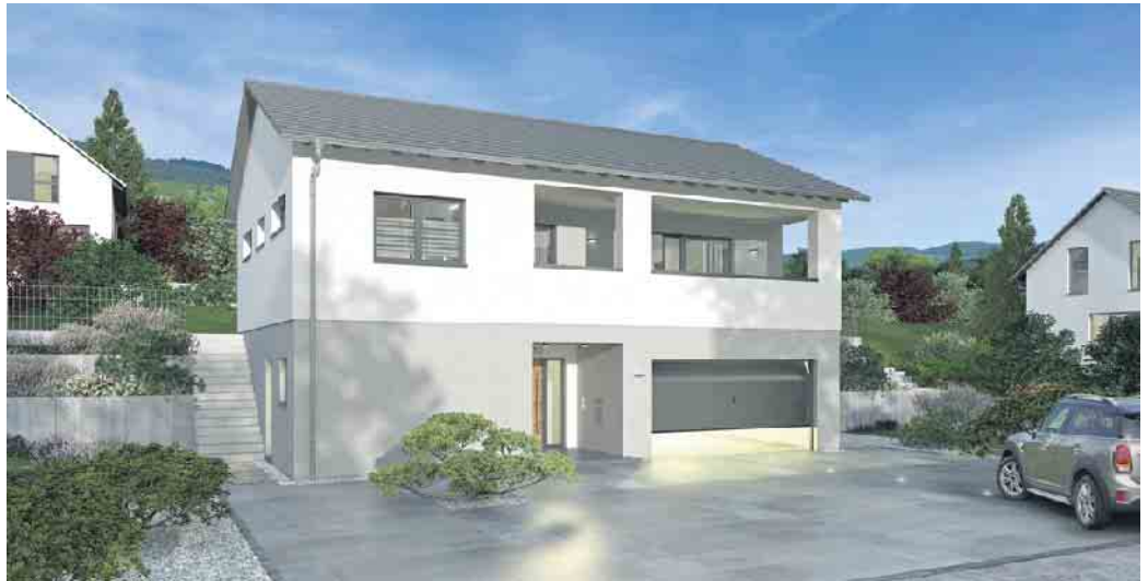
Ein Wohnkeller ist ein sicheres und komfortables Fundament für einen effizienten Hausbau am Hang.