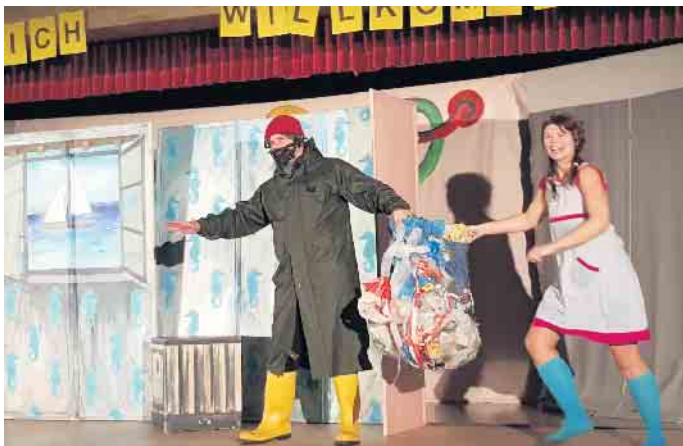
Motte freut sich, wenn ihr Vater vom Fischen zurück kommt und wundert sich über den ganzen Plastikmüll aus dem Meer.