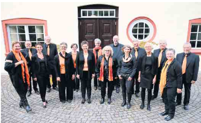
Mitglieder des ensemble cantabile wiehl