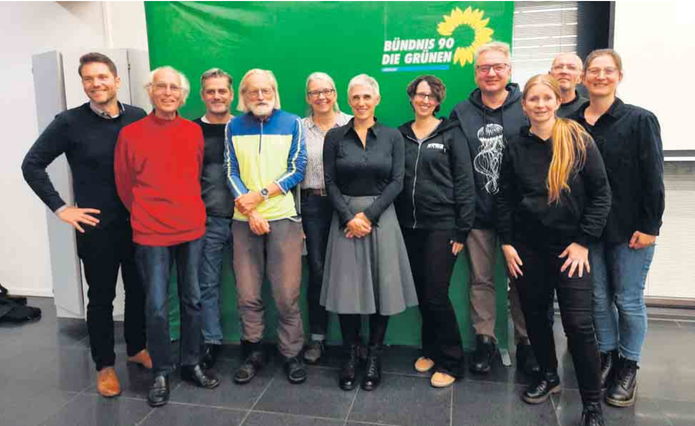
Der Wähler OV mit den Kandidatinnen

nur verwalten, sich für ein besseres Gesundheitswesen und für Transparenz und Bürgerbeteiligung in Oberberg einsetzen. Sie betont, dass Klimaschutz und Schutz von Biodiversität und Artenvielfalt zugleich Menschen-schutz und Heimatschutz sind. In einer sich verändernden Welt muss man progressiv neue Rahmenbedingungen schaffen, wenn man - ganz konservativ - das erhalten will, was man liebt. Wichtige Themen in Oberberg sind für sie auch Energie und Mobilität. Auch sie erhielt ein einstimmiges Votum. Die Grüne Jugend aus Oberberg schloss sich übrigens ausdrücklich nicht dem Beschluss der Grünen Jugend im Bund an. Tammo Buchholz als Sprecher erklärte die Solidarität mit der Mutterpartei. Barbara Degener