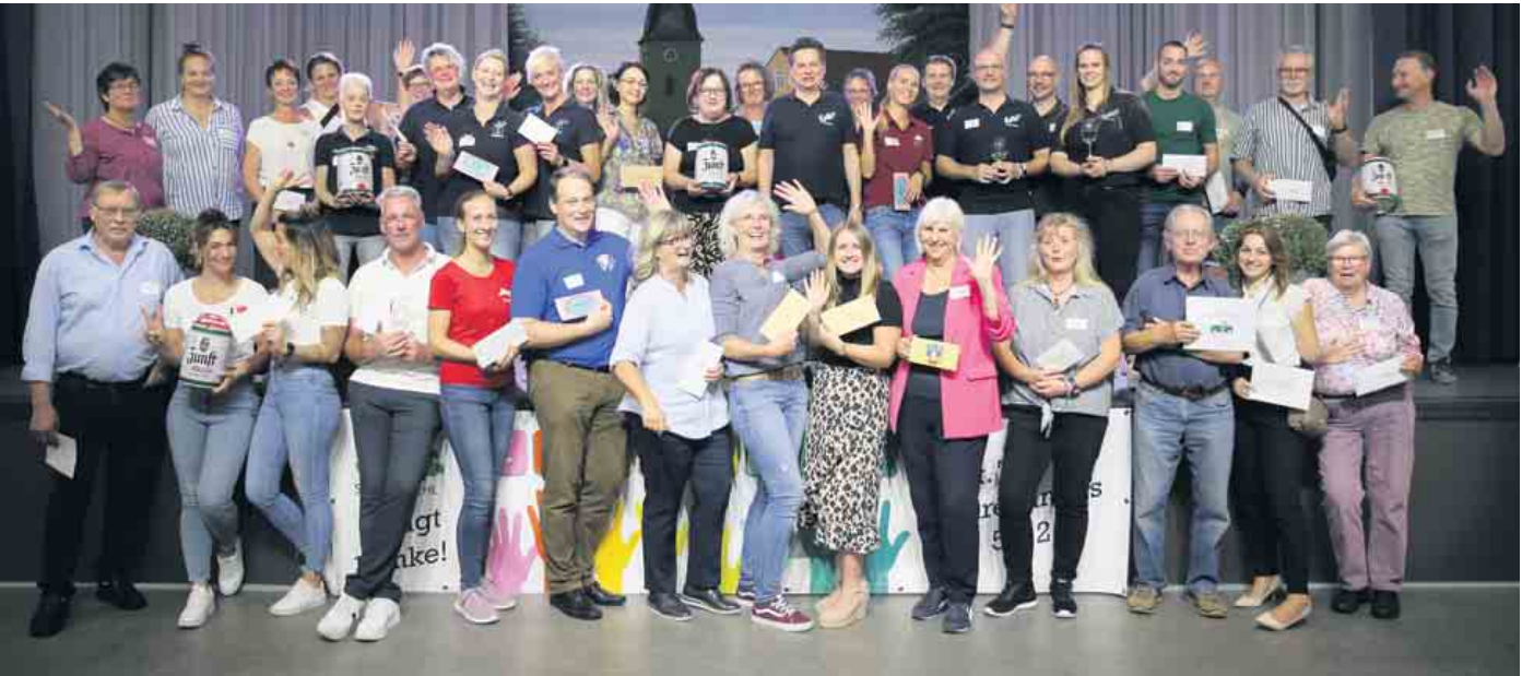
Diverse Gutscheine und Bierfässchen gab's bei der Tombola für die glücklichen Gewinnerinnen und Gewinner unter den Ehrenamtlichen.