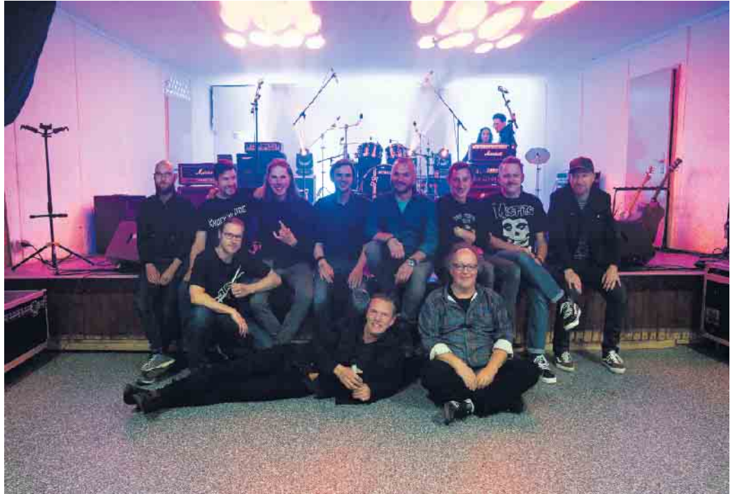
Orga-Team mit Bands

Der Verein hofft auf zahlreiche Zuschauer, damit das Zehnjährige gebührend gefeiert werden kann.