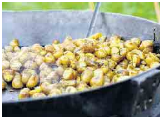
Kartoffelspezialitäten beim Kartoffelfest im LVR-Freilichtmuseum Lindlar.