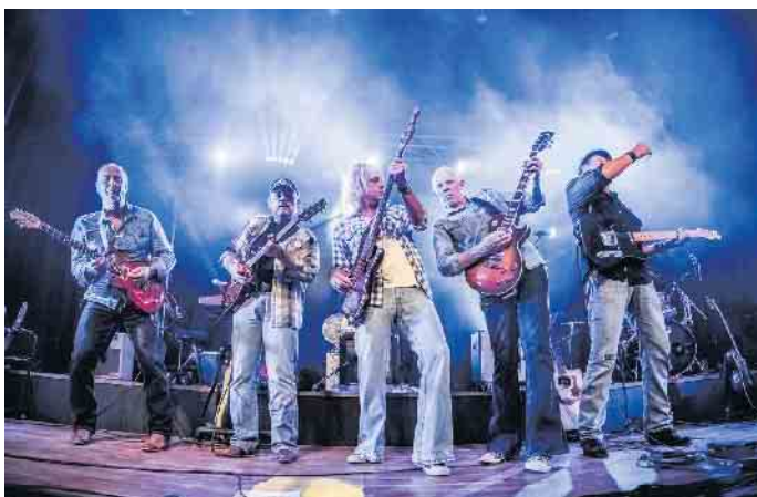
The Eagles Legacy präsentieren am 24. Februar 2024 die legendären Songs der US-amerikanischen Band.