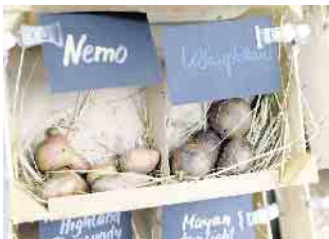
Kartoffelsortenschau beim Kartoffelfest im LVR-Freilichtmuseum Lindlar.