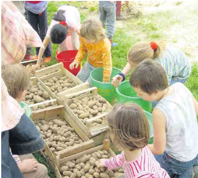
Kinder beim Sortieren der Kartoffeln im LVR-Freilichtmuseum Lindlar.