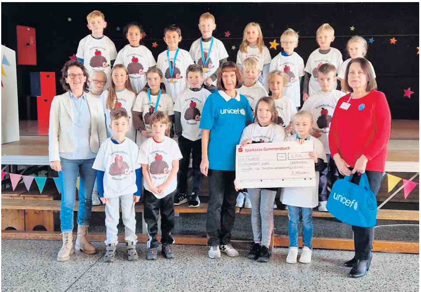
Stolz präsentierten die Kinder den Scheck über 2500 Euro. Dafür hatten sie beim Sponsorenlauf etliche Runden gedreht.

Dem Leitbild der Schule entsprechend werden auch die Unicef-Kinderrechtstage durchgeführt und die Schülersprecher Neele und Liem verraten: „Mit der restlichen Summe der Sponsorengelder wollen wir ein grünes Klassenzimmer einrichten! Wir wollen gerne draußen in der Natur lernen!“