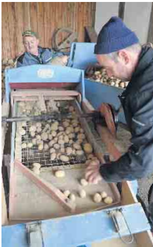
In der Sortiermaschine werden Kartoffeln nach Größe sortiert.

Information: Museumsladen: Tel. 02266 471920 www.freilichtmuseum-lindlar.lvr.de