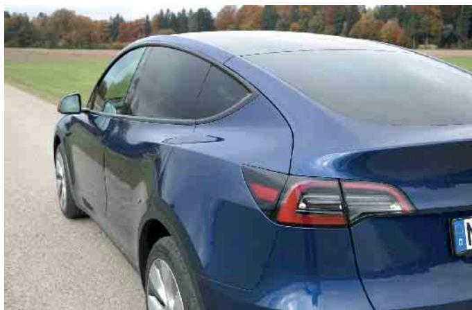
Wie weit man mit einer Akkufüllung kommt, hängt von verschiedenen Faktoren ab.

DAS GRÜNE THEMA IM NOVEMBER: ALLES ZUM THEMA NACHHALTIGE MOBILITÄT