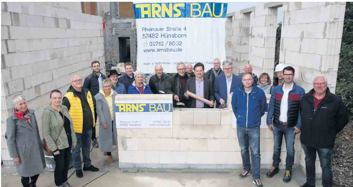
Zahlreiche Gäste hatten sich zum Einbau der „Zeitkapsel“ auf der Baustelle eingefunden, darunter viele Drabenderhöher Stadtverordnete.