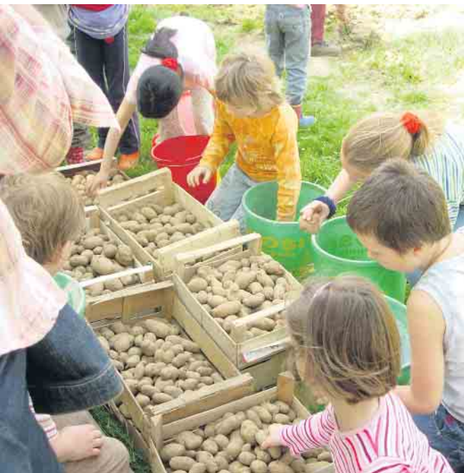
Kinder beim Kartoffeln sortieren im LVR-Freilichtmuseum Lindlar.