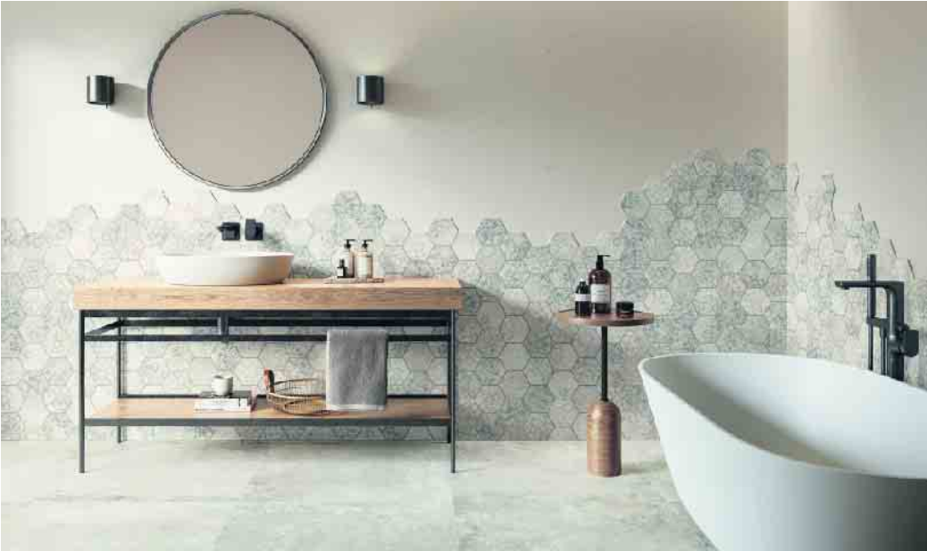
Die Nasszelle von einst entspricht nicht mehr unserem Lebensgefühl. Das Bad hat sich zu einem sinnlichen Lebensraum gewandelt.

authentischen Maserungen der Oberfläche angeboten werden. So lassen sich die neuen Holzfliesen kaum vom Original unterscheiden. Zugleich sind sie auf Dauer feuchtigkeitsbeständig und rutschhemmend - das ist ideal für die bodenebene Dusche. (djd)