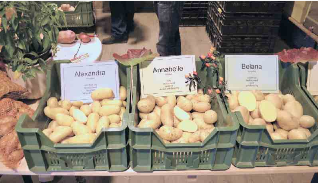
Kartoffelsortenschau beim Äpelsfess im LVR-Freilichtmuseum Lindlar.

LVR-Freilichtmuseum Lindlar veranstaltet Kartoffelfest