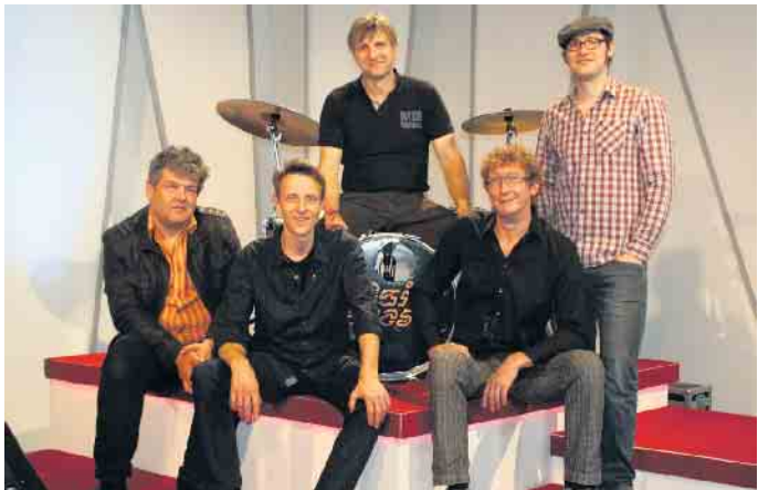
Die Band „Daily Races“ eröffnet das Frühjahrsprogramm mit Hits aus den Achtzigern am 12. Januar.

Der Vorverkauf startet am Montag, 24. Oktober 2022. Karten gibt es bei Wiehl-Ticket im Rathaus, Telefon: 02262 99-285, oder online unter kulturkreis-wiehl.de; dort finden sich auch Details zum Programm.