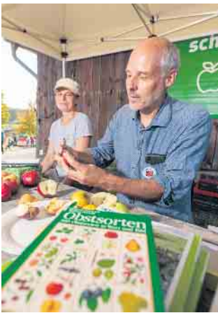
Obstsortenbestimmung durch den Pomologen beim Obstwiesenfest im LVR-Freilichtmuseum Lindlar.

unter anderem Tipps zum Obstbaumschnitt. Für das leibliche Wohl sorgen regionale Gastronomiestände. Äpfel, Birnen und Quitten aus eigener Ernte können mitgebracht und in einer mobilen Saftpresse zu Saft verarbeitet werden. Dafür ist in diesem Jahr die mobile Mosterei von Most & Trester zu Gast. Auf der Homepage der Mosterei kann man sich über das Buchungssystem anmelden. ( anny.co/b/most-und-trester/services ) Obstwiesenfest im LVR-Freilichtmuseum Lindlar Sonntag, 6. Oktober, 10 bis 18 Uhr Information: 02234 9921-555, www.freilichtmuseum-Lindlar.lvr.de