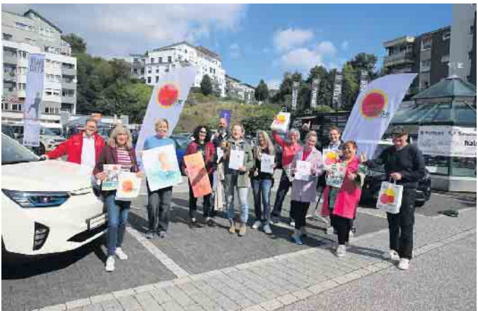
Auf dem Weiherplatz präsentierten sich die Künstlerinnen und Künstler der Kunstaktion: Ihre Bilder sind noch bis zum 30. September in den Läden und Restaurants zu sehen.