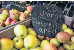
Apfelsortenschau beim Obstwiesenfest im LVR-Freilichtmuseum Lindlar.

Am Sonntag, den 6. Oktober 2024 findet im LVR-Freilichtmuseum Lindlar zwischen 10 und 18 Uhr wieder das Obstwiesenfest statt. Ein Tag rund ums Obst