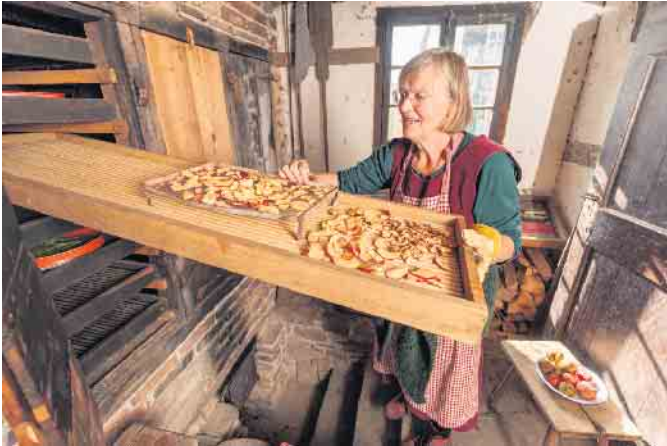
Vorbereitung zum Obstdörren beim Obstwiesenfest im LVR-Freilichtmuseum Lindlar.

- vom Baum über die Ernte bis zum Obsterzeugnis. Mit einer großen Obstsartenschau, dem Verkauf von Produkten aus der Region und zahlreichen Handwerksvorführungen. Bei der großen Obstsartenschau können verschiedene Obstsorten bestaunt werden, die heute kaum noch im Supermarkt zu finden sind. Darüber hinaus steht die fachkundige Beratung zu Fragen rund um den Obstanbau, der Veredelung und der Sortenbestimmung im Vordergrund. Wenn Unklarheit über die Sorte im eigenen Garten besteht, kann das Obst mitgebracht werden - für die genaue Sortenbestimmung sind drei bis vier Früchte nötig. Natürlich werden auch saisonales Obst und Gemüse sowie dekorative und praktische Dinge aus der Region zum Verkauf angeboten - passend zur beginnenden Herbstzeit. Viele spannende Infostände informieren über Nachhaltigkeit in der Natur und geben