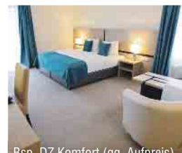
Bsp. DZ Komfort (gg. Aufpreis)