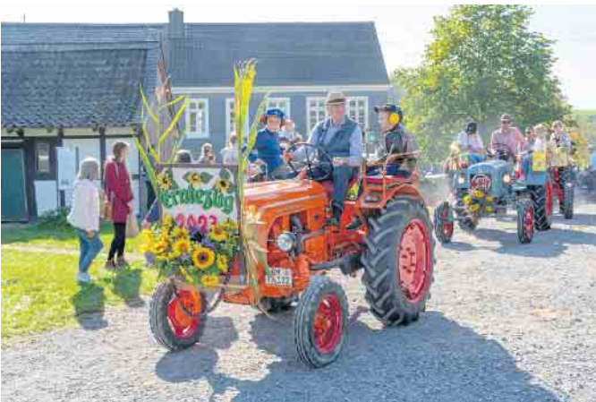
Der Erntedankzug des Heimatvereins Hohkeppel e.V. im LVR-Freilichtmuseum Lindlar.