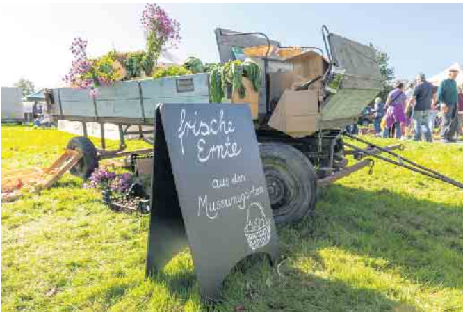
Die Ernte aus den Museumsgärten auf dem Erntewagen.