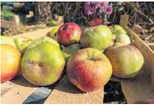
Ein Tag rund ums Obst im LVR-Freilichtmuseum Lindlar.