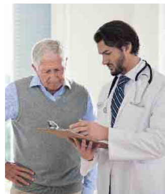
Bei Herzinsuffizienz sollten Ärzte genau hinschauen.

Oft zeigen Patienten mit der erblichen Form sowohl Symptome am Herzen als auch an den Nerven. Mehr Informationen zur Erkrankung gibt es unter www.leben-mit-amyloidose.de . (akz-o)