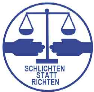
Grafik: Bund Deutscher Schiedsmänner und Schiedsfrauen

Wer Interesse hat, Schiedsfrau oder Schiedsmann zu werden, schickt eine schriftliche Bewerbung an den Bürgermeister der Stadt Wiehl, Fachbereich 8, Bahnhofstr. 1, 51674 Wiehl. Die Bewerbung soll Name, Anschrift, Geburtsdatum, Geburtsort, Beruf, eine kurze Begründung des Interesses an der Übernahme des Schiedsamtes und einen kurzen Lebenslauf enthalten. Für telefonische Auskünfte steht Frau Christiane Jaeger montags bis mittwochs vormittags unter der Rufnummer 02262 99-514 zur Verfügung.