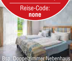
Bsp. Doppelzimmer Nebenhaus