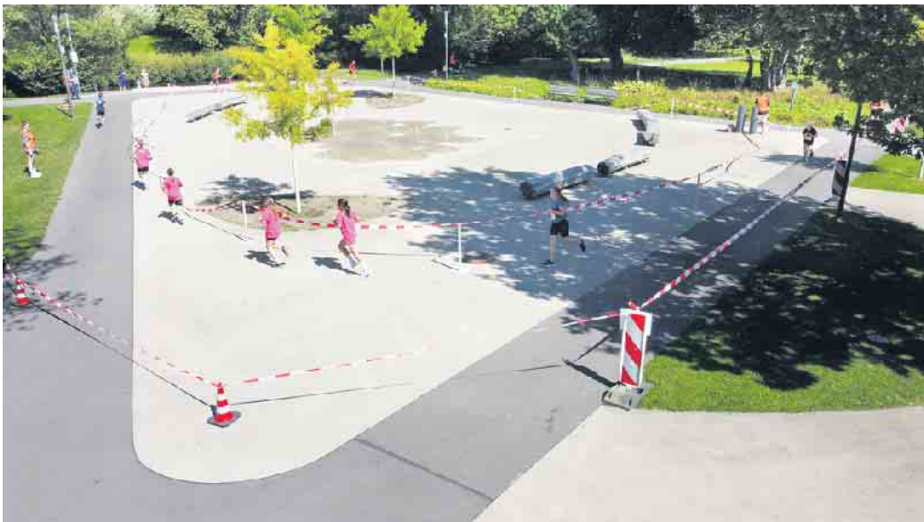
Mit diesem Foto von Christian Melzer nimmt die Stadt Wiehl am Fotowettbewerb zum Thema Städtebauförderung teil: Jetzt online für das Bild abstimmen!

In diesem Zug entstanden u. a. das anziehende Fontänenfeld sowie die Flusstreppe an der Wiehl. Dieses Motiv landete beim entsprechenden Fotowettbewerb 2022 bundesweit auf dem fünften Platz. Auch jetzt hofft die Stadt Wiehl auf möglichst viele Stimmen für das aktuelle Foto, um