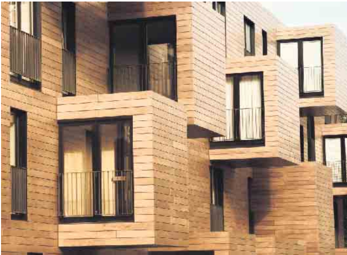
Holz zählt zu den ältesten Baumaterialien, die der Mensch nutzt - und ist unter Aspekten des Klimaschutzes gleichzeitig Rohstoff der Zukunft.

renz. Unter www.holzvomfach.de gibt es dazu mehr Informationen sowie weitere Tipps zum nachhaltigen und klimaschonenden Bauen. (djd)