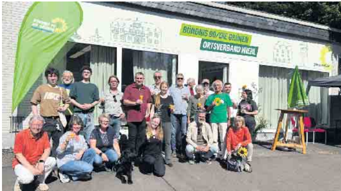
Eröffnung der Geschäftsstelle im Mai 2025

Ende: Aus der Arbeit der Parteien Bündnis90 / Die Grünen