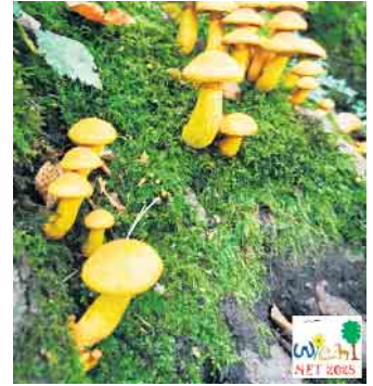
Eine Exkursion in die geheimnisvolle Welt der Pilze gibt es am 27. September.

haben? Oder dass Bäume sich mit Hilfe der Pilze unterhalten können? Das und noch viel mehr lernen die Teilnehmenden bei der Pilzexkursion für Familien mit Kindern im Grundschulalter. Treffpunkt ist an der Tropfsteinhöhle. Anmeldungen zu allen Veranstaltungen sind über QR-Codes möglich, die im Programm abgedruckt sind. Das vollständige Programm lässt sich online herunterladen: wiehl.de/buerger/umweltschutz/naturerlebnistage . Weitere Infos gibt es bei Sandra Heibach, Telefon: 02262 99-213, E-Mail: s.heibach@wiehl.de .