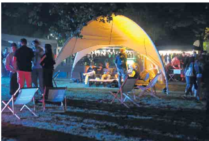
Stimmungsvolles, chilliges Ambiente und ein attraktives Programm zog am 29. August viele Jugendliche in den Park.

Leute in den Park an der Wiehler Wasser-Welt. Das Wetter schien zwar zunächst nicht mitzuspielen, aber im Lauf