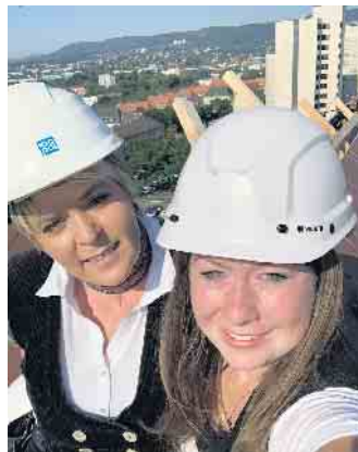
Klimaschutz, keine reine Männersache; es gibt auch Frauen im Dachdeckerhandwerk.

Dach oder planen Gründächer. In Deutschland gibt es immerhin 120 Millionen m2 begrünte Dachflächen. Das sorgt für Kühlung und Luftbefeuchtung, aber auch für Lärm- und Schallschutz. Junge Leute, die gerne im Handwerk arbeiten und dabei auch Klimaschützer sein wollen, liegen mit einer Ausbildung im Dachdeckerhandwerk genau richtig“, rät ZVDH-Präsident Dirk Bollwerk und ergänzt, dass das Dachdeckerhandwerk bislang auch gut durch die Coronakrise gekommen sei: kaum Kurzarbeit und wenige Entlassungen. Auch dies ein Pluspunkt, der für eine Dachdecker-Ausbildung spricht: Dachdecker sind immer gefragt. Mehr Infos unter www.dachdeckerdeinberuf.de (akz-o)