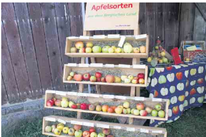
Apfelsortenschau beim Obstwiesenfest im LVR-Freilichtmuseum Lindlar.