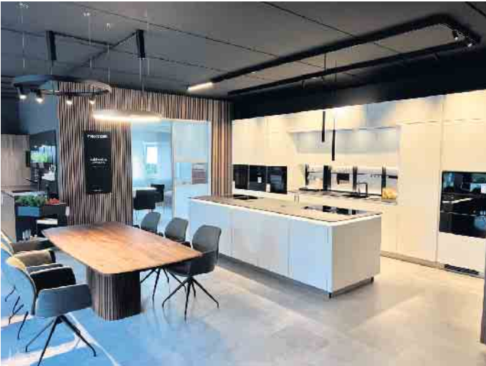
Die neue Showküche mit BORA- und Miele-Geräten, die an beiden Eventtagen zum Einsatz kam.

Die beiden Eventtage waren vielversprechend: von kulinarischen Köstlichkeiten über leckere Cocktails an der Bar, Kaffeespezialitäten am Coffee-Bike und natürlich die Kombination aus Wein und Kunst in Form der Ausstellung des Weinsommeliers Philipp Haas. Im Fokus stand natürlich immer das neue Küchenstudio mit mehreren großzügigen Küchen der Firma next125. Von exquisiten kulinarischen Genüssen bis hin zu faszinierender Kunst waren es zwei unvergessliche Tage voller Genuss und Inspiration. Am 1. September begann die zweitägige Veranstaltung. Der Bora Showkoch entführte die Gäste auf eine kulinarische Reise, während an der Cocktailbar erfrischende Getränke serviert wurden. Der talentierte Künstler Philipp Haas, der mit einzigartigen Werken aus Materialien des Moselweinbergs alle in seinen Bann zog, präsentierte stolz seine HEM-Collection. Diese faszinierende Verschmelzung von Kunst und Genuss stellte die Schönheit von HEM Moselweinen und Crémants in den Mittelpunkt. Am nächsten Tag erfolgte die offizielle Eröffnung des neuen Küchenstudios. Hier konnten die Gäste nicht nur die leckeren Kochkünste des Miele Showkochs erleben, sondern auch Kaffeespezialitäten