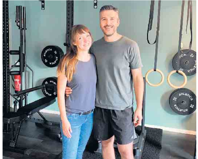
Die neuen Betreiber des Fitnessflair in Wiehl

ber das neue Personal-Training-Fitnessstudio Fitnessflair in der Brucher Straße in Wiehl eröffnet. Der Wiehlpark ist ein Ort zum Wohlfühlen, der mit Freude erschaffen wurde. Mit eben dieser Freude sollten die Besucherinnen und Besucher dort ihre kostbare Zeit verbringen. Lilli Voß (LiV)