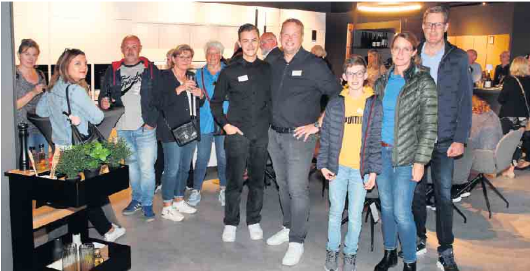
Eine der neuen next125-Küchen im Küchenstudio inklusive Beleuchtungskonzept der Firma DELTA LIGHT.

Werkshagen-Teams, sondern auch eine Hommage an die Leidenschaft und Kreativität, die in den Küchen aus dem Einrichtungshaus Werkshagen stecken.