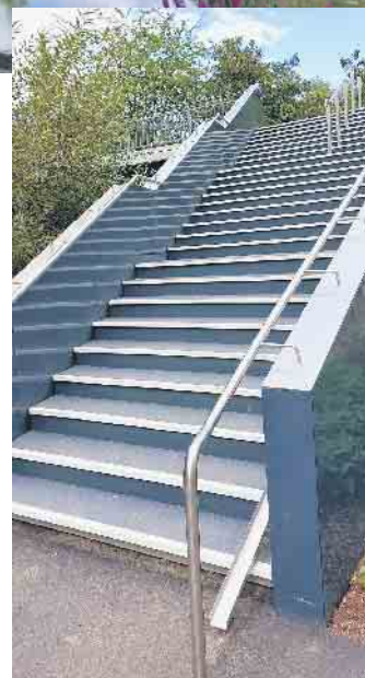
Neue Treppe zur Bahnhofstraße

In seiner Rede ging Wiehls Bürgermeister u.a. auch auf die Beweggründe ein, die Neugestaltung