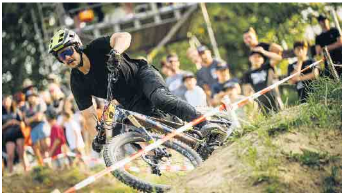
Erster E-Mountainbike-Worldcup auf deutschem Boden.