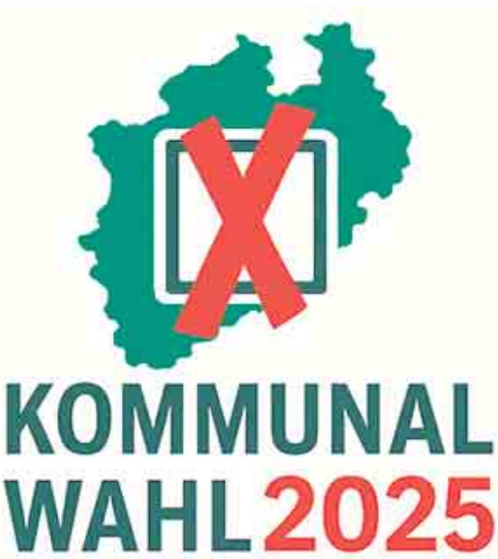
Am 14. September wird in den NRW-Kommunen gewählt. Grafik: Günther Melzer

bei der Stadt Wiehl einige Neuordnungen von Straßen und Ortschaften erfolgt. Deshalb sollten die Wahlbenachrichtigungsbriefe genau überprüft werden. Auf der Sonderseite findet sich außer allgemeinen Informationen auch einen Überblick über Stimmbezirke und Wahllokale. Zudem gibt es eine Übersicht über die aufgestellten Kandidatinnen und Kandidaten in den einzelnen Wahlbezirken sowie die Reservelisten. Eine FAQ-Rubrik beantwortet die wichtigsten Fragen. Sobald die Unterlagen im Rathaus vorliegen, kann man sich auch die jeweiligen Stimmzettel anschauen. Sollten Stichwahlen erforderlich werden, finden sie zwei Wochen später statt: am 28. September 2025. Der Link: https://www.wiehl.de/aktuelles/nachrichten/9174-sonderseite-zur-kommunalwahl-2025.html