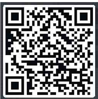
Anmelden zur Veranstaltung am Hans-Teich

Spuren der Fledermäuse entdecken: Dazu laden die Naturerlebnistage 2025 ein. Am 25. August geht es dazu an den Hans-Teich nach Oberwiehl. Ab 20:00 Uhr gibt es Gelegenheit, die Tiere bei ihrer lautlosen Jagd zu beobachten. Gerade an den Hans-Teich kommen am Abend viele Fledermäuse. Die Veranstaltung informiert über die Batman-Vorbilder und fördert Erstaunliches über sie zutage. Treffpunkt ist der Parkplatz am Teich. Eingeladen sind Familien und Erwachsene. Wer dabei sein möchte, sollte sich mit Hilfe des QR-Codes anmelden.