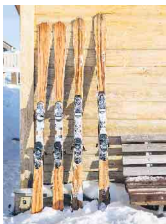
Furnierte Skier sind ein echter Blickfang.