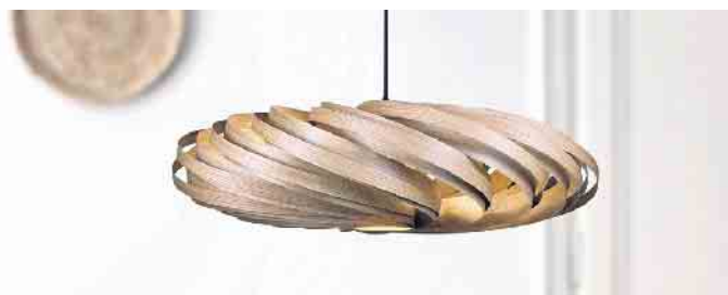
Mit Furnierleuchten wird jeder Raum aufgewertet.

Initiative Furnier + Natur (IFN) e.V. Weitere Infos zum Thema Furnier unter www.furnier.de oder www.furniergeschichten.de sowie auf Instagram unter #furnier_und_natur