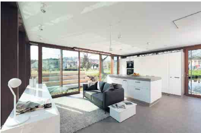
Wie sich auf 39 m² wohnen, kochen, essen, schlafen und arbeiten lässt, zeigt diese elegante Lösung. Highlights sind die Kochinsel mit auszieh- barer Esstheke und die Küche, die bei Bedarf hinter Schiebetüren verschwindet.

Damit die Tätigkeiten an der Spüle auch in kleinen und Tiny Kit-chen flott und angenehm von der Hand gehen, hat die Zubehörin- dustrie entsprechende Modelle konzipiert: zum Beispiel schicke Einbeckenspülen. Trotz ihrer kompakten Maße bieten sie erstaun- lich viel Platz im Becken. In Kom- bination mit einem hochfunktio- nalen Spülenzubehör lässt sich der Komfort an diesen Spülen noch steigern. Abgerundet wird das Ganze dann noch mit einem Ab- fallsammler, der am besten direkt unter der Spüle eingebaut wird. (AMK)