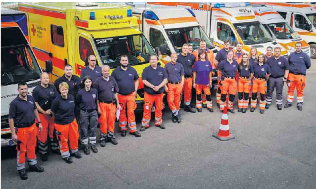
Die Einsatzkräfte des PT-Z 10, Einsatz in Köln.

können. Glücklicherweise verliefen jedoch sowohl das Spiel als auch die Nebenveranstaltungen ruhig und es kam zu keiner Alarmierung der Behandlungsplatz-Bereitschaft. Deutlich öfter gefordert war der sogenannte Patiententransportzug 10 (PT-Z 10). Diese taktische Einheit besteht aus insgesamt 20 Einsatzkräften der oberbergischen Hilfsorganisationen und des kreiseigenen Rettungsdienstes, die mit insgesamt neun Fahrzeugen im Bedarfsfall den Transport von bis zu zehn Patientinnen und Patienten übernehmen können. Diese Einheit wurde während der gesamten Europameisterschaft für insgesamt sieben Einsätze vorgeplant. Teils in Sitzbereitschaft im Oberbergischen Kreis, vergleichbar mit der „Behandlungsplatz-Bereitschaft 50 NRW“, zweimal jedoch auch direkt vor Ort in Köln. Dazu fuhren die Einsatzkräfte im Verband in die Domstadt und standen in einem vordefinierten Bereitstellungsraum in Köln-Deutz bereit. Im Falle von Groß-