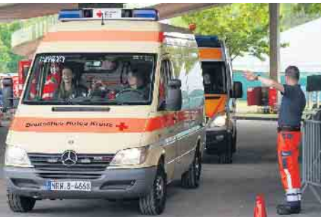
In vordefinierten Bereitstellungsräumen standen die Einsatzkräfte bereit, um im Bedarfsfall eingesetzt werden zu können.

In den darauf folgenden drei Stunden können nochmals insgesamt 50 Personen versorgt werden. Personell besteht die Behandlungsplatz-Bereitschaft aus über 100 Einsatzkräften mit unterschiedlichen Funktionen und Ausbildungen. Diese Einheit stand während des Spiels Ungarn-Schweiz am 15. Juni in Wiehl-Bomig bereit und hätte im Einsatzfall innerhalb weniger Minuten in Richtung Köln starten