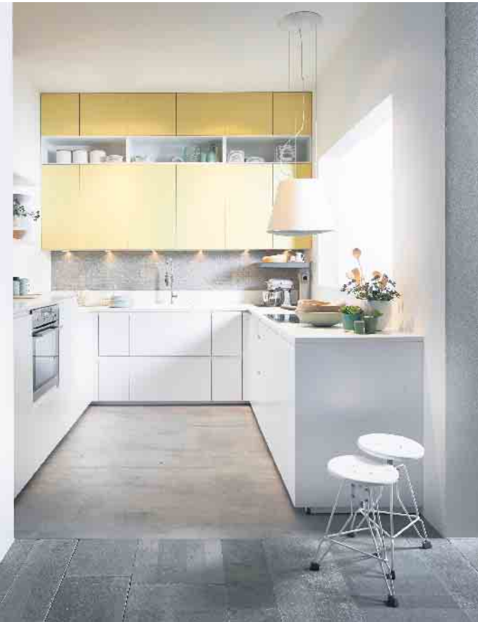
Je weniger Grundfläche zur Verfügung steht, desto mehr wird in die Höhe geplant wie bei dieser sehr ansprechenden Lösung mit reichlich Stauraum und modernen, softmatten Oberflächen in hochwertigem Echtlack.

chen, Spülen und Kühlen wie ein Professional: 45 cm hohe Kompakt-Einbaugeräte in einen Hochschrank neben- oder übereinander integriert - sie sorgen garantiert dafür, dass in kleine Lifestyle-Küchen ebenso viel Komfort, Energieeffizienz, Funktionalität und innovative Technologien einziehen, wie man sie auch aus großen, offenen Wohnküchen kennt. Eine weitere interessante Option sind 2in1-Produkte wie Induktionskochfelder mit einem integrierten Dunstabzug. Für eine verlängerte Frische von empfindlichen Lebensmitteln plus Vitaminerhalt planen die Küchenspezialisten attraktive Einbau-Kühl-/Gefriergeräte je nach der individuell gewünschten Nischenhöhe ein. Und wo kein großer Geschirrspüler Platz hat, tut es auch ein 45 cm schmales Einbaugerät mit der gleichen Komfortausstattung und Effizienz wie ein Modell in Standard-Size. Viele 45er-Modelle arbeiten zudem sehr leise, was sie auch für Appartements attraktiv macht.