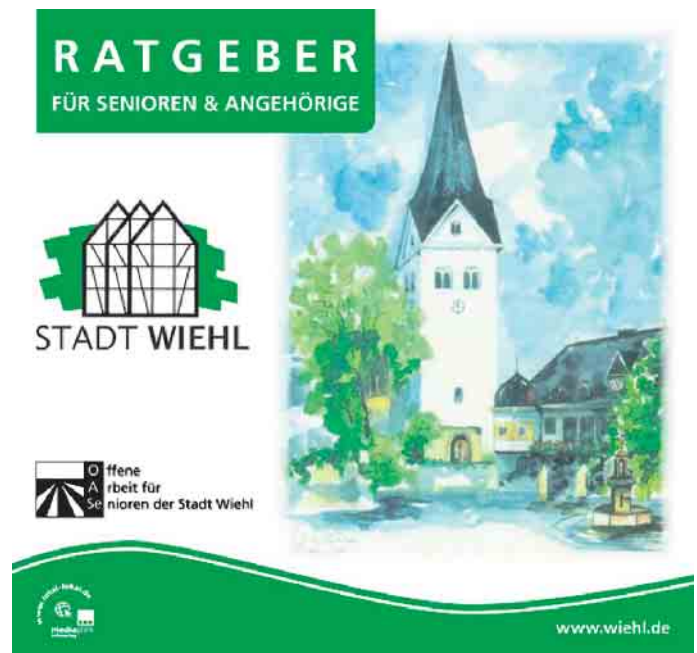
Das Titelbild des Ratgebers zeigt ein älteres Aquarell von Rathaus und Kirche im Wiehler Zentrum.