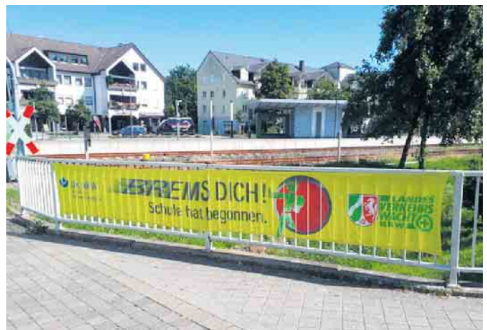
Banner sorgen für Aufmerksamkeit mit Blick auf den Beginn der Schule.

ter erschweren nicht nur den Kindern, sondern auch Autofahrerinnen und Autofahrern erheblich die Sicht - deshalb sind die Kinder als Verkehrsteilnehmer zusätzlich gefährdet.