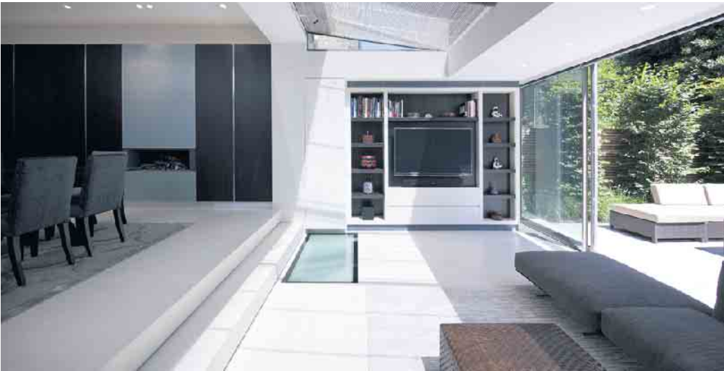
Bei Panoramafenstern bieten sich Sonnenschutzverglasungen besonders an.

hervor. „Diese Systeme sind außerdem auch bei starkem Wind nutzbar, vor Witterungseinflüssen und Verschmutzungen geschützt und in der Regel dauerhaft wartungsfrei.“ (BF/FS)