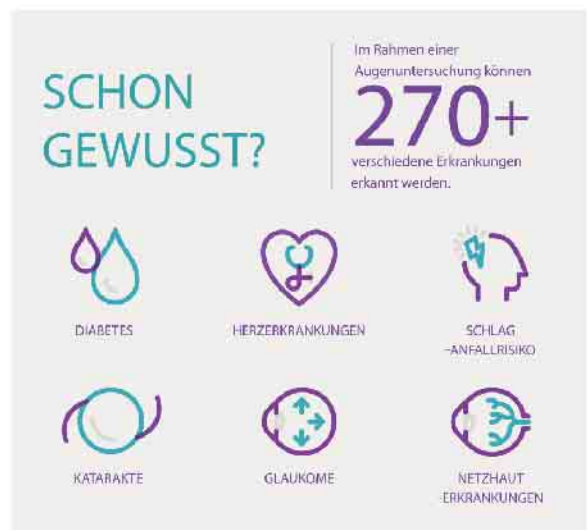
Im Rahmen einer Augenuntersuchung können viele Erkrankungen erkannt werden.