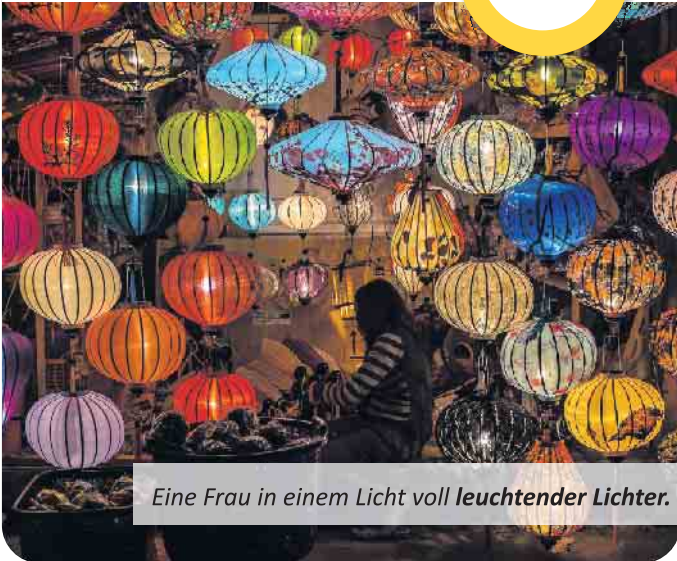
Eine Frau in einem Licht voll leuchtender Lichter.