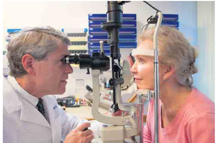
Weniger als 37 Prozent der deutschen Erwachsenen lassen ihre Augen mindestens einmal im Jahr untersuchen.

Die Umfrage ist Teil der Kampagne „Priorität für Ihre Augen“, die im Februar 2020 von Johnson & Johnson Vision ins Leben gerufen wurde. Ziel der Aktion ist es, das Bewusstsein für die Bedeutung der Augengesundheit zu schärfen und jeden zu ermutigen, sich jährlich einer Augenuntersuchung zu unterziehen. (djd)