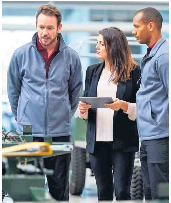
Der regelmäßige Austausch von Führungskräften und Mitarbeitern ist wichtig, um mögliche Gesundheitsrisiken zu erkennen.

de auf der Arbeit zeigt, häufiger aufgebracht reagiert oder weniger leistungsfähig ist, sind das Anhaltspunkte für eine psychische Beeinträchtigung.“ Kollegen und Chefs sollten sich dann nicht scheuen, den Kontakt zu suchen und Hilfe anzubieten. Häufig kann bereits ein Gespräch mit der Vertrauensperson im Betrieb entlastend wirken, zudem sind Hausärzte eine geeignete erste Anlaufstelle. (djd)