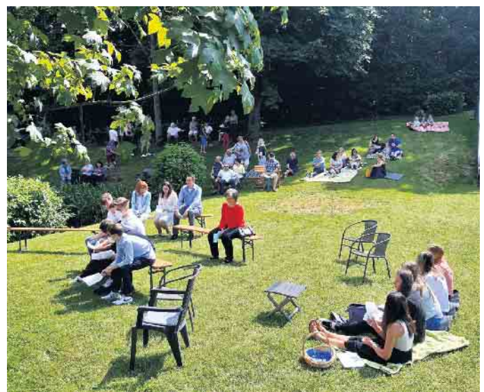
Taufe Dorfweiher Forst.