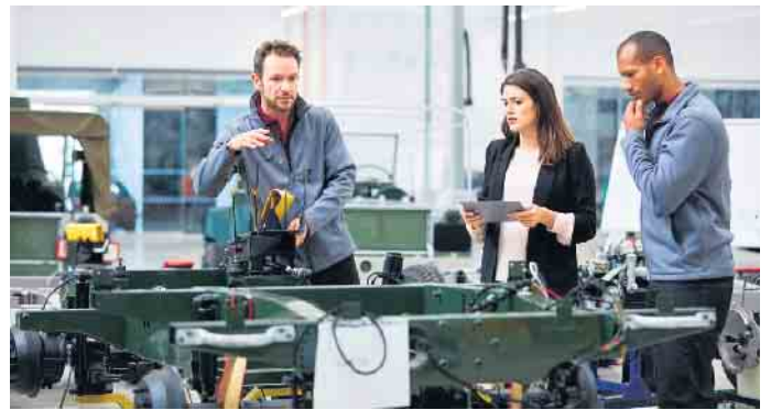
Vorbeugung ist der beste Schutz: Regelmäßige Mitarbeiterschulungen tragen zu mehr Arbeitssicherheit bei.