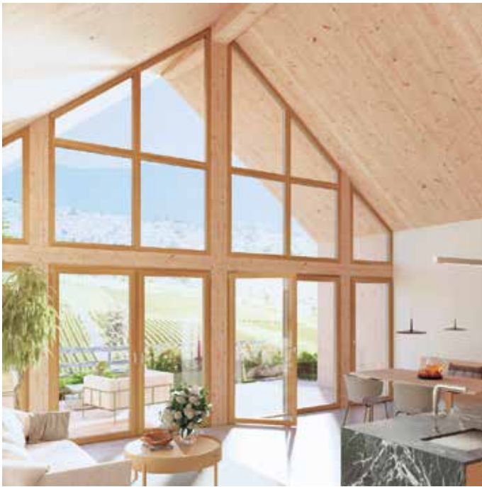
Bei großen Fensterfronten ist der Energiespar-Effekt von gut gedämmten Fenstern besonders groß.

Steigende Energiepreise bereiten vielen Haushalten Sorgen. Wer seine Heizkosten dauerhaft senken möchte, kann mit modernen Fenstern viel erreichen. Der Verband Fenster + Fassade erklärt, wann sich ein Fenstertausch lohnt, und welchen Effekt neue Fenster für Wohnkomfort und Sicherheit haben.