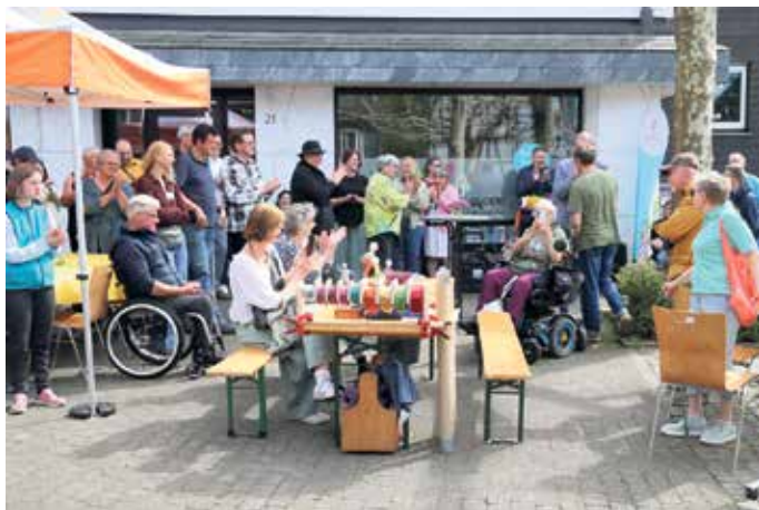
Buntes Leben herrschte bei dem Aktionstag vorm Treffpunkt Inklusion im Weiher.

Zu einem Treffpunkt voller Begegnung, Austausch und gelebter Inklusion wurde das Wiehler Zentrum beim Aktionstag „Sichtbar sein - Gemeinsam enthindern“ des Projekts „Wiehl enthindert“.