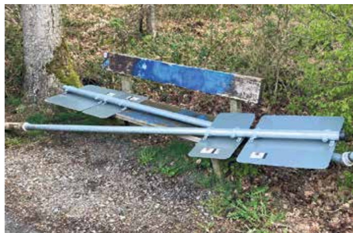
Erneut wurde das Schild des Behinderten-Parkplatzes an der Turnhalle Marienhagen aus der Verankerung gerissen.

diesen Anspruch einzulösen“, sagt die städtische Projektverantwortliche Astrid Wollenweber - und appelliert an Einsicht und Vernunft.