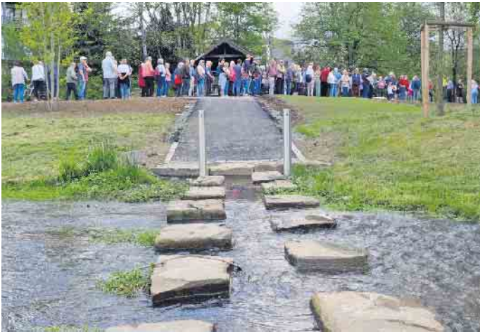
Lob gab es auch für den neu gestalteten Mottelbach, der nun in einem naturnahen Bachbett durch den Park fließt; die Furt lädt Mutige zum Überqueren ein.

tung der Wege und Plätze und ob die Wiese als Startplatz für die Heißluftballone geeignet sei. „Die Beleuchtung wird analog der Lampen im alten Kurpark funktionieren und auf Bewegung reagieren“, informierte Pascal Hilgenberg. Und für den Ballonstartplatz wurde ein Teil der großen Wiesenfläche mit Schotterrassen verstärkt, was einen festeren Untergrund ergibt. An vielen Stellen des Rundgangs war die Vorfreude der Gäste zu spüren auf das, was ab Sommer geboten wird. Junge Familien etwa zeigten sich begeistert vom neuen Spielbereich mit den Piratenschiffen und vom Seiltunnel, der anstelle der Hängebrücke Kindern ein Überqueren der Wiehl ermöglicht. Die Erwachsenen warfen eher Blicke auf das Seecafé und die angrenzenden Grillplätze. Auch der natürlich durch den Park fließende Abschnitt des umgestalteten Mottelbachs war Anlass für Lob. „Wir haben nicht unerhebliche Mittel in die Gestaltung von Park, Straßen und Plätzen gesteckt, ich denke, das Geld ist sehr gut investiert“, so Ulrich Stücker bei seiner Begrüßung auf dem Rathausplatz. „Ich bin der Überzeugung, dass die Zukunft von Kommunen auch davon abhängt, wie attraktiv deren Freiflächen sind und wie hoch die Aufenthaltsqualität ist“, ergänzte er. Herzlich bedankte sich Ulrich Stücker beim Team der Fachbereiche Hoch- und Tiefbau sowie bei der stellvertretenden Baudezernatsleiterin Alexandra Noss: „Dass Wiehl aus dem Städtebauförderungsprogramm 2023 rund 2,77 Millionen Euro