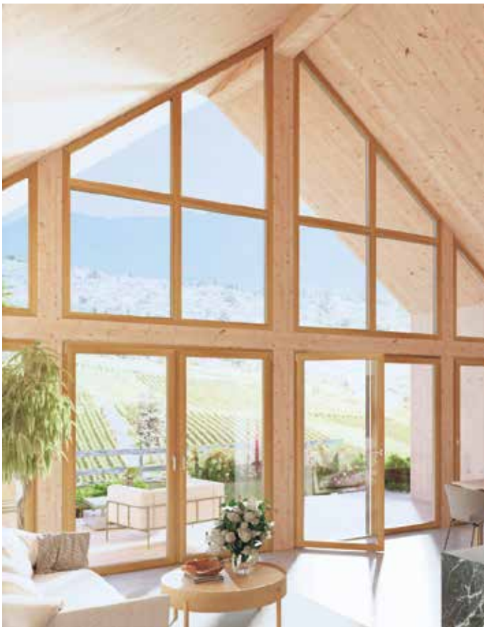
Bei großen Fensterfronten ist der Energiespar-Effekt von gut gedämmten Fenstern besonders groß.

tische Modernisierung von alten Fenstern“ aufbereitet.