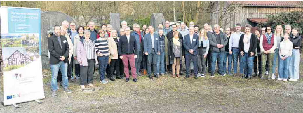
18 Dorfgemeinschaften freuen sich über die bewilligten Fördergelder des Oberbergischen Kreises, mit denen sie ihre insgesamt 24 Projekte jetzt umsetzen können.