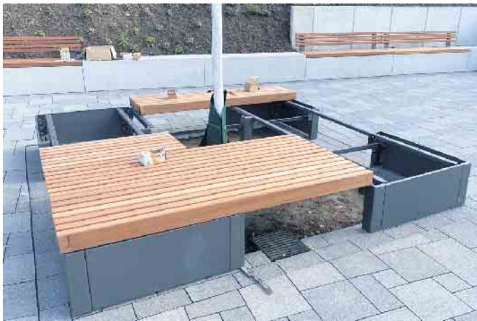
Neue Sitzelemente setzen optische Akzente und schaffen Aufenthaltsqualität vor dem umgestalteten Haupteingang.

Bauarbeiten am Stadtteilhaus Drabenderhöhe auf der Zielgeraden