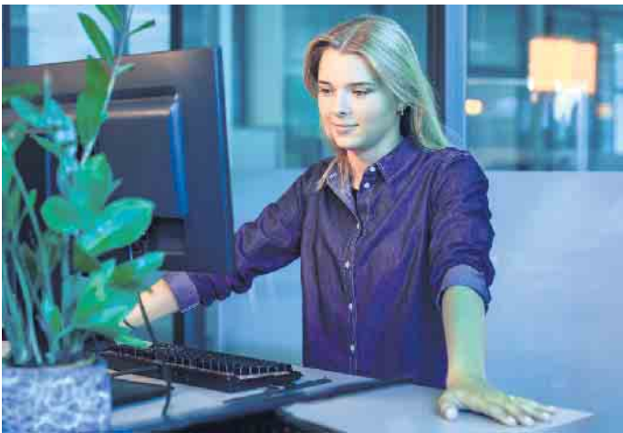
Informatikerinnen und Informatiker haben sich inzwischen auch in zahlreichen Gebieten des Fitness- und Gesundheitsmarkts etabliert.

Fitnessbranche: Technikorientierter dualer Studiengang mit spannendem Ansatz