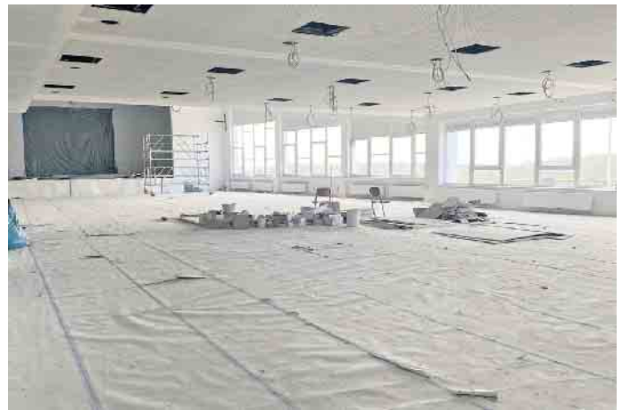
Im großen Saal sind die alten Holzverkleidungen verschwunden und eine neue Decke sorgt für beste Akustik.

Am 11. Mai wird das neue Stadtteilhaus Drabenderhöhe mit einem kleinen Fest eröffnet. Aus dem alten Kulturhaus entsteht jetzt ein modernes Begegnungszentrum mit vielfältigen Möglichkeiten. Derzeit bestimmen noch Fahrzeuge verschiedener Handwerksbetriebe das Bild in der Drabenderhöher Straße Unterwald. Unterschiedliche Gewerke sind damit beschäftigt, das Umfeld neu zu gestalten und im Innern des Stadtteilhauses Drabenderhöhe Alt und Neu zu verbinden. Zumeist verrät der Bodenbelag, welche Gebäude- teile hinzugekommen sind und wo es sich um Bestand handelt.