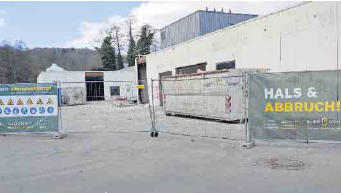
Die früheren Pro-Markt-Gebäude werden derzeit entkernt; der Abriss soll ab Mitte April erfolgen.