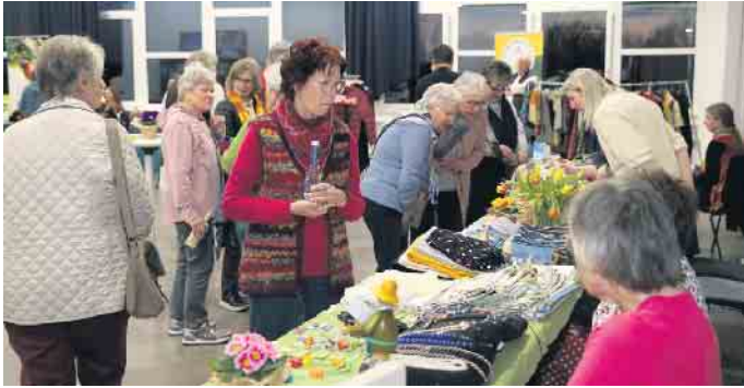
Der „faire Basar“ zeigte großes Interesse seitens der Kundschaft an den fair gehandelten bzw. hergestellten Produkten.

Ein buntes und vielfältiges Angebot, beste Stimmung, aber auch kritische Diskussionen: Der zweite Wiehler „Faire Basar“ rund um fair gehandelte Produkte lockte am 7. März 2025 nach Drabenderhöhe. Im Stadtteilhaus waren zahlreiche Anbieterinnen und Anbieter vertreten. So präsentierte sich der Weltladen Nümbrecht mit Dekorativem und heiteren Accessoires für den Ostersisch. Hier wie auch am Stand des Wiehler Geschäfts „Schön Ding und Weile“ konnten die vielen Gäste zauberhafte Kleidung erwerben - und dabei sicher sein, dass bei der Herstellung faire Löhne gezahlt worden sind. Daneben spielte auch Ucyding eine wichtige Rolle. So waren die süßen „Bretzi“-Tiere von Künstlerin Christine Bretz zuvor abgelegte Pullover, die zerfledderte Jeans hatte sich in eine hübsche Tasche oder einen Rock verwandelt. Und die hinreißenden Patchworkdecken des