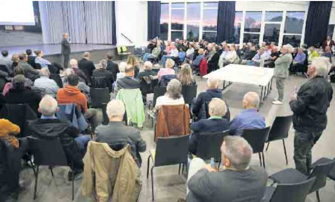
Am 3. April gibt es nochmals Gelegenheit, an der Gestaltung des Baugebiets „Auf der Höhe“ mitzuwirken.