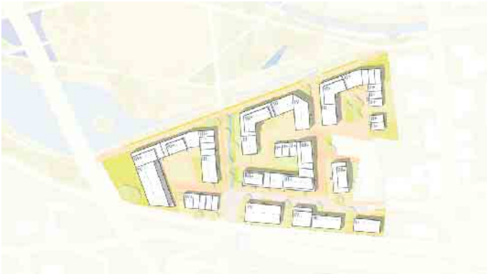
Der Rahmenplan zeigt die vorgesehene Struktur des Baugebiets.