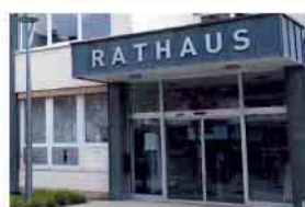
Wiehl-Ticket Tel. 02262-99285