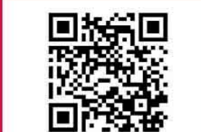
oder über www.kulturkreis-wiehl.de