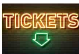
Tickets ab dem 17. März erhältlich!