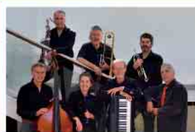
Dusty Lane Jazzband 27.11.25