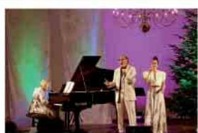
Souvenir de Noël 11.12.25