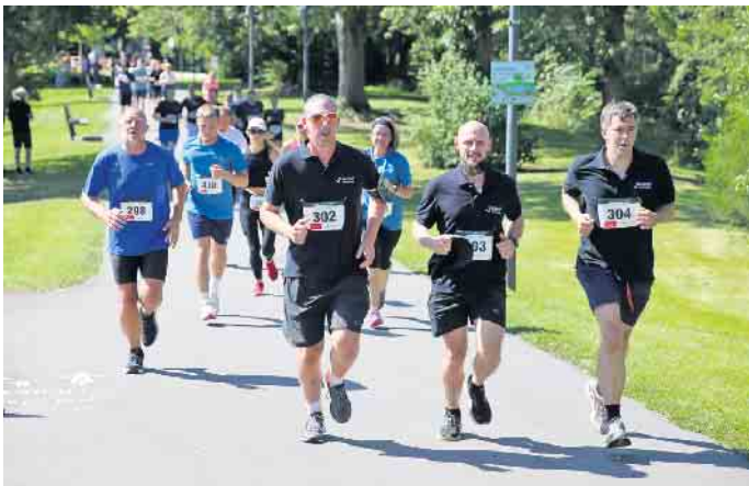
Wie hier bei der Premiere im Vorjahr, geht es beim diesjährigen Wiehler Sommerlauf wieder durch die Wiehlaue.

Die Premiere des Laufs im vergangenen Jahr geriet zu einem großen Erfolg. Über 400 Sportlerinnen und Sportler haben 2024 gezeigt, was in ihnen steckt und so das Event zu einem echten Highlight gemacht. Für dieses Jahr erwartet der Stadtsportverband noch mehr Aktive, zumal spannende Neuerungen anstehen. So werden Streckenführungen und -längen angepasst. Darüber hinaus stehen nicht nur Bambini- und Schülerlauf sowie Jedermann- und Hauptlauf auf dem Programm, sondern es kommen auch Walker und Nordic Walker mit einem eigenen Format zum Zuge. Wer in welcher Kategorie auch immer mitmachen möchte, kann sich jetzt online über die Internetseite des Stadtsportverbands