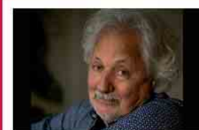
Konrad Beikircher 20.11.25