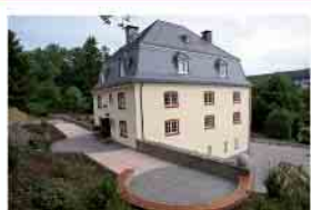
Burghaus Bielstein Herbst 2025