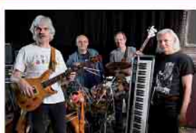
Into Deep 25.09.25