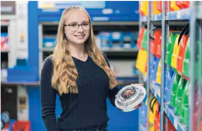
Kaufleute für Groß- und Außenhandelsmanagement sorgen für einen reibungslosen Warenfluss.

Kaufleute für E-Commerce betreuen Onlineshops, entwickeln Marketingmaßnahmen, analysieren Prozesse und vieles mehr. Auch im Technischen Handel wächst der