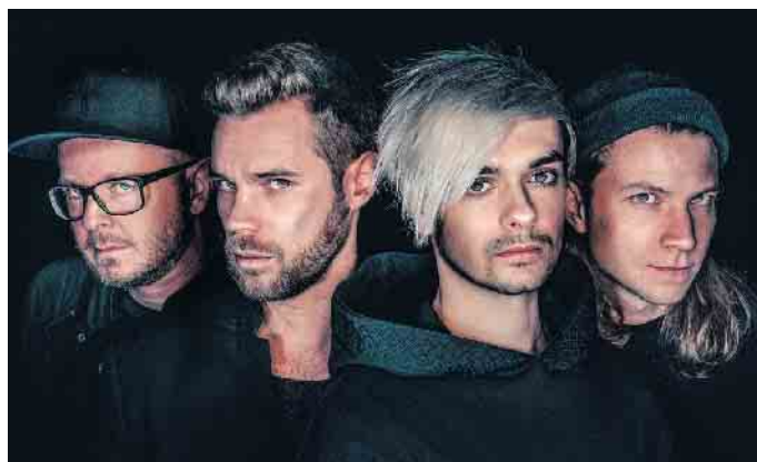
„Vier gewinnt“ covern am 26. Oktober die Songs der Fantastischen Vier.

Seit angeblich 300.000 Jahren baselt der Mensch aufrecht über den Planeten, aber an seinem Hirnstamm hat sich so gut wie nichts weiterentwickelt. Das erklärt vielleicht die eine oder andere Verhaltensweise, macht aber wenig Hoffnung. Fritz Ecken-