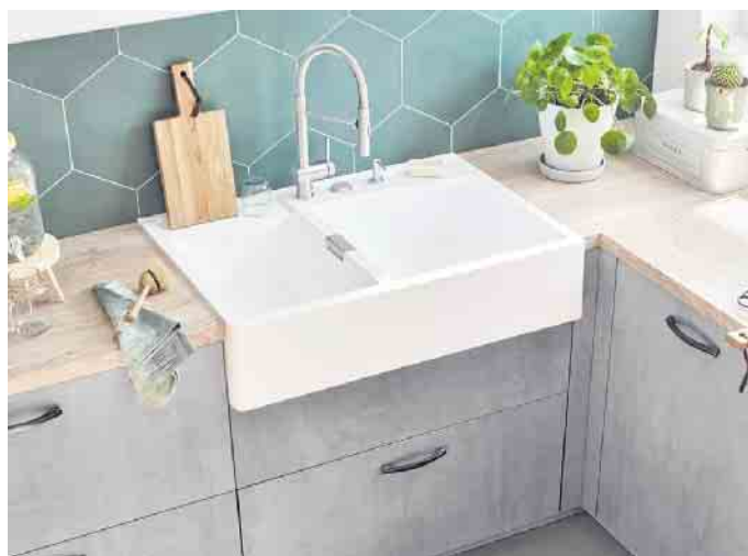
Nachhaltiges Granitspülenmodul mit seidenmatter Premium-Oberfläche und Abperleffekt, was sie besonders reinigungsfreundlich macht. Am Ende ihres Lebenszyklus wird sie in einen Recycling-Kreislauf zurückgeführt.

sign und eine sehr angenehme Haptik. Ob es nun eine formschöne Edelstahl-, Keramik- oder Granitspüle wird, seine finale Kaufentscheidung sollte man am besten in einem Küchenstudio oder in einem Möbelhaus treffen“, empfiehlt AMK-Geschäftsführer Volker Irle. (AMK)