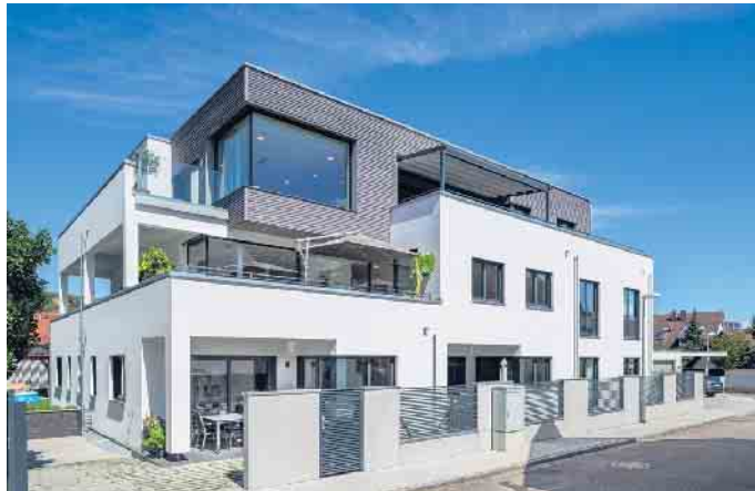
Mehrgenerationenhäuser in Holz-Fertigbauweise sind im Kommen.

Das Mehrgenerationenwohnen unter einem Dach kehrt zurück: Nach Jahrzehnten mit immer mehr Singlewohnungen, zunehmender Urbanisierung und Individualisierung planen wieder mehr private Bauherren ein Eigenheim am Stadtrand oder im Grünen als generationenübergreifende Lösung. „Ob als Doppelhaus, Einfamilienhaus mit barrierefreier Einliegerwohnung oder als WG mit gemeinsamer Küche - es gibt mehrere bewährte Konzepte für das Mehrgenerationenwohnen, die von Fertighaus-Bauherren individuell geplant und zukunftsicher realisiert werden“, sagt Fabian Tews, Pressesprecher des Bundesverbandes Deutscher Fertigbau (BDF). Früher war es normal, dass mehrere Generationen in einem Haus