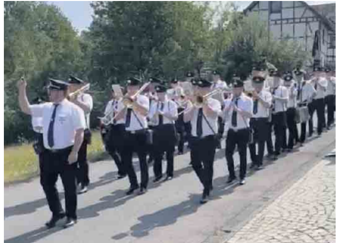
In diesem Jahr feiert der Musikzug Bergerhof sein 125-jähriges Bestehen

spiel von Bergerhof und darüber hinaus. Zu erwähnen sei noch das erstmalige Ausrichten von „Weihnachten unter der alten Schule“. Diese Veranstaltung fand großen Anklang und ist auch für dieses Jahr wieder mit in der Planung. Neuwahlen standen nicht an und somit bleibt der Vorstand personell so bestehen wie im Vorjahr. Zur größten Herausforderung zählt wohl die Jugendarbeit. Hier ist die Lage sehr angespannt und bedarf der Unterstützung aus Politik, Kultur und Trägergemeinschaften wie Kindergärten und Schulen. „Wir fühlen uns hier ein Stück weit vernachlässigt und würden uns über mehr Kooperationsbereitschaft freuen“. Geplant ist für dieses Jahr ein Kinderkonzert. Des Weiteren richtet die Johanner Kita Wildbergerhütte in Zusammenarbeit mit dem Musikzug ein Musical aus, woran schon fleißig geprobt wird. Für dieses Jahr ist der Terminka-