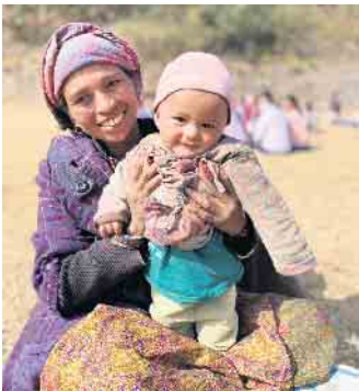
Viele Mütter kamen mit ihren Kindern zum Gesundheitscamp