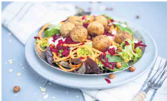
Hafermahlzeiten wie eine Salat-Bowl mit Haferbällchen lassen sich gut vorbereiten.

wendet. So lassen sich beispielsweise zahlreiche Gerichte und Snacks mit Hafer gut vorbereiten und mitnehmen. Die Vollkornflocken liefern dem Körper wertvolle Ballaststoffe und Vitamine wie Vitamin B1, welches das Nervensystem und die Konzentration unterstützt. Zudem helfen Hafermahlzeiten dabei, den Cholesterinspiegel zu senken. Sie sind wahre Energiebooster und halten lange satt, ohne den Magen-Darm-Trakt zu belasten. Overnight Oats oder ein Porridge mit Früchten und Nüssen für das zweite Frühstück im Büroalltag sind schnell am Abend vorher zubereitet. Leckere Snacks zum Mitnehmen sind auch ein Bananen-Haferbrot oder „Italian Energyballs“ aus weißen Bohnen, getrockneten Tomaten, Pinienkernen, Haferflocken und Pesto.