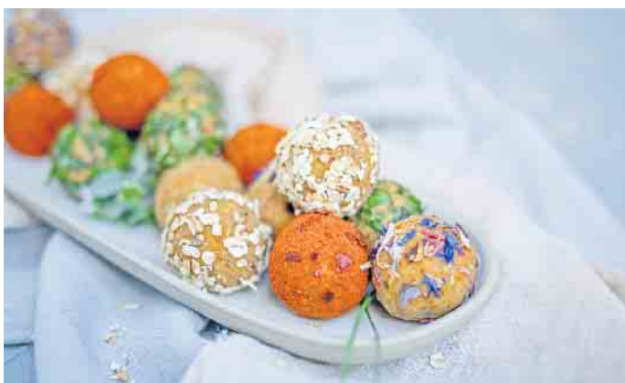
Die veganen „Italian Energyballs“ sind eine gesunde Snackidee.

Haferflocken in einem kleinen Mixer oder Mörser zermahlen. Ei mit Milch und 1/4 TL Salz verquirlen und Haferflocken zugeben. Den Teig 10 Minuten quellen lassen. Nacheinander je 1 TL Öl in einer beschichteten Pfanne erhitzen und aus dem Teig 2 große Crêpes ausbacken und auskühlen lassen. Möhre schälen und mit einem Sparschäler in dünne breite Streifen hobeln. Frischkäse mit Salz, Pfeffer und Curry würzen. Jeden Crêpe mit 1 EL Curryfrischkäse bestreichen, ein paar Salatblätter und Möhrenstreifen darauf verteilen und mit Putenbrustscheiben belegen. Die Crêpes eng zu Wraps aufrollen und zum Mitnehmen in Folie einwickeln. (djd)