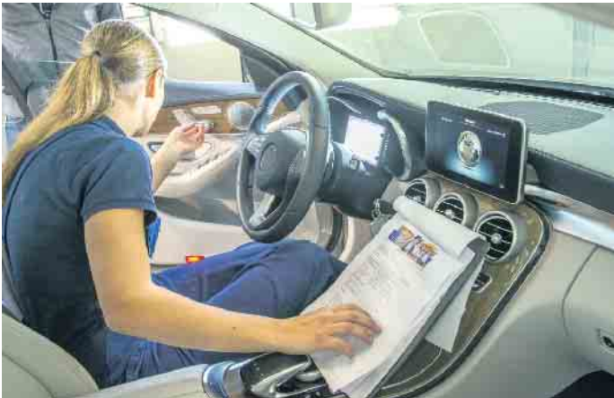
Ausbildungsberufe in der Kraftfahrzeugbranche bieten jungen Menschen gute Entwicklungschancen und zukunftsichere Arbeitsplätze.

Ein typischer Einstieg in technische und kaufmännische Automobilberufe führt über den klassischen dualen Bildungsweg mit betrieblicher Ausbildung und Berufsschule. Unter www.wasmitautos.de gibt es eine Vielzahl von Informationen zu den Berufsbildern und ihren Anforderungen sowie einen Betriebsfinder zur Suche nach Ausbildungsplätzen. Auch die Karrierechancen durch Spezialisierungen und Höherqualifizierung werden beleuchtet. Zweijährige Weiterbildungen eröffnen zum Beispiel Wege zum geprüften Kfz-Servicetechniker, Automobil-Verkäufer oder -Serviceberater. Über den klassischen Kfz-Meister sind Aufstiege zum Werkstattmanager oder Betriebsleiter möglich, und natürlich erlaubt der Meisterbrief die Übernahme oder Gründung eines eigenen Betriebs. Wer noch mehr erreichen will, kann auch akademische Abschlüsse etwa bis zum Bachelor oder Master of Business Administration in technischen und kaufmännischen Studiengängen anstreben. (DJD)