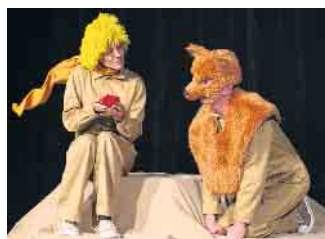
Der kleine Prinz.

Kartenreservierungen können an den bekannten Vorverkaufsstellen oder unter www.reservix.de vorgenommen werden.