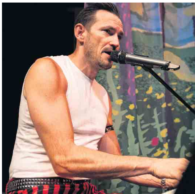
Freddy Mercury.