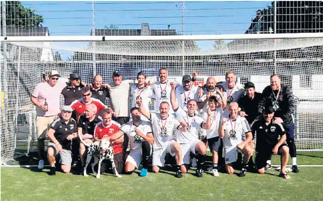
Stadtmeister: SF Troisdorf 05

Dass die alten Herren attraktive Spiele auch bei hochsommerlichen Temperaturen abliefern können, haben die sechs teilnehmenden Mannschaften am Samstag bewiesen. Bei den Spielen ging es hin und her und die Zuschauer erfreuten sich an den vielen Toren. Bei allem Ehrgeiz waren die Spiele sehr fair, so dass die Schiedsrichter nicht viel zu tun hatten. Einen besonders guten Tag hatten die Spieler vom Gastgeber, die sich nun Stadtmeister 2025 nennen dürfen. Durch Siege gegen TuS 07 Oberlar (1:0), Hellas Troisdorf (4:0), Rot Weiß Hütte (3:0), FC Spich (3:0) und einem 0:0 gegen SV Bergheim wurden die 05er ungeschlagen Stadtmeister. Zweiter wurde TuS 07 Oberlar. Der SV Bergheim konnte sich den 3. Platz sichern. Jörg Olbort