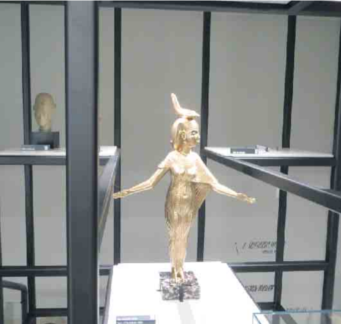
Skulptur im Treppenaufgang neues Museum

Der Förderverein hat neue Angebote für Juli & August