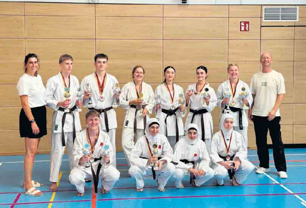
Unser Erfolgsteam vom Karate Dojo Ochi Troisdorf e. V.

Wer sagt eigentlich, dass die Jugend nur Zeit mit digitalen Gadgets verbringt? Unsere jungen Leute können stolz auf sich sein, dass sich der Trainingsfleiß wieder einmal ausgezahlt hat. Ohne engagierte Trainer wäre das nicht möglich. Nach einer langen und erfolgreichen Karriere mit