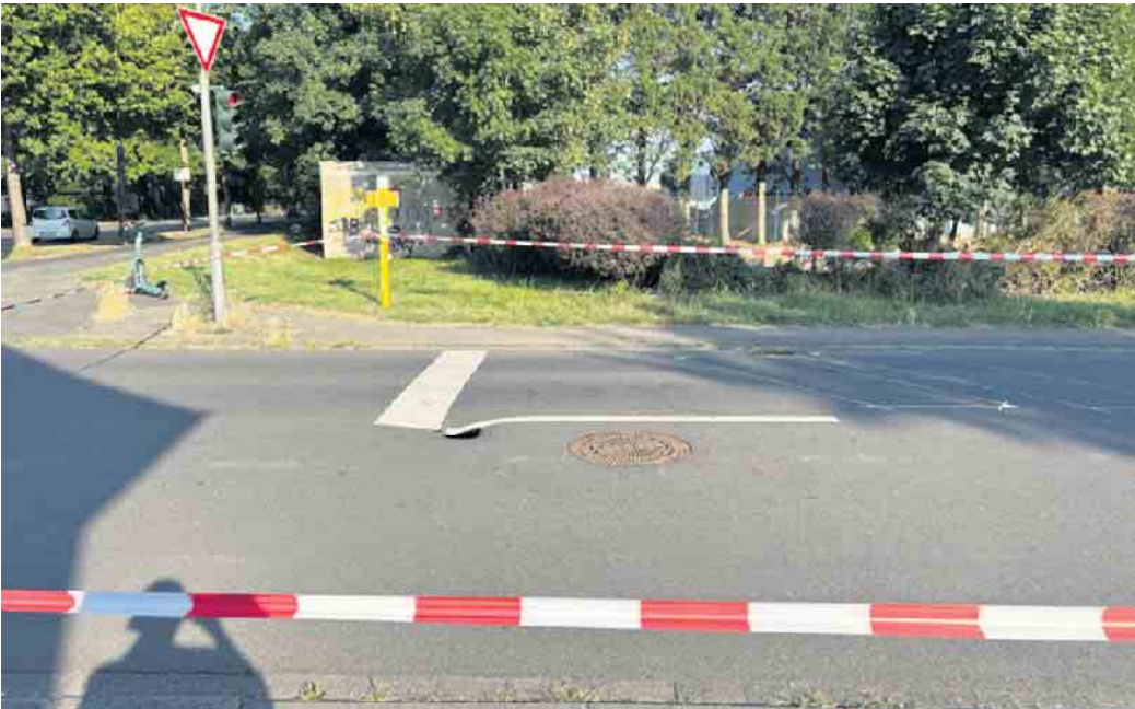
Fahrbahnabsenkung an der Holsteinstraße.

Ebenfalls in Troisdorf-Mitte kommt es seit 01. Juni bis 05. Dezember zu einer Vollsperrung der Paul-Müller-Straße (Hausnummern 11-25, 53840 Troisdorf) in zwei Bauabschnitten. Der Grund ist der umfassende Straßenausbau.