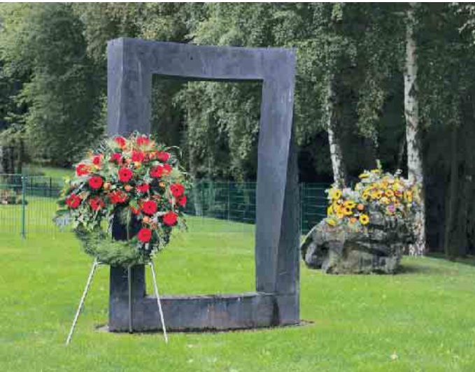
Tor zwischen den Welten.

fall tatsächlich nicht mehr da ist. Viele Bereiche des täglichen Lebens werden nicht mehr so sein wie bisher. Diese Einsicht ist oft so schmerzhaft, dass Menschen manchmal meinen, im Trauerfall besonders stark sein zu müssen, oder versuchen, sich anders abzulenken. Dabei ist es wichtig, die Trauer und damit auch den Schmerz zuzulassen, um den persönlichen Weg der Trauerbewältigung besser finden können. Rituale beim Abschiednehmen Im größten Krematorium Deutschlands, dem Rhein-Taunus-Krematorium, ist man tagtäglich mit Abschied und Trauer konfrontiert. Judith