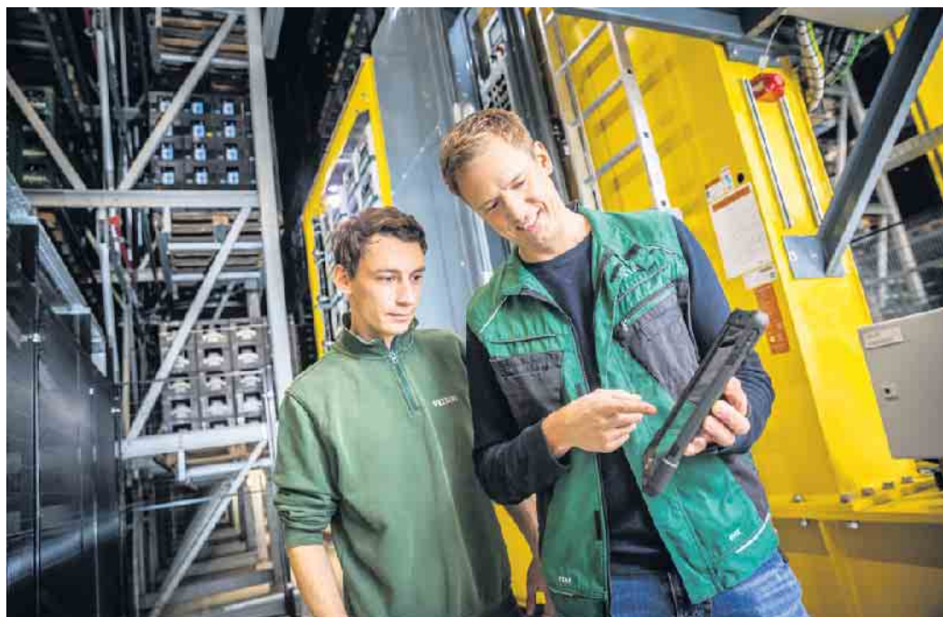
Die Ausbildung zur Fachkraft für Lagerlogistik in der Brauerei dauert drei Jahre, Voraussetzung ist ein Hauptschulabschluss.

Bei der Brauerei C. & A. Veltins beispielsweise finden Auszubildende zur Fachkraft für Lagerlogistik eine vollautomatische Förderer- und Transportsystem vor, die bedient, ge-