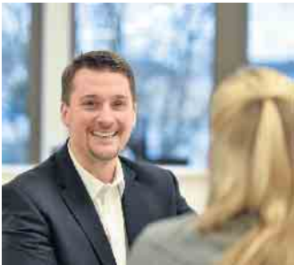
Bürgermeister Alexander Biber im Gespräch

Mittwoch, den 09.07.2025 zwischen 15:30 Uhr und 17.00 Uhr im Rathaus, Raum E69, Kölner Straße 176, 53840 Troisdorf, und am Mittwoch, den 16.07.2025 zwischen 15:30 Uhr und 17.00 Uhr im Rathaus, Raum E69, Kölner