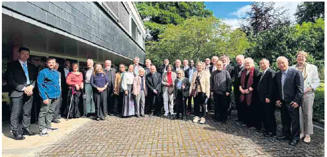
Die Teilnehmer des wissenschaftlichen Teils des Festaktes