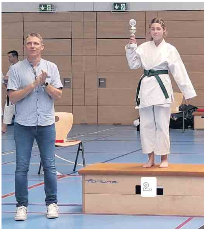
Sophia bei der Pokalübergabe

Troisdorfer Karate-Talente überzeugen in Hennef