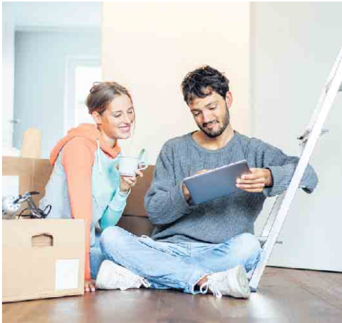
Guter Rat beim Bauen und Modernisieren ist nicht teuer, er kann aber dazu beitragen, den besten Weg zur Erfüllung der persönlichen Wohnwünsche zu finden.

einer baubegleitenden Qualitätskontrolle weitgehend sicherstellen, dass Baumängel oder Abweichungen von vertraglichen Vereinbarungen nicht unentdeckt bleiben. Wer etwa mit Eigenleistungen Geld sparen will, kann ebenfalls mit einem Berater diskutieren, was machbar und sinnvoll ist. (DJD)