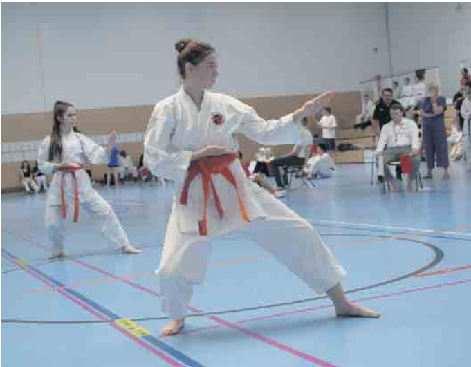
Hochkonzentriert im Kata Finale