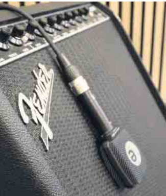
Anmeldungen sind jederzeit möglich.

Ob E-Gitarre, Akustikgitarre, E-Bass, Ukulele oder Baglama - an der Musikschule Troisdorf kommen Saiten-Fans aller Altersklassen und Erfahrungsstufen auf ihre Kosten. Das breit gefächerte Unterrichts-