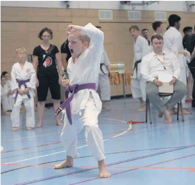
Im Finale alles geben

Diese Erfolge, aber auch die knapp verpassten Treppchenplätze, spor- nen unsere Wettkampfgruppe weiter an. Die gesammelten Er- kenntnisse fließen nun direkt in das weitere Training ein, um Tech- nik, Schnelligkeit und mentale Stärke zu optimieren. Im Herbst stehen bereits die nächsten Tur- niere an, bei denen das Team an die bisherigen Erfolge anknüpfen möchte.