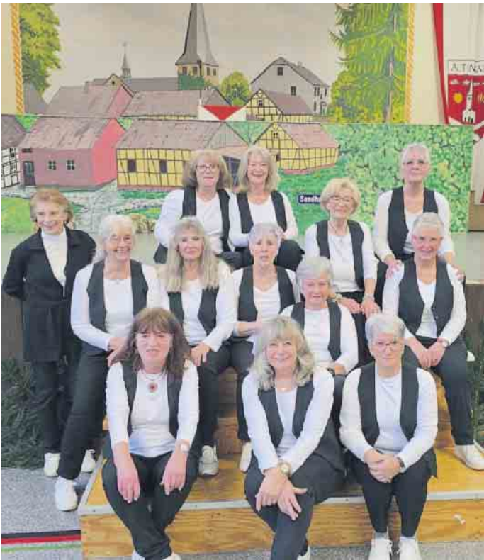
Einige aus der Seniorentanzgruppe vor der Bühne der Josef-Schumacher-Halle

unbedingt die Schrittkombinationen hinbekommen. Danach kommt ein Sportgerät hinzu. Das kann ein Stuhl, Seil, Ball, Luftballon oder etwas anderes sein. Auch rhythmische Gymnastik wird großgeschrieben. Nach modernen Songs werden die Übungen ausgeführt. Das macht nicht nur Spaß, sondern regt auch die Bewegung an, ohne dass man es merkt. Nach den Anstrengungen darf die Entspannung nicht fehlen. Hier setzen wir auf ruhige Musik, die einen in die Entspannung hineingleiten lässt. Seit mehreren Jahren tritt ein Teil der Gruppe auch beim Altenrath Seniorenfest in der Josef-Schumacher-Halle auf. Hier gibt es dann besonders viele anfeuernde Fans.