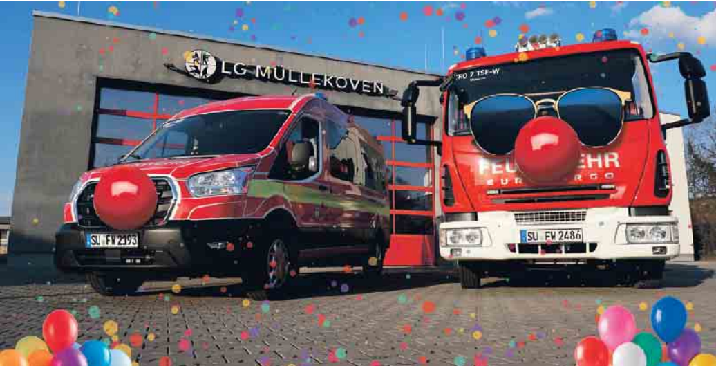
Es wird jeck im Feuerwehrhaus in Müllekoven.

getanzt, geschunkelt und lautstark gesungen werden. Der Eintritt ist frei und ab 18 Jahren. Für das leibliche Wohl ist wie immer bestens gesorgt. Es freuen sich auf ganz viele Besucher die Kameradinnen und Kameraden der Löschgruppe Müllekoven.