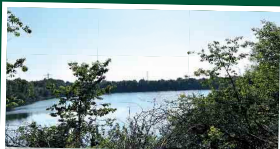
Rückzugsort für Fauna und Flora: Die Spicher Seen.

Ein Naturschutzgebiet schützt Arten, Klima – und schafft Lebensqualität für uns alle.