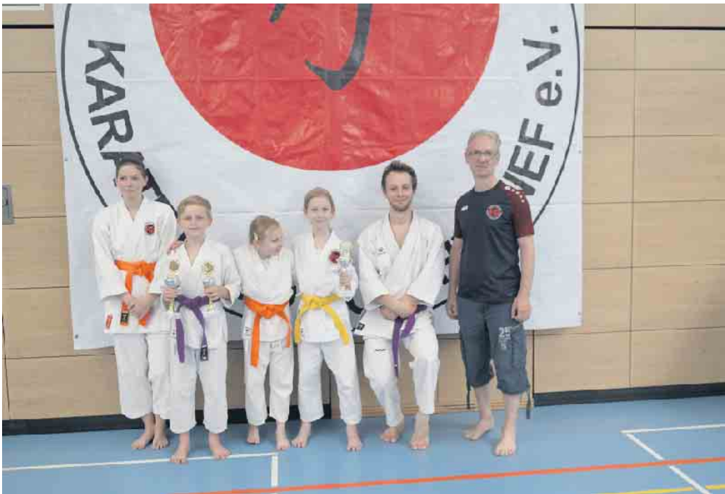
Unsere stolzen Wettkämpfer:innen