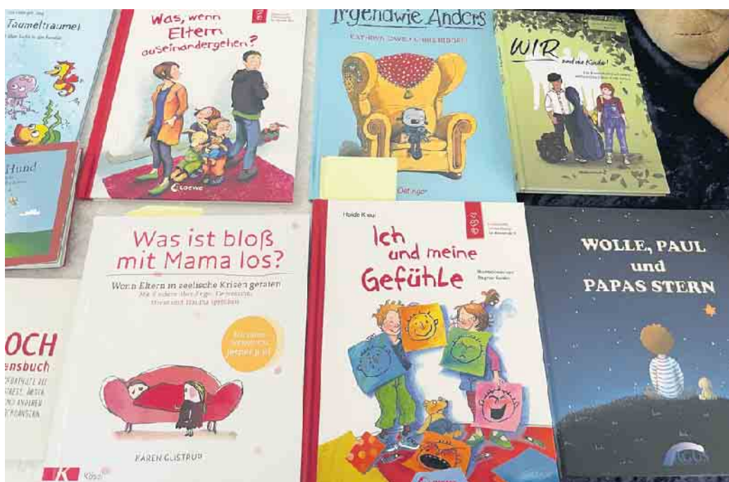
Auch Kinderbücher helfen dabei, mit Kindern von psychisch und suchterkrankten Eltern altersgerecht ins Gespräch zu kommen.

doppelt Sinn“, erklärte Teigelmeister: Zum einen stünden die Kinder vor ähnlichen Schwierigkeiten, zum anderen hätten die Eltern(-teile) häufig Doppeldiagnosen. In der Fachveranstaltung wurden mögliche Risikofaktoren diskutiert - etwa die Tabuisierung der Erkrankung als Familiengeheimnis, Folgen wie beispielsweise Isolierung, Schuld- und Schamgefühle, Ängste und Unsicherungen, oder auch die sog. Parentifizierung, wenn ältere Kinder für erkrankte Eltern einspringen und jüngere Geschwister versorgen müssen. Um möglichen Folgen wie Entwicklungsverzögerungen oder beispielsweise einer eigenen späteren Erkrankung vorzubeugen, gibt es verschiedene Hilfen für Kinder und Jugendliche. Das Team bietet Einzelgespräche und zwei „Fitkids“-Gruppen an: für Acht- bis Zwölfjährige sowie für bis zu 17-Jährige. Auch Eltern können Beratungsgespräche wahrnehmen. Ein weiteres Angebot für sie ist das Elterncafé, das das Team begleitet. Familien- und Freizeitangebote - teils allein für die Kinder und Jugendlichen, teils für die ganzen Familien gemeinsam - runden das Angebot ab. Web: https://www.diakonie-siegrhein.de/mobile-jugendhilfen