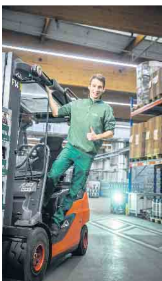
Der innerbetriebliche Transport erfolgt mit modernen Flurfördermitteln, die eingesetzten Gabelstapler können sechs Paletten gleichzeitig transportieren.

und Genauigkeit, Verantwortungs- und Gefahrenbewusstsein sowie eine hohe Einsatzbereitschaft. (DJD)