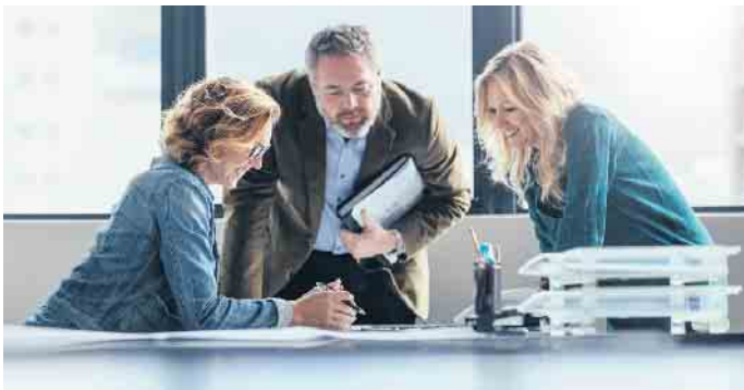
Einer Studie zufolge empfinden Mitarbeiterinnen und Mitarbeiter das Angebot einer betrieblichen Krankenversicherung als Wertschätzung durch den Arbeitgeber.