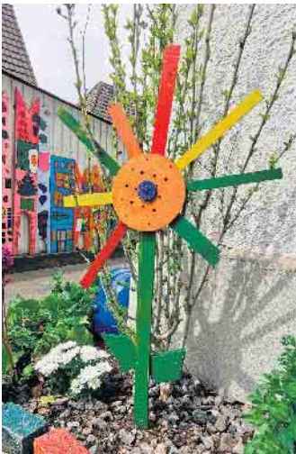
Passend zum Thema „Flower Power“ haben die Kinder auch selbst Blumen gebastelt.

In der Kita Robert-Müller-Platz ist ein neues Kunstprojekt gestartet: „Flower Power - blumige Zeiten im Kinderkunsthhaus“. Die Kinder lernen viele verschiedene Künstlerinnen und Künstler kennen und lassen sich in die Welt der Blumen entführen. Zum Auftakt des Kunstprojektes gab es einen großen Kinderkunsttag. Die Kinder bas-