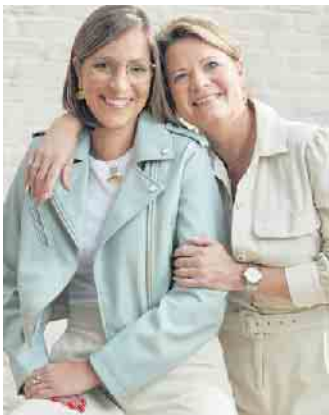
Als Schmuckstylistin sollte man gut mit Menschen umgehen können und Freude am Verkauf haben.

keit und einer guten Work-Life-Balance. Als Freiberufler oder Freiberuflerin hat man hohe Chancen, sich diese Wünsche er-füllen zu können - beispielsweise als Schmuckstylistin.