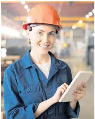
Mit einer vom Arbeitgeber finanzierten privaten Krankenversicherung können Unternehmen gut ausgebildete und motivierte junge Leute gewinnen und diese auch langfristig halten.

sich laut infas-quo-Studie viele Wahlmöglichkeiten zu einem angemessenen Preis und individuelle, auf das Unternehmen zugeschnittene Lösungen. Die Versicherungswirtschaft hat darauf reagiert und bietet passgenaue Lösungen an. (djd)