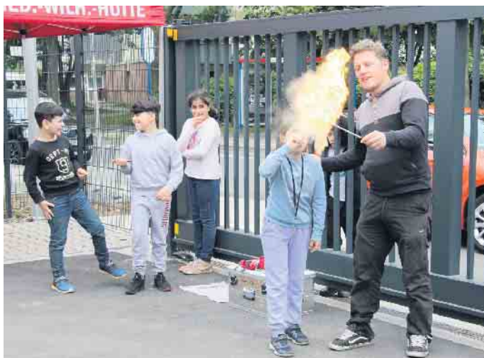
Kindervom Abenteuerspielplatz neben der Feuerwehr hatten sich eine besondere Begrüßung ausgedacht.

ell 22 Mitglieder der Löschgruppe ein modernes Gebäude beziehen konnten: „Unsere Stadt ist auf eine gut ausgebildete und bestens ausgerüstete Feuerwehr angewiesen.“ Zusatzfreude bereite ihm, dass Zeit- und Kostenplan für dieses Gebäude eingehalten wurden. Das neue Gebäude hat eine Fläche von 580 Quadratmetern und kostete 2,3 Mio. Euro. Die Löschgruppe FWH wurde 1989 gegründet und ist die jüngste Löschgruppe in Troisdorf. Ihr stehen jetzt ein Löschgruppenfahrzeug der Jugendfeuerwehr und ab kommandem Jahr ein Mannschaftstransportfahrzeug zur Verfügung. Die Feuerwehr auf der Hütte darf sich auf gute Nachbarschaft mit Aktiven vom Abenteuerspielplatz freuen: Kinder von dort hatten sich zur Eröffnung eingefunden zeigten, dass sie mit Feuer umgehen können.