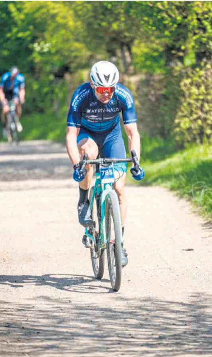
Sebastian Hoff.