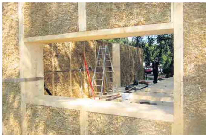
Natürliche Dämmstoffe schaffen ein gesundes Wohnklima

Denn sie schonen wertvolle Ressourcen, können gefahrlos entsorgt werden und sind recycelbar. (BHW)