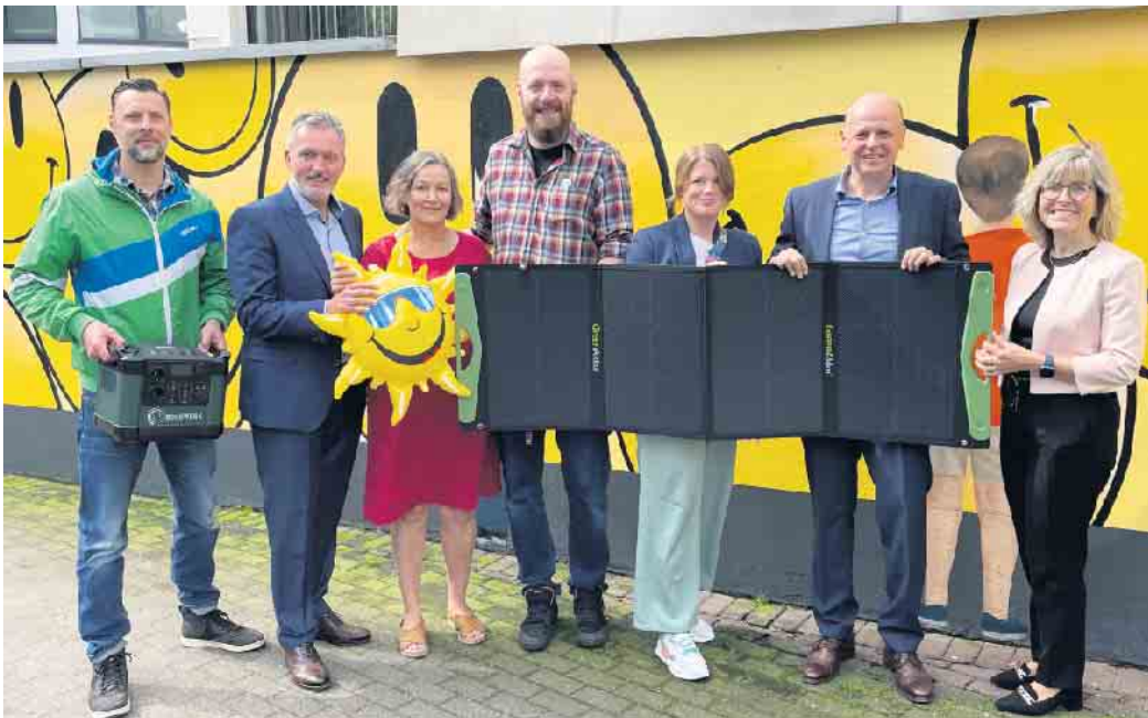
Vertreter der Sieger-Kitas mit den Veranstaltern bei der Gewinnübergabe.

Videos sollten mit jeweils einer mobilen Powerstation inklusive eines Solarpanels im Wert von 1.500 Euro sowie einer Spende über 200 Euro für den Kauf eines akkubetriebenen Spielzeugs belohnt werden. Bei der Beschaffung der Mini-Solaranlagen unterstützten die Stadtwerke Troisdorf. Außerdem konnte die VR-Bank Bonn Rhein-Sieg den Energieversorger gewinnen, Workshops zur Vermittlung von Grundwissen zum Thema Solarenergie in den Kitas abzuhalten. Ziel dieses Wettbewerbs ist, das Thema Nachhaltigkeit durch Nutzen von Sonnenenergie mittels Solarpanels den Kindern bereits im Vorschulalter näherzubringen und zu veranschaulichen, wie das mit den „Sonnenstahlen einfangen“ funktioniert. Insgesamt beteiligten sich 28 Kitas mit ihren Videos, die allesamt das Thema „Solarenergie“ liebevoll und kreativ umgesetzt haben. Als Bank ist uns dieses Thema sehr wichtig, da auch wir versuchen, Klimaschutz in unser Handeln zu