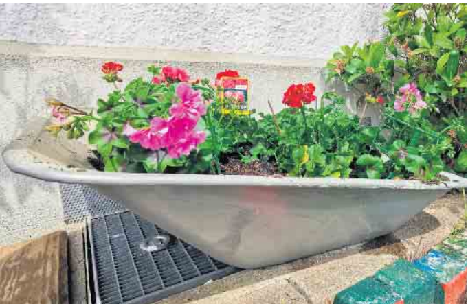
Die zahlreichen Blumen und Stauden wurden überall auf dem Kita-Gelände gepflanzt - auch in Töpfe oder Schubkarren.

karre wählen. Als erste Künstlerin lernten die Kinder im Rahmen des Kunstprojektes „Flower Power“ Frida Kahlo kennen, die in vielen ihrer Werke Blumen darstellte. Sie malte oft Blumen, um ihre mexikanische Identität und Kultur zu betonen. Eines ihrer bekanntesten Blumenbilder ist „Stillleben mit Sonnenblumen“ (1943). Der Verein der Freunde und För-