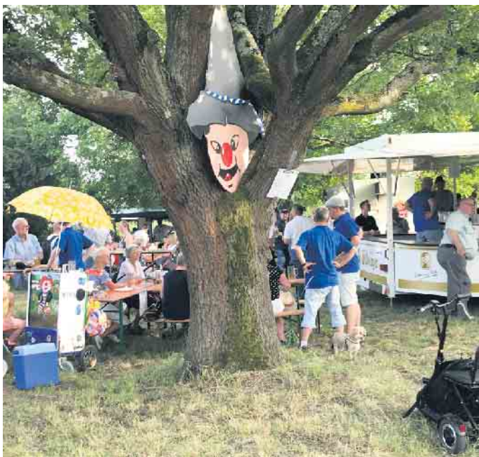
Es war so schön im letzten Jahr.

Natürlich kein Eintritt und was zu „süffele un müffele“ gibts es bei den Knallköpp natürlich auch - wir freuen uns auf Euch.