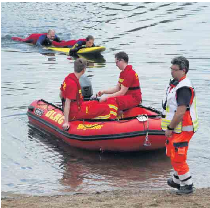
Mit modernen Hilfsmitteln sind die Rettungskräfte im Einsatz.

Zuschauern bei der Eröffnung der Wache, wie Rettungsschwimmer und mit welchen Hilfsmitteln wie besonders ausgestatteten Booten oder Rettungsbrettern vorgehen. Bleibt zu hoffen, dass die Freiwilligen als Retter immer schnell genug handeln können; hoffen sollte man aber auch, dass die Badenden sich nicht durch Leichtsinns in Gefahr bringen.