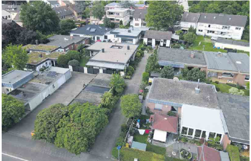
Die Thomas-Mann-Straße in Sieglar aus Richtung Rathausstraße- eine typische Flachdachsiedlung.

Jahreszeitlich bedingt, sei er wie folgt zitiert: „Frühling lässt sein blaues Band / wieder flattern durch die Lüfte; / süße, wohlbekannte Düfte / streifen ahnungsvoll das Land. / Veilchen träumen schon, / wollen balde kommen. / - Horch, von fern ein leiser Harfenton! / Frühling, ja du bist's! / Dich hab' ich vernommen“!