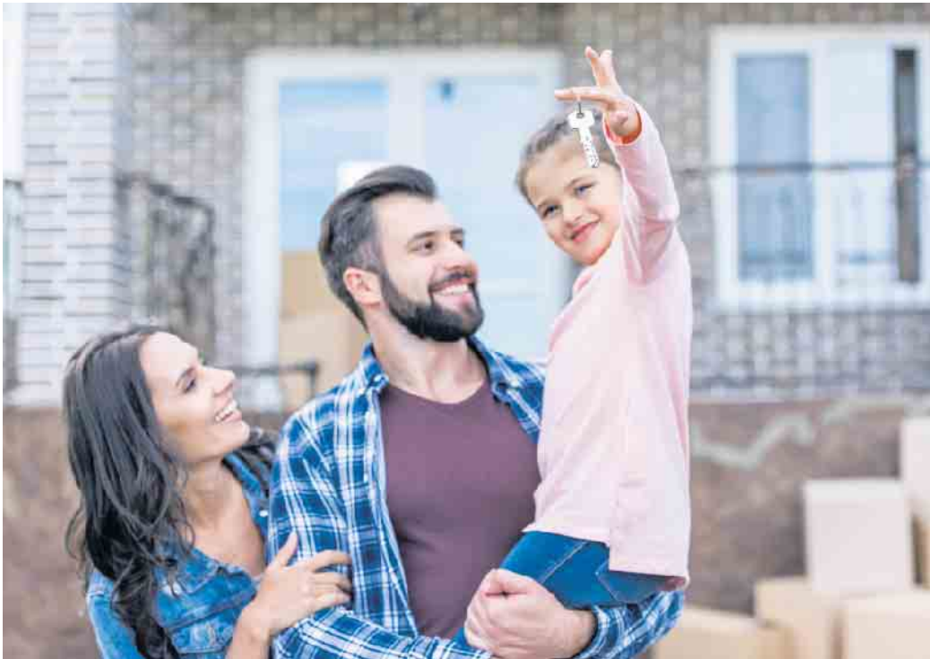
Bis sie die Schlüssel endlich in der Hand halten, müssen Hausbesitzer in spe einiges beachten.