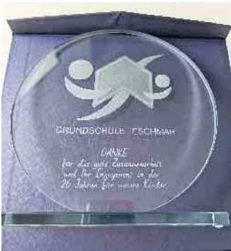
Schulaward der Grundschule Eschmar

Grundschule Eschmar feiert rauschendes Schulfest und 26 Jahre Ehrenamt