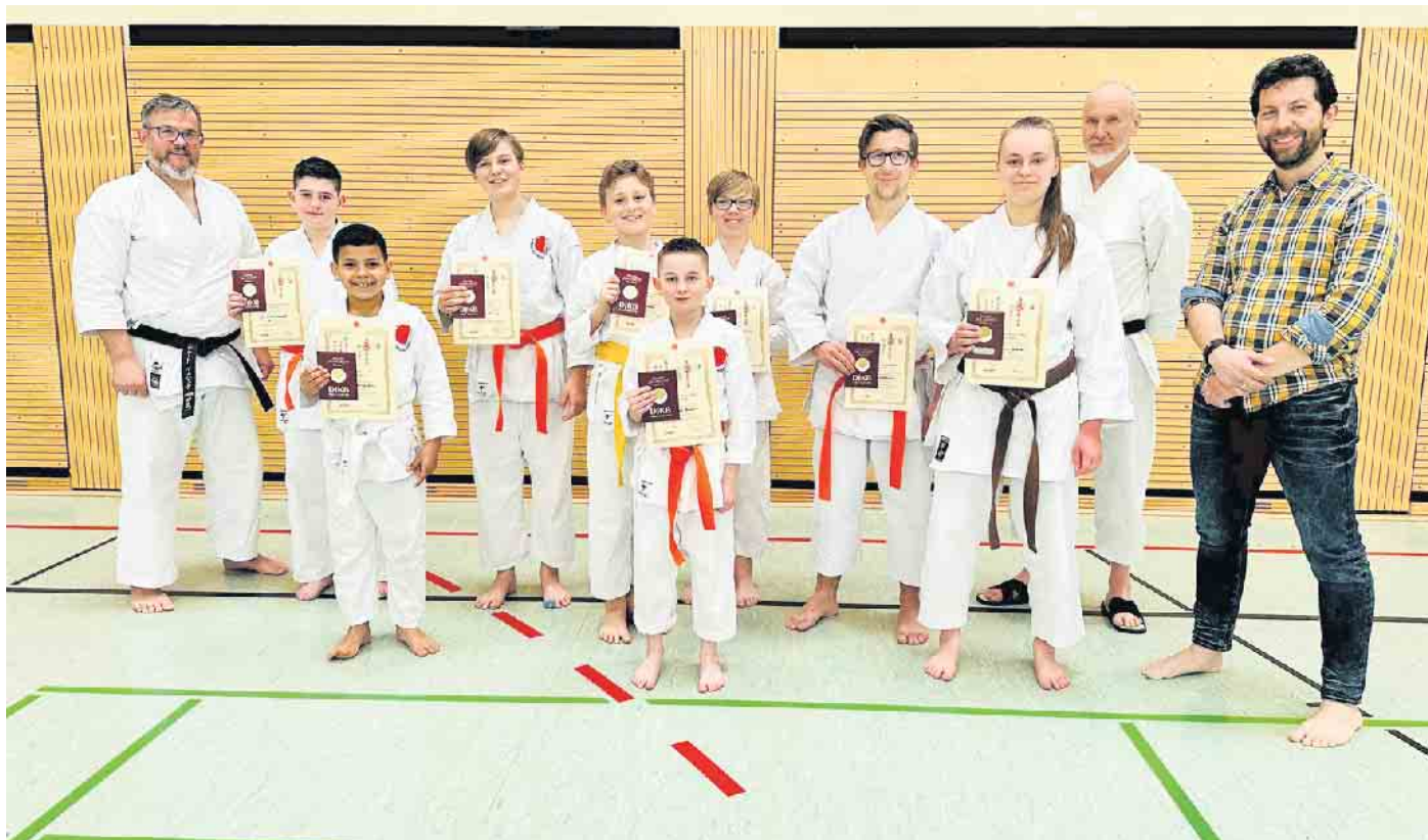
Prüflinge nach der Prüfung

Wir gratulieren ganz herzlich allen Prüflingen zu ihren neuen Kyu-Graden und den guten Leistungen, die sie gezeigt haben. Wir sind sehr stolz auf Euch!