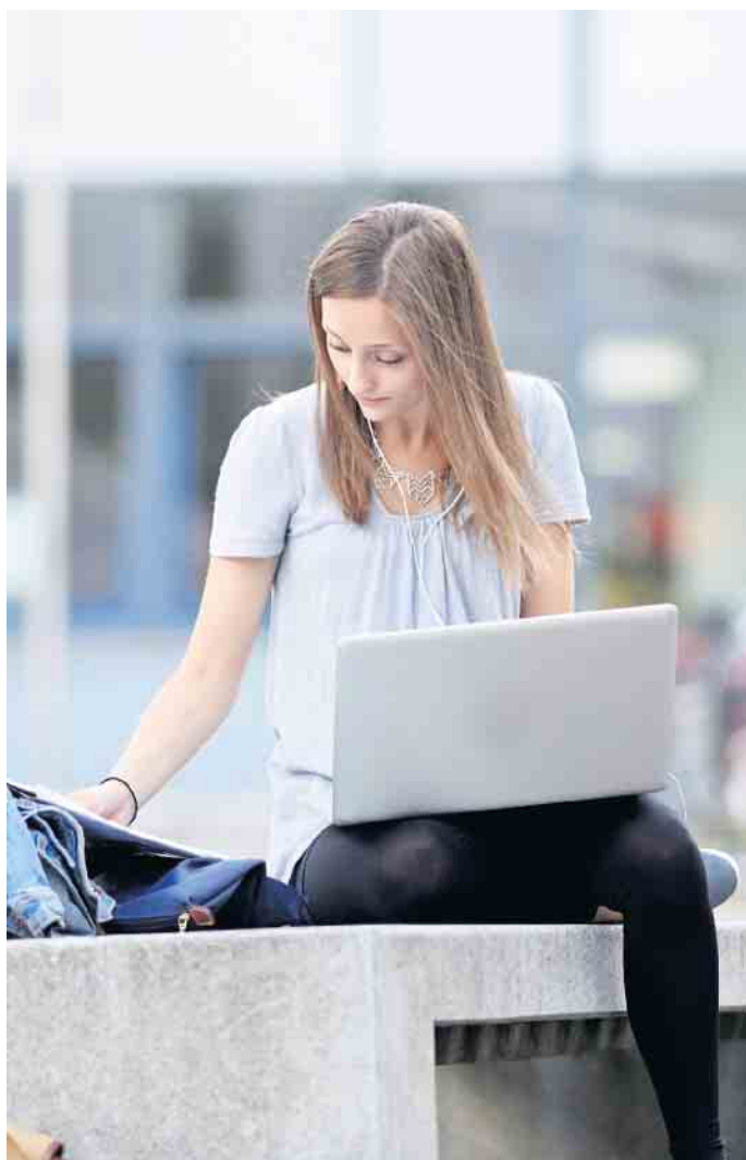
Beim Blended-Learning-Konzept sind die Teilnehmer zeitlich und örtlich relativ unabhängig.

Schichtdienst auch von zu Hause aus lernen wollen. In Koblenz werden Selbstlernphasen mit intensiver Betreuung durch Tutoren und Tutorinnen mit einigen Präsenzveranstaltungen ergänzt. Unter www.ihk-akademie-fernstudium.de findet man Informationen zu den genauen Inhalten. Der anerkannte Abschluss „Geprüfter Fachwirt im Gesundheits- und Sozialwesen“ ist im Deutschen Qualifikationsrahmen auf Niveau 6 eingeordnet, also auf dem gleichen Niveau wie die Bachelorabschlüsse der Hochschulen. Unter bestimmten Umständen können Teilnehmende Aufstiegs-BAföG beantragen, was die Finanzierung dieses Lehrgangs erleichtert. Die Förderung besteht aus einem Zuschuss und einem zinsverbilligten Darlehen und ist für berufsbegleitende Weiterbildungsangebote einkommens- und vermögensunabhängig. (djd)