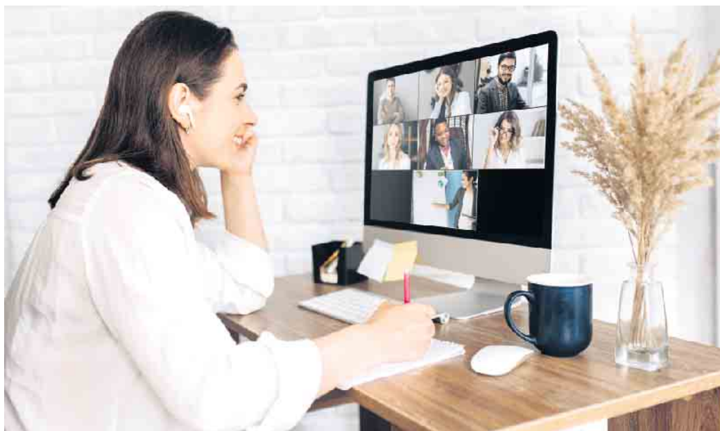
Von zu Hause aus, aber trotzdem mit einer Gruppe lernen: Das ist möglich auf einem Online-Campus.

Das entsprechende Fachwissen kann in einem Vorbereitungslehrgang erworben werden und einen solchen gibt es auch als reine Online-Variante.