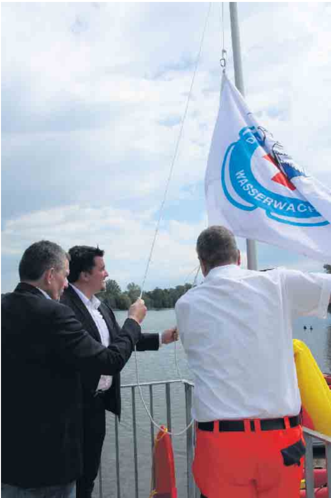
Mit dem Flaggenhissen ist die Station jetzt offiziell eröffnet.