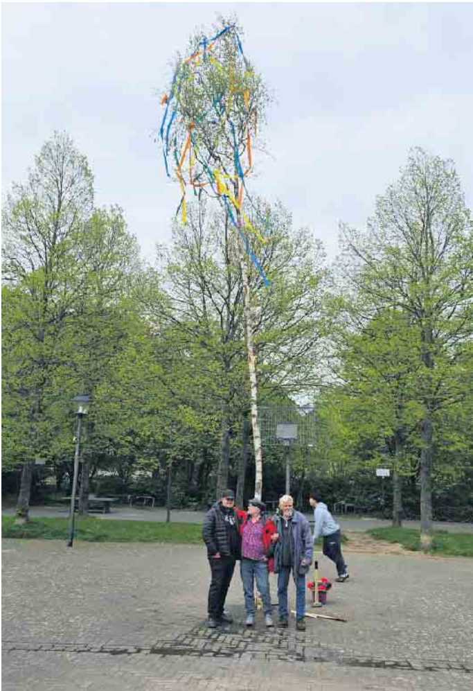
Einsam auf dem Europaplatz, der Maibaum, der noch einen „neuen Besitzer“ sucht.

Denn dieser schöne Brauch wird in anderen Stadtteilen von den jeweiligen Junggesellenvereinen hochgehalten. Auch wenn sich das Aufstellen des Baumes dieses Jahr schwierig gestaltete, so verspricht Lohr den Bürger vom Stadtteil Rotter See, auch im nächsten Jahr diese schöne Tradition fortzuführen. Wer Interesse an dem Baum hat, der kann sich nach dem 31. Mai bei Lohr unter Telefon 02241/402092 melden. Der Baum wird kostenlos abgegeben. Er muss nur am Europaplatz abgemacht und abgeholt werden.