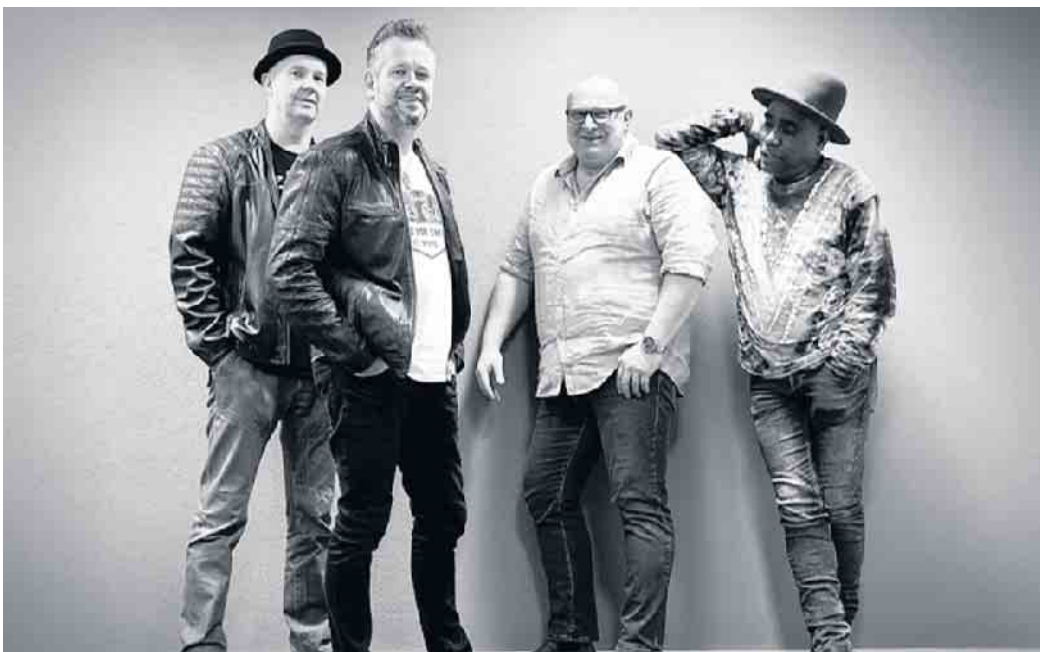
Veldman Vintage Project

Laufe des Abends kreist jedoch der Hut - wie in den Chicagoer Bluesclubs üblich. Den Inhalt erhält ausschließlich die Gastband.