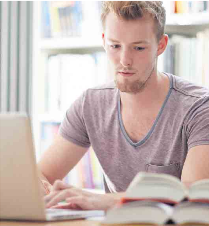
Für eine berufliche Weiterbildung muss man nicht unbedingt Präsenztermine wahrnehmen. Die Ausbildung für Ausbilder beispielsweise erfolgt online.

die IHK-Akademie Koblenz ein zeitunabhängiges Kursformat entwickelt.