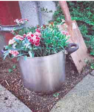
Die zahlreichen Blumen und Stauden wurden überall auf dem Kita-Gelände gepflanzt - auch in Töpfe oder Schubkarren.

telten kunstvolle Blumen, wie große bunte Sonnenblumen aus Holz, und pflanzten selbst viele Blumen auf dem Kita-Gelände. Dabei durften sie auch kreative Pflanzorte wie Kochtöpfe oder eine Schub-