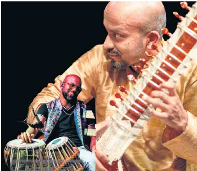
RAGASUTRA spielen klassische indische Musik.