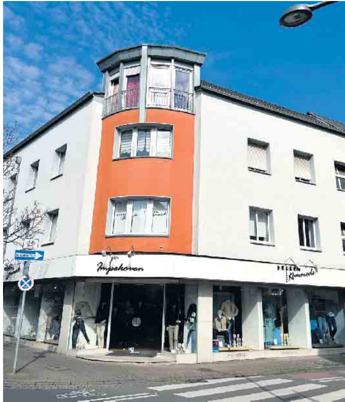
Herren Kommode Impekoven an der Kölner Straße 99.

Herren Kommode Impekoven führt vor allem sogenannte Baukastenanzüge des Herstellers Digel; Sakko und Hose können dabei in unterschiedlichen Größen gewählt werden - ganz nach persönlichen Erfordernissen „Fast wie Maß“. Ob für Hochzeit, Berufsleben oder Alltag - wer hochwertige Herrenmode sucht, bekommt sie hier. Fachliche Beratung ist Inhaber Andre Impekoven wichtig. Neben sogenannten Normalgrößen 48-56 führt das Geschäft auch Zwischengrößen von 25 und 28.