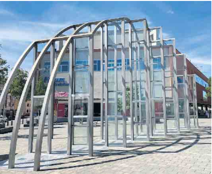
Das Troisdorfer Stadttor.