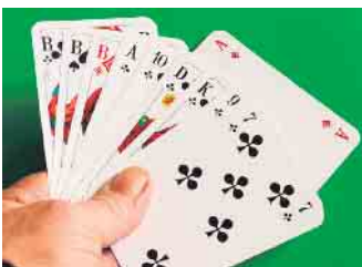
Preisskat für den guten Zweck

Nachdem der letzte „Preisskat für den guten Zweck“ ein voller Erfolg gewesen ist, hoffen die Freunde aus Spich, dass wir wieder viele Skatfreunde begrüßen dürfen. Wann: Am 18. April Wo: Cafe & Cocktailbar SANTANA in Troisdorf-Spich Beginn: 11 Uhr Startgeld: 10 Euro