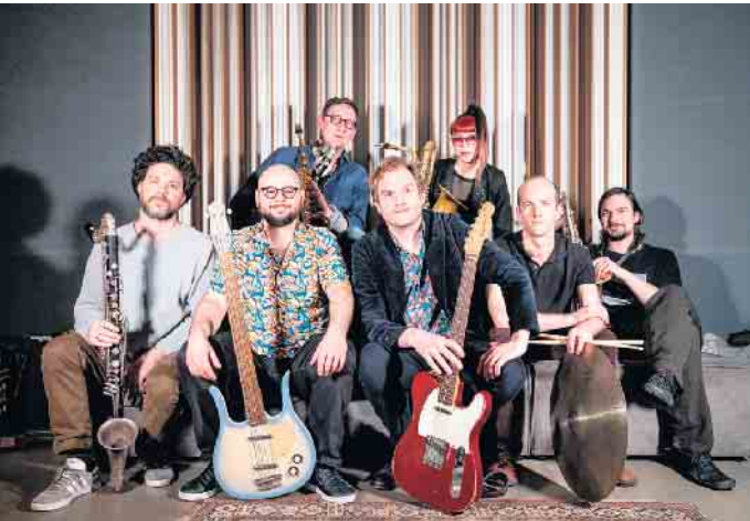
Die Band KUHN FU spielt im Kunsthaus.

Kontakt: Kunsthaus Troisdorf Mülheimer Straße 23 53840 Troisdorf