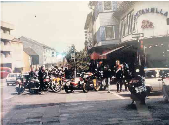
Schon in den 1970er- und 1980er-Jahren kehrten viele Motorradfahrer nach ihren Touren regelmäßig in die Eisdiele ein.