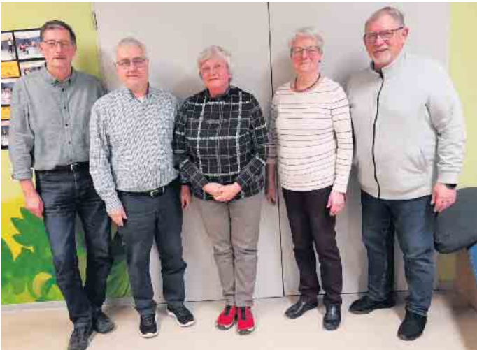
Der neue Vorstand des Mandolinen-Vereins Sieglar.

vor Herausforderungen steht. Dennoch blickt der Mandolinenverein positiv gestimmt in die kommende Zeit.