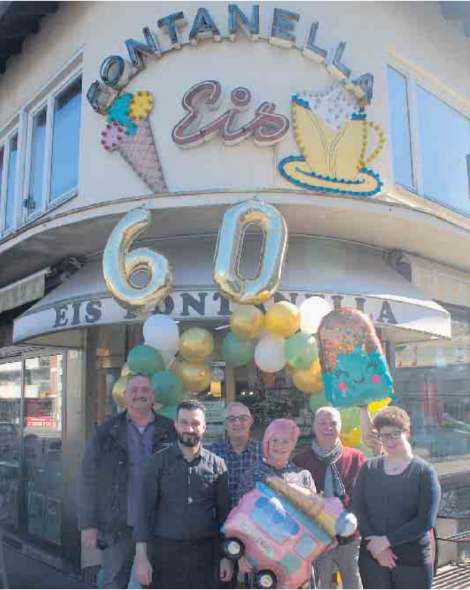
Seit 60 Jahren ist die Eisdiele Fontanella an der Frankfurter Straße 9 ein fester Bestandteil des Troisdorfer Stadtlebens.

Eisdiele Fontanella an der Frankfurter Straße feiert Jubiläum