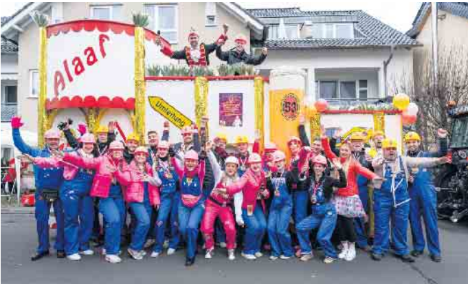
Die Jecken Fründe 53 aus Kriegsdorf.

Auch in diesem Jahr laden die „Jecken Fründe 53“ zu ihrem Frühjahrsfest „Frühjahrsputz“ ein. Die Veranstaltung findet am Samstag, 5. April, auf dem Rosenhügel in Kriegsdorf statt und bietet ein abwechslungsreiches Programm für die ganze Familie.