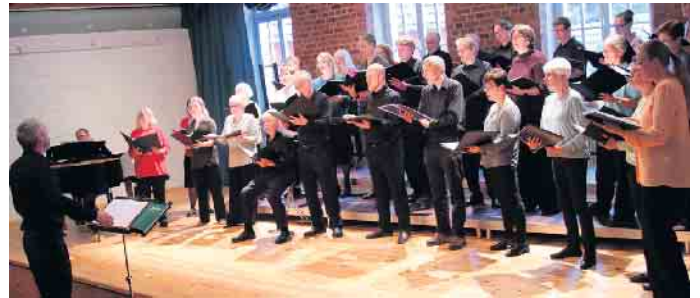
Konzertchor Rhein-Sieg.