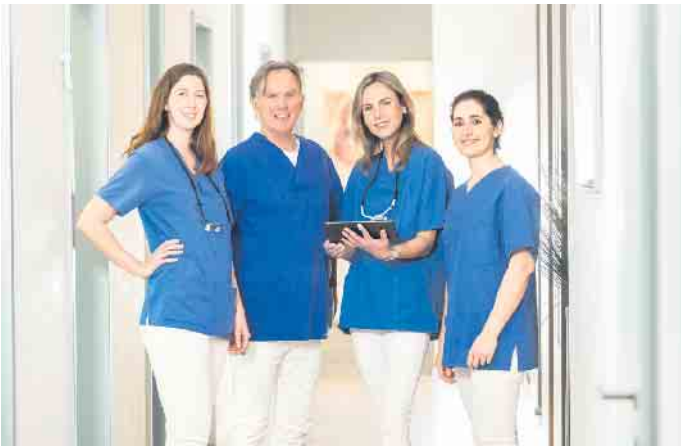
Das Team der dental suite im Kölner Rheinauhafen

Ein neuartiges Konzept (All-on-4®) macht es möglich: Feste dritte Zähne an nur einem Tag! In der dental suite im Rheinauhafen ist dieses Konzept bereits seit Jahren tägliche Routine. Es wurde speziell für Patienten entwickelt, die von vollständigem oder fast vollständigem Zahnverlust betroffen sind. Das Besondere: Lediglich vier Implantate müssen für einen vollständigen Zahnersatz pro Kiefer (Ober- oder Unterkiefer) eingebracht werden - zwei im vorderen Bereich des Kiefers und zwei weitere im hinteren Bereich. Im Anschluss wird ein Zahnbogen darauf befestigt, durch den der Patient einen fest-sitzenden und sofort vollständig belastbaren Zahnersatz erhält - in nur einer Behandlungssitzung. Vorteile gegenüber Prothesen Herausnehmbarer Zahnersatz stört nicht selten beim Sprechen und auch die Angst vor dem Versagen der Haftcreme bleibt immer im Hinterkopf präsent. All-on-4® Zahnersatz ist hingegen fest im Kiefer verankert.