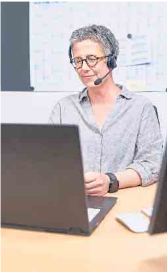
Schon am ersten Tag sollte ein fertig eingerichteter Arbeitsplatz zur Verfügung stehen.