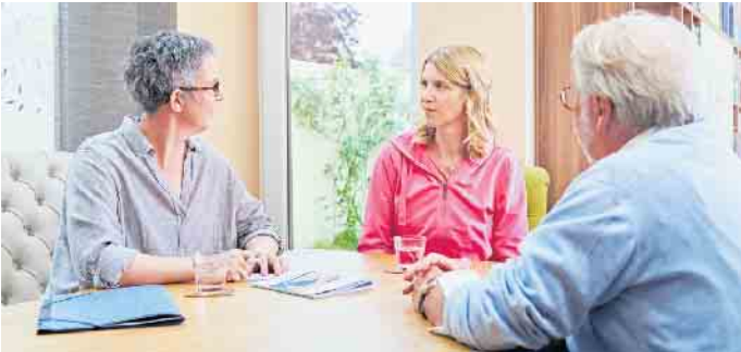
Hilfreich ist es, wenn ein fester Ansprechpartner oder eine Mentorin die ersten Schritte im neuen Job begleitet.