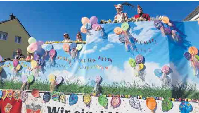
Der prächtig geschmückte Prinzenwagen strahlt genauso wie die Tollitäten.

Blickte man im November noch einer langen Session entgegen, so stellen wir heute fest, dass die Wochen und Monate wie im Flug vergingen. Diese wunderbare, herrliche, fabelhafte, bunte und fröhliche Zeit wird unseren Tollitäten und ihrem Gefolge ewig in Erinnerung bleiben. Eure Burggarde Spich e. V.