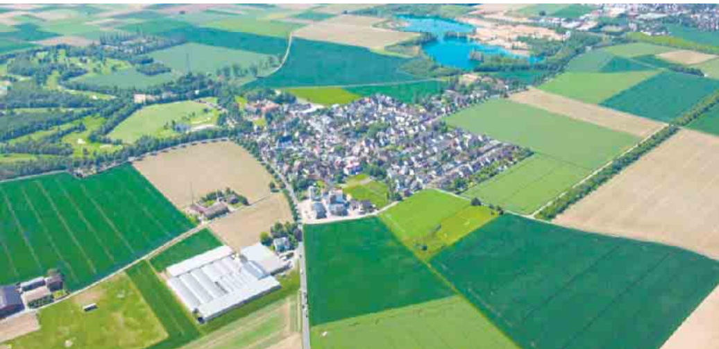
Blick von oben auf den Raum des METRO-KLIMA-LABs (PRFC Paul Caruso)

ren. Auf der Abschlussveranstaltung wurde das Konzept öffentlich vorgestellt und die nächsten Schritte mit den anwesenden Expert*innen aus verschiedenen Fachverwaltungen und zahlreichen politischen Vertreter*innen aus den kommunalen Räten diskutiert. Sie betonten, dass die Herausforderungen des Klimawandels nur durch Zusammenarbeit über kommunale Grenzen hinweg gemeistert werden können. Das Konzept wurde als konkreter und vielversprechender Plan angesehen, der mit bestehenden Konzepten der beteiligten Kommunen kompatibel ist und eine vielversprechende Grundlage für die Umsetzung bietet.