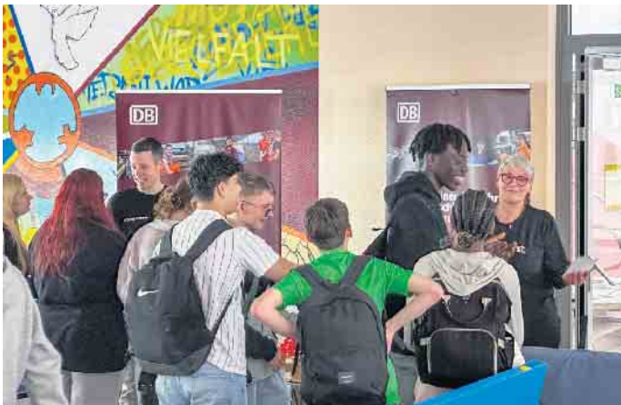
Das Interesse der Schüler*innen an den Ausbildungsangeboten war groß

Im kommenden Schuljahr startet das Programm mit 27 neuen Teilnehmenden. Anschlussmaßnahmen wie „AsA flex“ oder „Digital+“ begleiten die Jugendlichen über das Schuljahr hinaus und eröffnen langfristige Perspektiven. Das Meet & Greet in Troisdorf hat erneut gezeigt, wie wichtig die Zusammenarbeit von Schulen, Unternehmen und Stadtverwaltung ist. Die Jugendlichen sammelten wertvolle Erfahrungen und erhielten konkrete Ausbildungs- und Praktikumsangebote. Die Stadt Troisdorf wird dieses Projekt weiter fördern, um jungen Menschen den bestmöglichen Start ins Berufsleben zu ermöglichen.