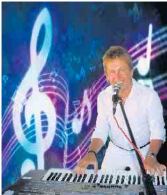
Mister Musik wird für die Gäste aufspielen.