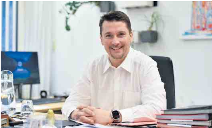
Bürgermeister Alexander Biber

Troisdorfer Bürger*innen wenden sich an das Büro des Bürgermeisters, um sich Rat und Hilfe zu holen oder um Anregungen und Beschwerden vorzutragen. Die in der Regel jeden Mittwoch stattfindenden Sprechstunden bieten hierzu Gelegenheit. Die nächsten Sprechstunden von Bürgermeister Alexander Biber finden am Mittwoch, den 26.03.2025 zwischen 15:30 Uhr und 17.00 Uhr im Rathaus, Raum E69, Kölner Straße 176, 53840 Troisdorf, statt. Zu allen Terminen wird um Voranmeldung unter der Rufnummer 02241 / 900-113 gebeten.