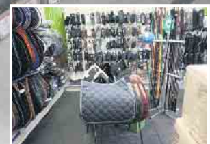
Abb. sind Beispiele! Produkte in Ausstellungen und Lager können abweichen!

KLEIN BAUSTOFFE Baumarkt Brennstoffe FUTTERMARKT