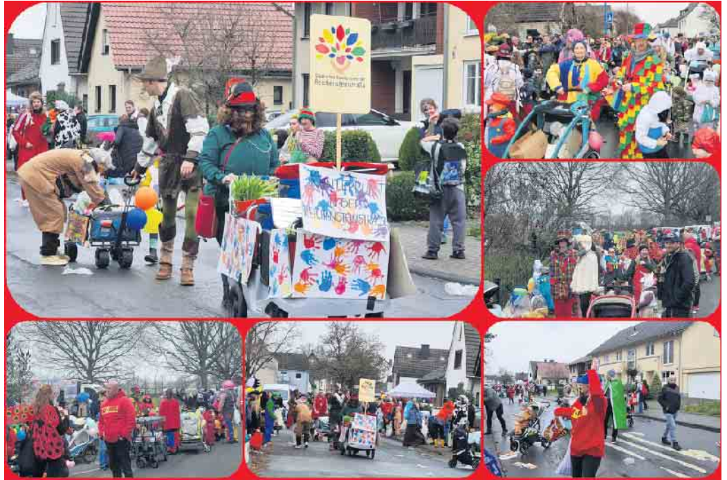
Fast 90 Kinder, Eltern und Erzieherinnen waren unter dem Motto „Kunterbunt geht’s rund“ Teil des Kriegsdorfer Karnevalszugs.