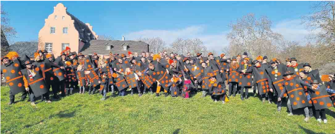
Dominospiel bei den Kolpings