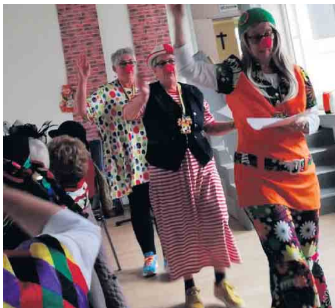
Clowns der kfd-Spich

Auch die Troisdorfer Tafel kann sich freuen über eine Spende der Besucherinnen.