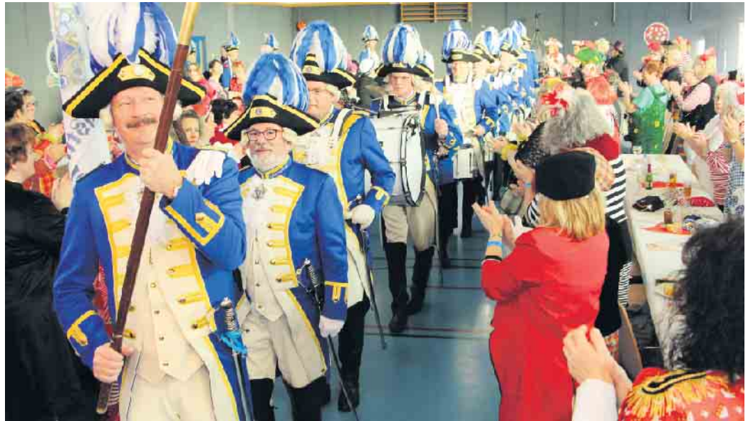
Einmarsch der Geistergarde in die Mehrzweckhalle.