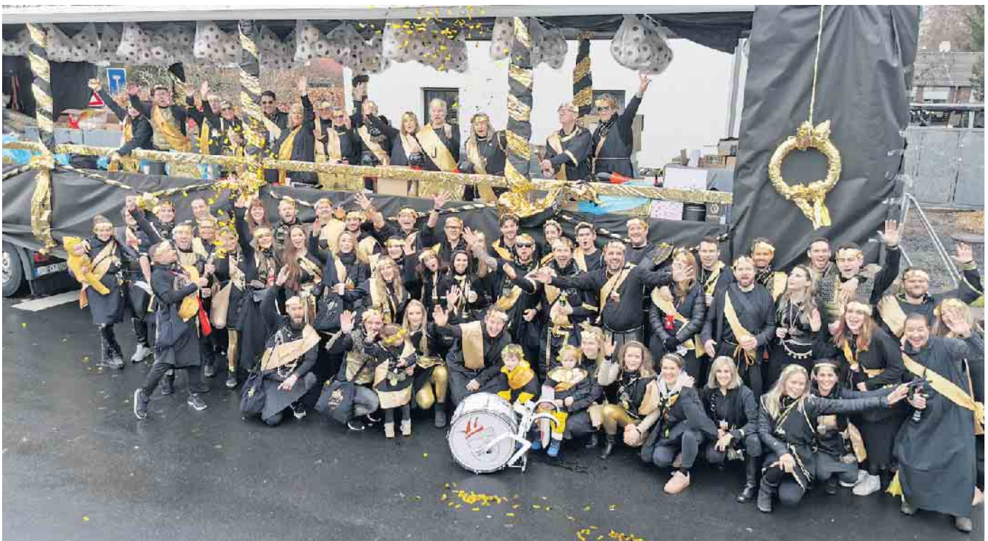
Gruppenbild TROlaner 2023