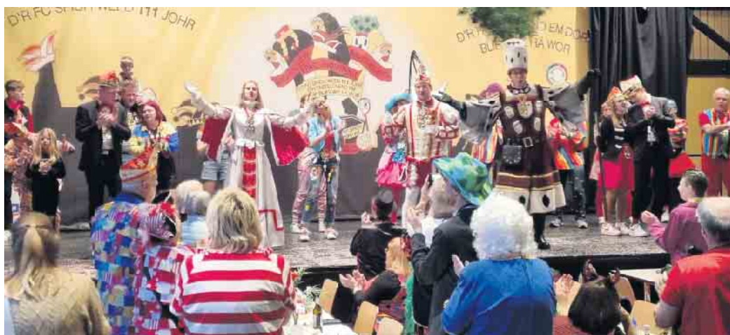
Voller Elan - das Junge Dreigestirn von Troisdorf