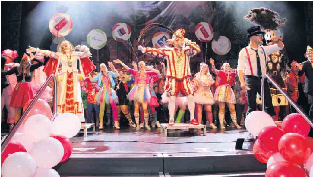
Das Troisdorfer Dreigestirn von den Sandhasen Oberlar mit Gefolge eroberten die Bühne ohne Probleme.