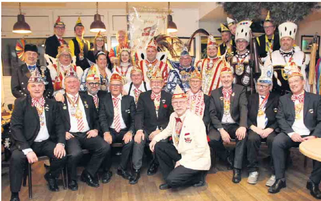
Tollitäten der Session 2022/23 mit den Mitgliedern des Prinzenstammtisches.