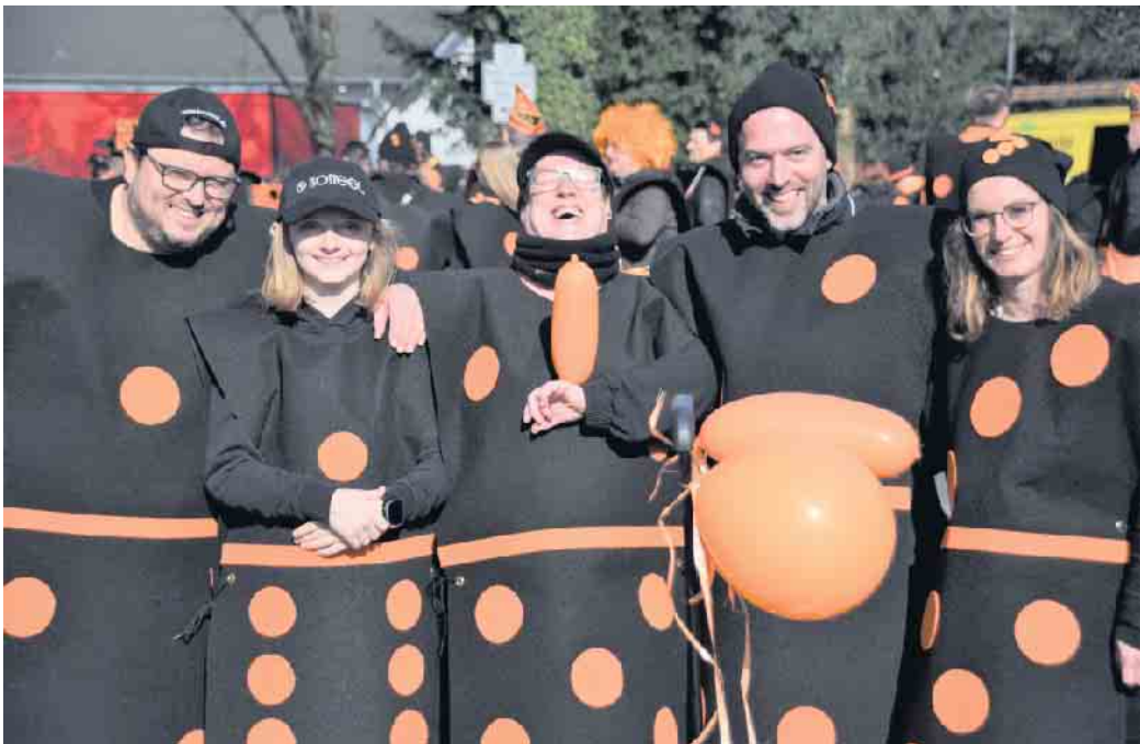
Mir fiere Fastelovend