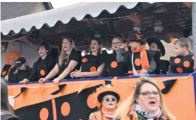
Die Kolpingjugend rockt

Nach dem Zug feierten die Familien mit kleinen Kindern noch lange im Pfarrsaal, während es die Jugend ins Bürgerhaus zog. Ausdauer haben die Kolpings und alle anderen Spicher, das steht fest! Ein herzliches Dankeschön an alle, die dazu beigetragen haben, dass dieser Rosenmontagszug so toll gelungen ist!