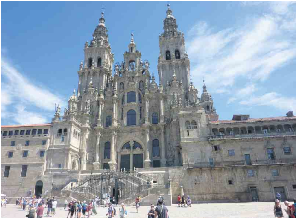
Santiago de Compostela

Gäste sind herzlich willkommen! Der Eintritt ist frei! Eine Anmeldung ist nicht erforderlich!