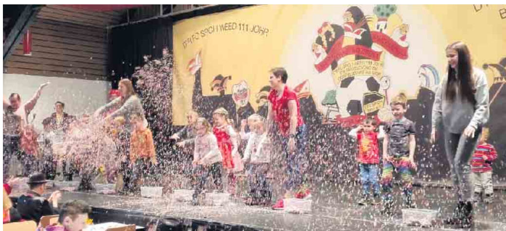
AWO Spich: Alt und Jung - gemeinsam feiern

Eine Augenweide und ebenfalls mit der AWO verbunden ist auch die Kindertanzgarde „ Dancing Diamonds “ aus Niederkassel, aus der sich mittlerweile auch