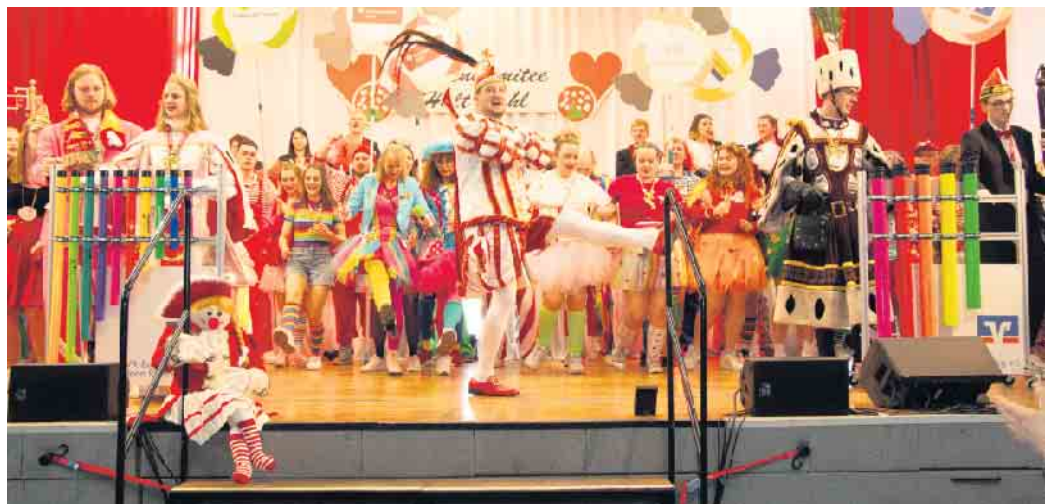
Das Troisdorfer Dreigestirn mit Gefolge enterte die Bühne und den Saal im Handumdrehen.