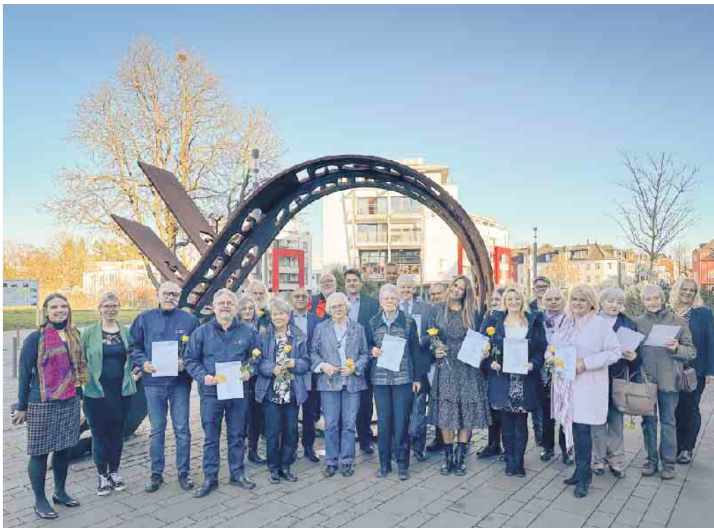
Insgesamt 27 Ehrenamtler und Ehrenamtlerinnen wurden geehrt.

Auf der Seite www.troisdorf.de/ehrenamt finden Sie weitere In-