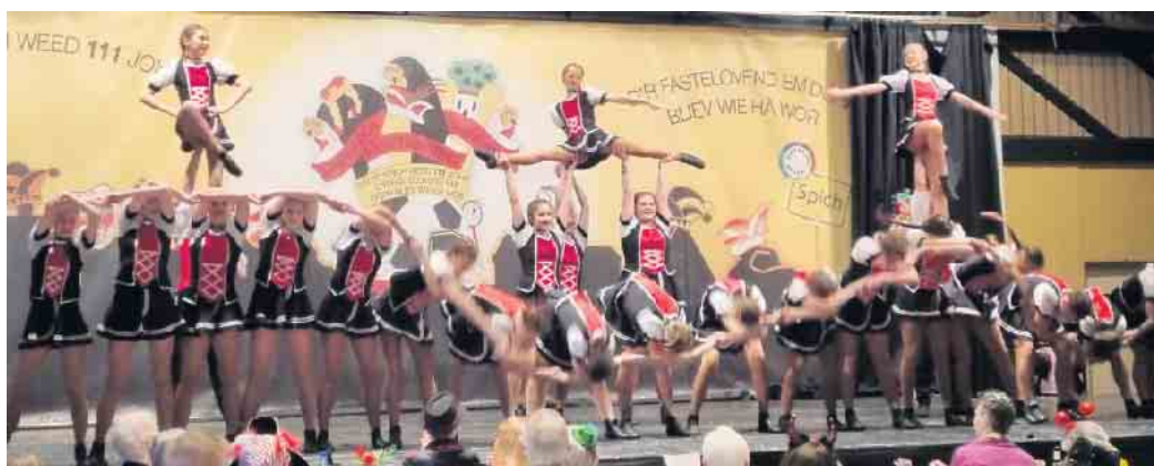
Immer bei der AWO dabei: Die Oberlarer Sandhasen im Jubiläumsjahr

eine sehenswerte Juniorentanzgruppe gebildet hat.