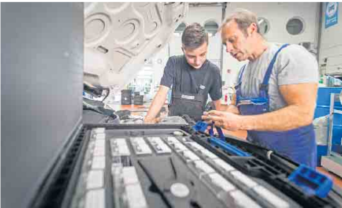
Die Lehre als Kfz-Mechatroniker gehört zu den beliebtesten handwerklichen Ausbildungen.

wie der Berufsalltag aussieht. Auch über Weiterbildungsmöglichkeiten und Perspektiven nach der Ausbildung erfährt man im Praktikum mehr. So kann man sich zum Beispiel auf Kfz-Servicetechnik oder als Automobil-Serviceberater spezialisieren oder einen betriebswirtschaftlichen Abschluss an der Bundesfachschule im Kfz-Gewerbe (BFC) anstreben. Durch die Einordnung der Abschlüsse in den einheitlichen Deutschen Qualifikationsrahmen (DQR) ist zudem die Gleichwertigkeit zu akademischen Qualifikationen gegeben und die Wertigkeit der Aus- und Weiterbildungen europaweit angeglichen. (DJD)