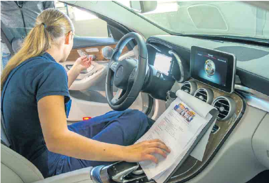
Berufe im Kfz-Gewerbe sind längst keine Männerdomäne mehr - die Ausbildungszahlen weiblicher Azubis steigen an.

Wer sich für eine Tätigkeit in der Mobilitätsbranche interessiert, kann sich zunächst über ein Praktikum orientieren und genauer herausfinden, welchen Karriereweg er einschlagen möchte. Über den #wasmitautos-Betriebsfinder können junge Menschen gezielt nach Praktikumsangeboten suchen, viele weitere Infos gibt es auch online unter www.wasmitautos.com . Beim Hineinschnuppern in die Betriebspraxis können Einsteiger erste wichtige Eindrücke sammeln, welche Ausbildungsinhalte vermittelt werden und