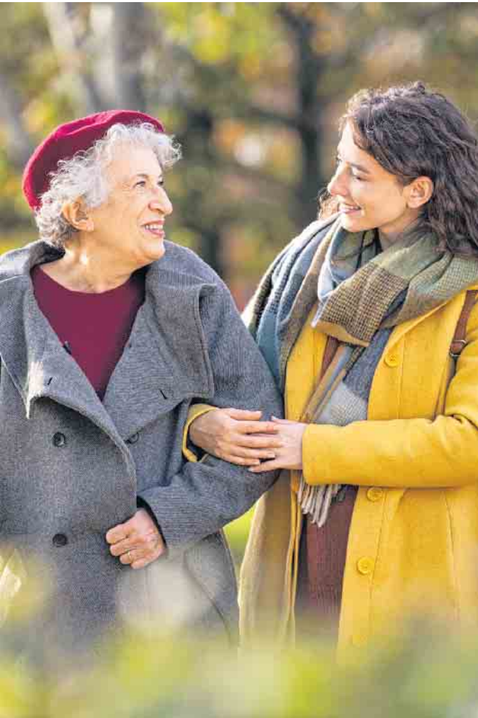
Ein Erinnerungsdiamant aus Asche oder Haaren ist eine noch recht ungewöhnliche Option des Gedenkens an den verstorbenen Ehemann und Vater.

zwanzig Jahren waren es noch 37 Prozent. Deutlich mehr Menschen wünschen sich etwa eine Baumbestattung in einem Bestattungswald oder eine pflegefreie Bestattungsform auf einem Friedhof wie eine sogenannte Urnenwand. Überraschend: Etwa ein Fünftel der Befragten wünscht sich eine Bestattungsvariante, die nach geltendem Recht kaum umzusetzen ist, nämlich die Verstreuung der Asche in der freien Natur oder die Aufbewahrung beziehungsweise Beisetzung der Asche zu