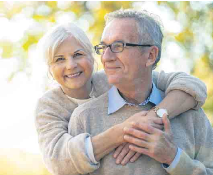
Das klassische Erdgrab auf dem Friedhof wird nur noch von wenigen gewünscht, viele Menschen bevorzugen stattdessen individuelle Bestattungsformen.

Für die Produktion eines oder mehrerer Erinnerungsdiamanten werden nur fünf bis zehn Gramm Haar benötigt. In einem ersten Schritt wird Kohlenstoff isoliert, gereinigt und aufgearbeitet. Im Anschluss wächst dieser unter hohem Druck und hoher Temperatur zu einem Erinnerungsdiamanten heran. Ein Rohdiamant kann auf Wunsch mit einer Lasergravur versehen werden. (DJD)