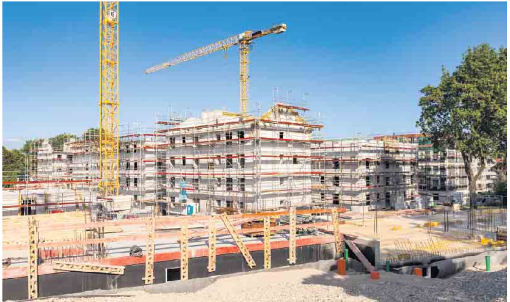
Beim Erwerb von Wohneigentum über einen Bauträger ist der Kunde kein Bauherr, sondern Käufer. Das kann Vor- und Nachteile mit sich bringen.

Professionelle Unterstützung und umfassende Garantien eines erfahrenen und seriösen Bauträgers für das Bauvorhaben können Sicherheit und Ruhe geben.