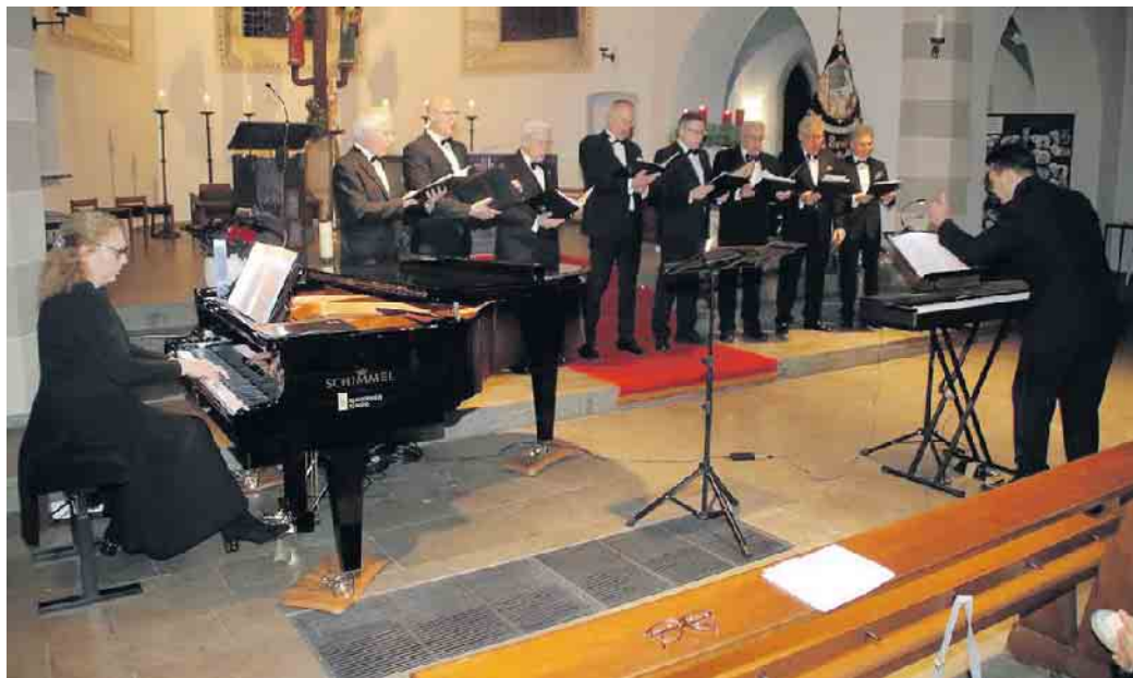
Weihnachtskonzert 2024 Ensemble MGV-Spich

Es sind nicht nur die Arrangements des Spicher Chorleiters, die die MGV Konzerte zum Erlebnis werden lassen, es ist auch Telegins prachtvolle Baritonstimme. Sie erstrahlt im Kirchenraum gleich zur Eröffnung, als er mit seinem Ensemble zu Joseph Schnabels „Transeamus usque Bethlehem“ Einzug hält. Ein Moment der Begeisterung berührt das Publikum und erfüllt das Gotteshaus mit festlichem Glanz.