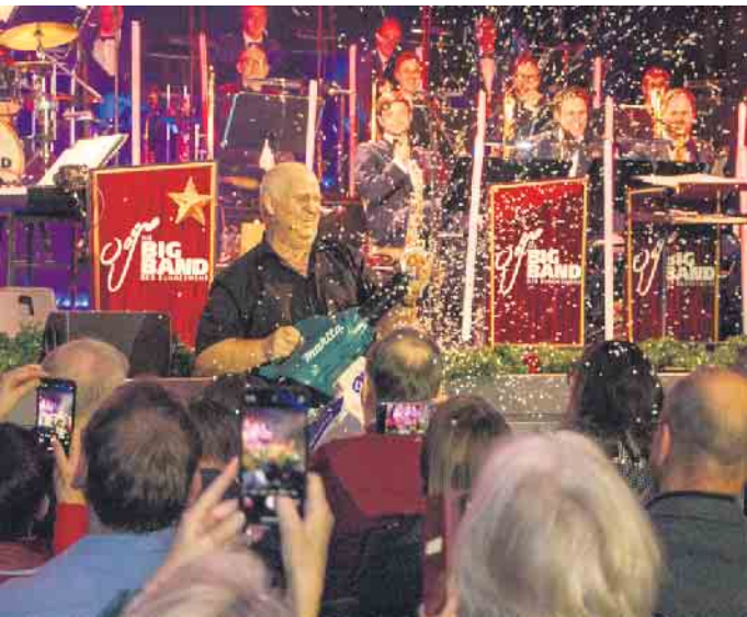
Die Big Band der Bundeswehr und Markus Maria Profitlich sorgten für wechselweise amüsante und festliche Stimmung.