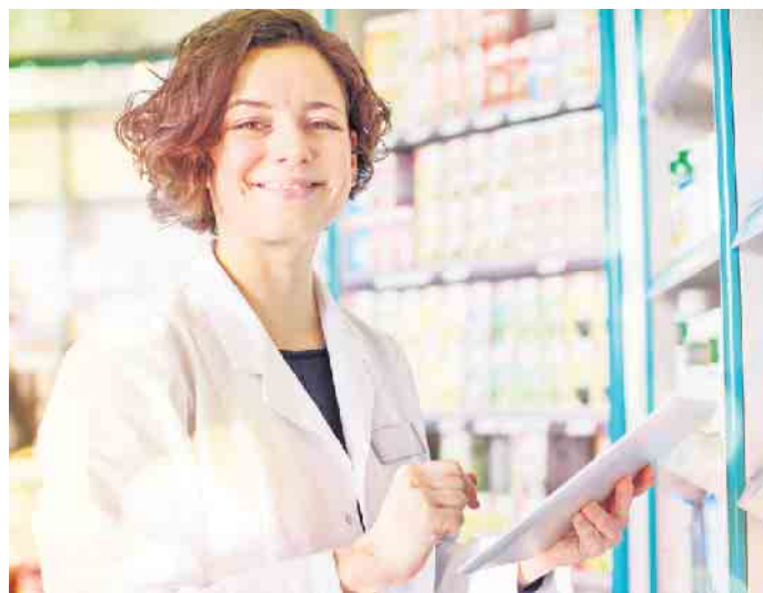
Warenkontrolle, Beratung, Bestellannahme - die Aufgaben sind vielfältig und verantwortungsvoll.

Insgesamt ist es die Teamarbeit und der Umgang mit den Kunden, was den Job vor Ort reizvoller mache als solche in der Industrie oder Behörde. Unter jobfinder.linda.de beispielsweise gibt es ein hilfreiches Portal, auf dem sich deutschlandweit Linda Apotheken präsentieren, die Bedarf an Personal haben. Jobsuchende können nach ihren Präferenzen (Art des Jobs und Ort) filtern und sich auch di-