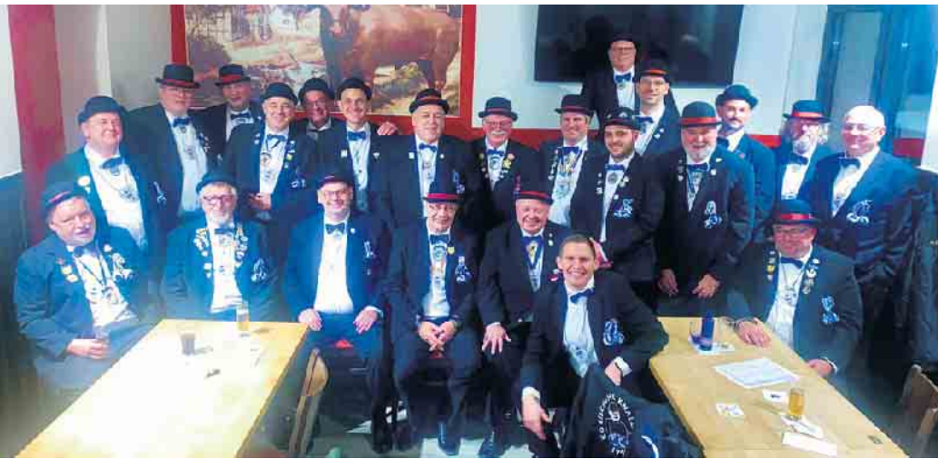
„Zom Lööre Oohs“ - Knallköpp sagen jeck Danke!