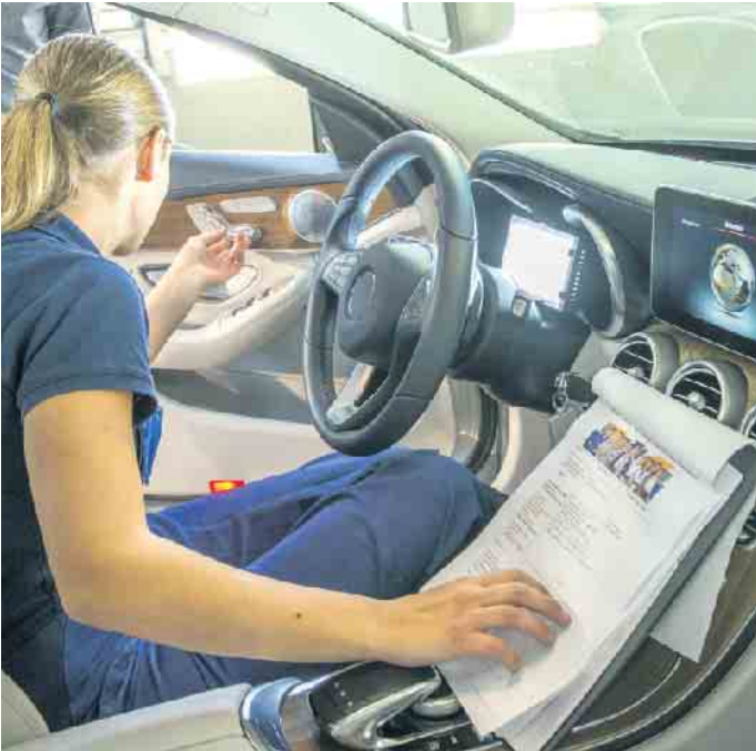
Ausbildungsberufe in der Kraftfahrzeugbranche bieten jungen Menschen gute Entwicklungschancen und zukunftssichere Arbeitsplätze.

betrieblicher Ausbildung und Berufsschule. Unter www.wasmitautos.de gibt es eine Vielzahl von Informationen zu den Berufsbildern und ihren Anforderungen sowie einen Betriebsfinder zur Suche nach Ausbildungsplätzen. Auch die Karrierechancen durch Spezialisierungen und Höherqualifizierung werden beleuchtet. Zweijährige Weiterbildungen eröffnen zum Beispiel Wege zum geprüften Kfz-Servicetechniker, Automobil-