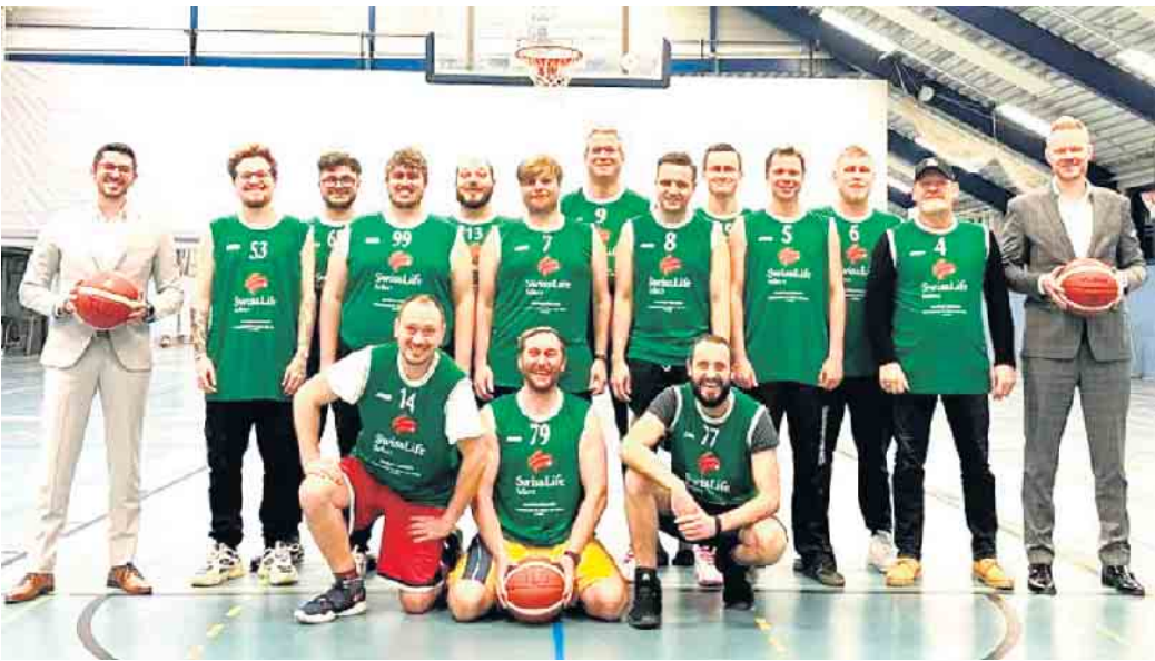
Hoch erfreut über das Sportsponsoring: TLG-Basketballer mit neuen Trikots.

Swiss Life Select und ihrer ganzheitlichen Finanzberatung auf www.swisslife-select.de .