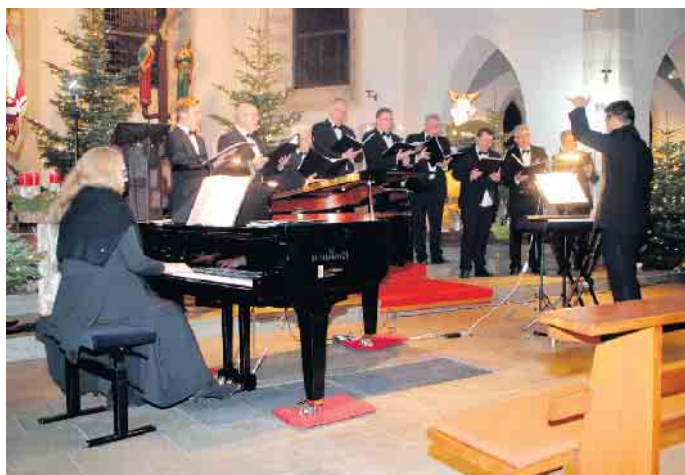
Weihnachtskonzert 2023 Ensemble MGV-Spich

Die letzte Zugabe hat es dann noch einmal in sich: Im flackern den Schein der entzündeten Kerze erklingt das hebräische Friedenslied „Al Shloscha D'varim.