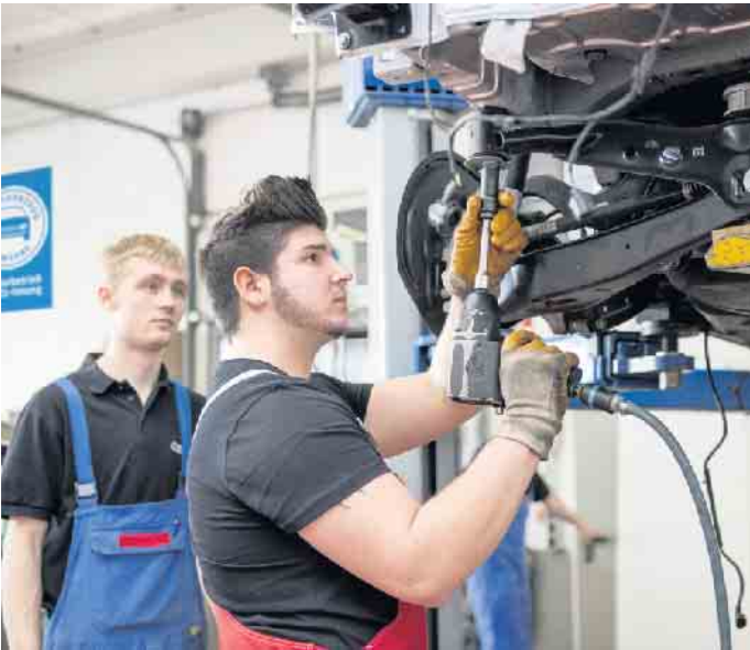
Der Kfz-Mechatroniker liegt bei jungen Männern auf Platz 1 der beliebtesten Ausbildungsberufe.

Verkäufer oder -Serviceberater. Über den klassischen Kfz-Meister sind Aufstiege zum Werkstattmanager oder Betriebsleiter möglich, und natürlich erlaubt der Meisterbrief die Übernahme oder Gründung eines eigenen Betriebs. Wer noch mehr erreichen will, kann auch akademische Abschlüsse etwa bis zum Bachelor oder Master of Business Administration in technischen und kaufmännischen Studiengängen anstreben. (DJD)