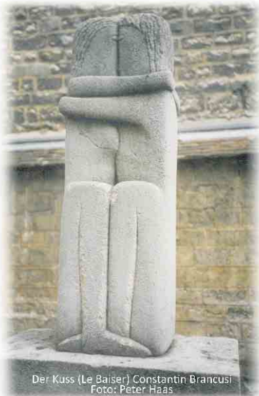
Der Kuss (Le Baiser) Constantin Brancusi

mäuse“ Bitte Aushänge beachten. 11.30 Uhr - St. Laurentius: Familienmesse mit Rückkehr der Sternsinger