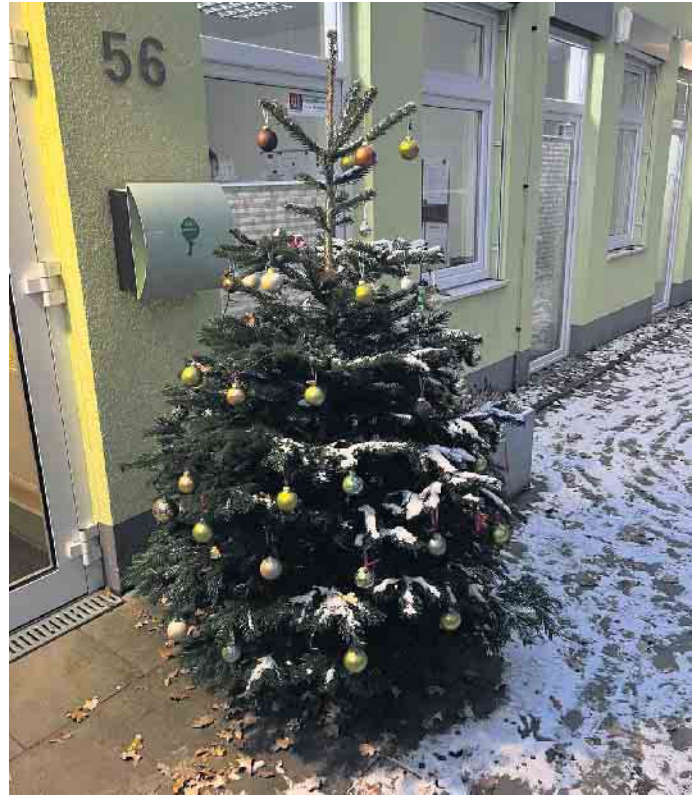
Weihnachtsbaum der Kita Kiku Wäldchen in Spich

Bleiben Sie gesund und bis nächstes Jahr. Wir freuen uns.