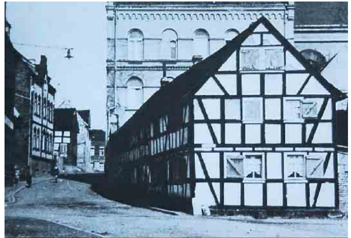
Der Präsenzhof von 1377, der etwa 1960 abgerissen wurde.

dingte Neubenennungen bei Doppelvorkommen von Straßennamen. An der Mühlengrabenbrücke endet die erste Etappe der Begehung und Erkundung der Meindorfer Straße. Brücken haben Symbolcharakter. Sie überbrücken Bäche, Flüsse, Straßen und Schienen. Sie verbinden! Im Technischen wie im Menschlichen. Die Meindorfer Straße hat den Charme der Historie! Im nächsten Teil der Exkursion erwartet uns der Meindorfer Straße zweiter Teil, die ehemalige Brückenstraße und der erbauliche Einstieg ins Landschafts- und Naturschutzgebiet. Lassen Sie sich überraschen!