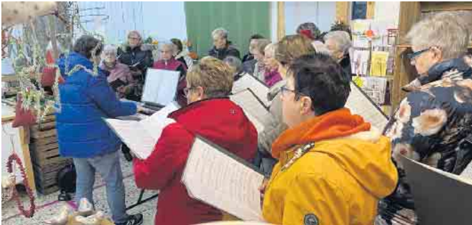
Ständchen Gärtnerei Lenz

ten Verkaufstag, als Dankeschön für die langjährige Unterstützung, ein Ständchen.