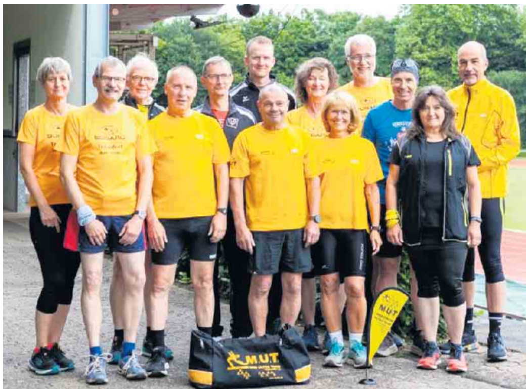
Viele Kilometer erlaufen: Mitglieder der Abteilung Marathon-Ultra-Team der TLG..