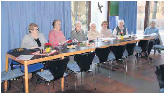
Singen gibt Lebensfreude

gen wir alte Volkslieder und Schlager in lockerer Runde. Liedermappen sind ausreichend vorhanden! Ab 14 Uhr gibt es, wie jeden Donnerstag, Kaffee und Kuchen! Kommen Sie einfach unverbindlich vorbei, es macht Spaß und schenkt gute Laune! Wir freuen uns auf Sie!