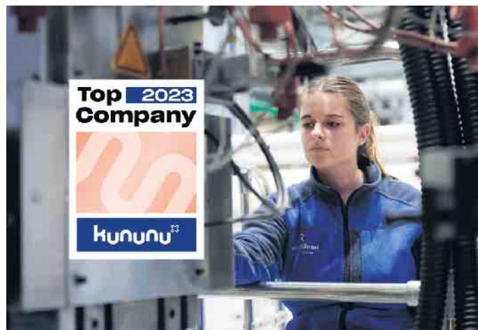
Reifenhäuser wurde wieder als Top-Unternehmen bewertet.