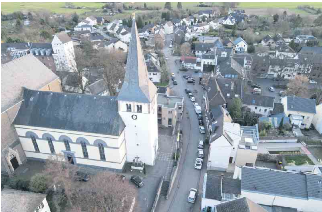
Die Meindorfer Straße in Sieglar heute in Richtung Sieg.

An der Rückseite dieses Neubaus, unterhalb der Kaplanei, ist auch heute noch ein Stützmauer zu sehen, die zwischen Kirchhofstraße und der Larstraße in Höhe „Beim Pompe Jupp“ verläuft. Die Sieglarer hatten sie vermutlich nach dem verheerenden Hochwasser von 1765 errichtet, da für die Kirche Einsturzgefahr bestand. An der Stelle, wo seit 1937 das Doppelhaus Nr. 9 und 11, gegenüber der Alten Schule, steht, welches viele Jahre als Lehrerwohnung zur Verfügung stand,