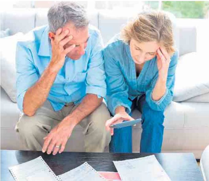
Bauherren sollten sich vor der vertraglichen Bindung mit einem Hausbauunternehmen ein genaues Bild über die voraussichtlich anfallenden Nebenkosten machen - sonst kann es schnell ein böses Erwachen geben.

cherung. Die Bauleistungsversicherung etwa umfasst alle Zerstörungen und Beschädigungen an Bauleistungen und -material, die während der Bauzeit auf der Baustelle unvorhergesehen eintreten. (djd)