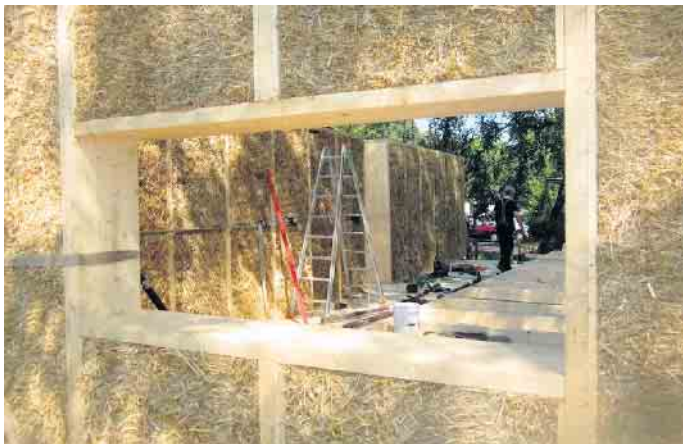
Natürliche Dämmstoffe schaffen ein gesundes Wohnklima