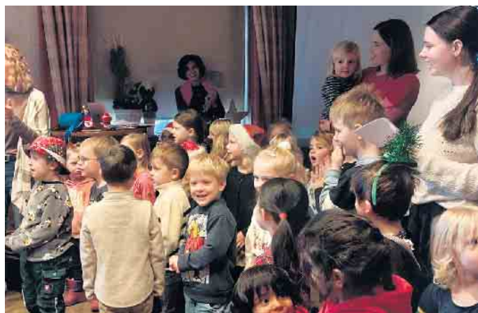
Die Mädchen und Jungen aus dem Kindergarten Levern erfreuten die Landfrauen mit weihnachtlichem Liedgut.