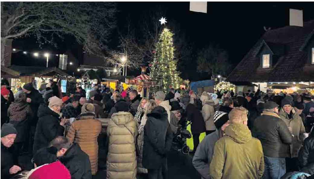
Der beschauliche Weihnachtsmarkt im Hüder Ortskern füllte sich im Laufe des Nachmittags zusehends.

HÜDE (hm). Einmal mehr lockte der beschauliche Weihnachtsmarkt „Hüder Weihnachtsmärchen“ viele Besucher für zwei Tage in den heimeligen Ort direkt am Dümmer See. Weihnachtlich geschmückte Holzhütten ließen den Dorfplatz erstrahlen, Kinderkarussell und Kunsthandwerk sorgten für Kurzweil bei groß und klein. Mit Einbruch der Dunkelheit hatte sich auch der Nikolaus seinen Weg in die kleine Budenstadt gebahnt, verteilte Süßigkeiten an die Kinder und war sowieso gern-gesehener Gast. Der kleine Weihnachtsmarkt im Ortskern wird seit dem Jahr 2000 von Mitgliedern des Hüder Dorfvereins organisiert. Viel Unterstützung gibt es von örtlichen Vereinen.