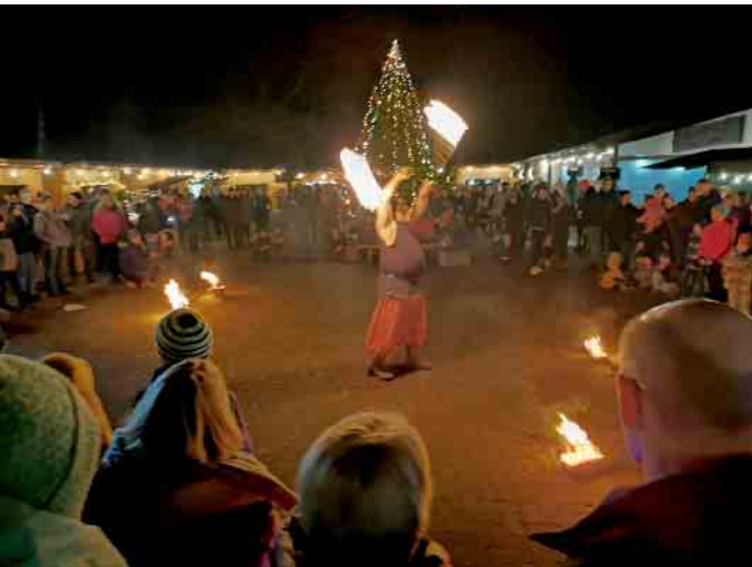
Eine Feuershow rundet das Programm ab und wird die Augen der Kinder noch einmal ganz besonders zum Glänzen bringen.