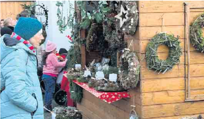
Es duftete nach frischem Tannengrün. Auf dem Dielinger Adventsmarkt gab es viele schöne Kränze zu kaufen.

Gut besuchter Dielinger Adventsmarkt vor der Marienkirche