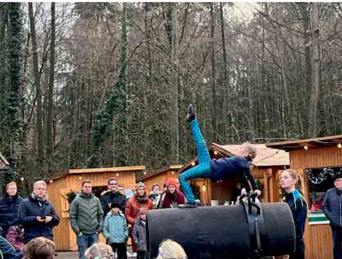
Die „Voltis“ aus Drohne möchten die Besucher wieder mit einer Aufführung erfreuen.