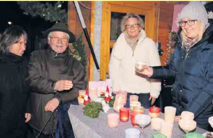
Die Besucher erwarten auch in diesem Jahr Angebote von lokalen Händlern, Kunsthandwerk, abwechslungsreiche Speisen sowie kalte und warme Getränke.