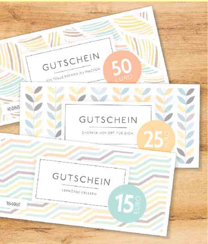
Schöne Geschenk-Idee: Am gemeinsamen Stand von Samtgemeinde und Gewerbeverein können auch die Einkaufsgutscheine der „LemFörderer“ erworben werden. Diese sind bei 33 Akzeptanzstellen aus Handel, Handwerk, Dienstleistung und Gastronomie einlösbar.