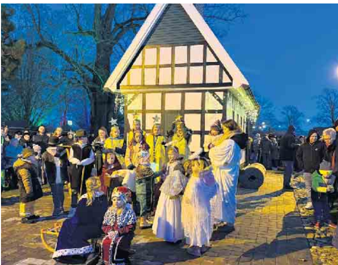
Mit dem Krippenspiel und dem heimeligen Weihnachtsmarkt an der Klus starten die Oppenweher in die beschauliche Zeit.

Event gar nicht auf die Beine stellen. Denn auch auf der zwölften Auflage des Weihnachtsmarktes an der Klus wird alles selbst gemacht und auch professionelle Verkäufer sucht man hier vergebens. Zahlreiche selbst gemachte Leckereien in fester oder flüssiger Form verwöhnten die Gaumen, die jüngeren Besucher übten sich im Stockbrot backen. Punsch, Glühwein und Feuerzangenbowle hatten Hochkonjunktur. Letzteres flambierten in regelmäßigen Abständen die Mitglieder der örtlichen Löschgruppe mit einem wirklich guten Schuss Hochprozentigem. Begleitend zum Budenzauber sorgte der Posaunenchor mit weihnachtlichen Klängen für wohlige Atmosphäre.