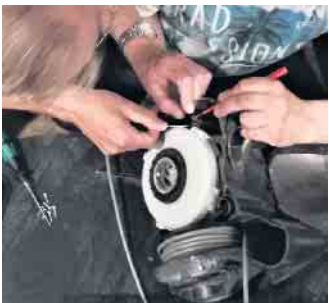
Reparatur Café Stemwede

statt. Der nächste Termin ist am Donnerstag den 19. Dezember von 17 bis 19 Uhr. Während der Öffnungszeiten sind freiwillige Reparatoren vor Ort, die über besondere Fähigkeiten im handwerklichen Bereich verfügen und bei der Reparatur defekter Alltagsgegenstände unterstützen. Darüber hinaus sind handwerklich begabten Personen, die Spass am Reparieren haben und sich aktiv einbringen möchten, eingeladen sich am „Reparatur Café