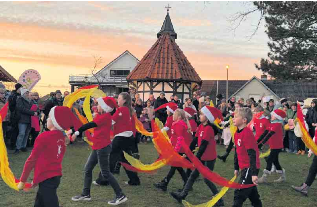
Die Turnkinder sorgen mit ihrem Auftritt für gute Unterhaltung beim Advent an der Klus.

Event gar nicht auf die Beine stellen. Denn auch auf der zwölften Auflage des Weihnachtsmarktes an der Klus wird alles selbst gemacht und auch professionelle Verkäufer sucht man hier vergebens. Zahlreiche selbst gemachte Leckereien in fester oder flüssiger Form verwöhnten die Gaumen, die jüngeren Besucher übten sich im Stockbrot backen. Punsch, Glühwein und Feuerzangenbowle hatten Hochkonjunktur. Letzteres flambierten in regelmäßigen Abständen die Mitglieder der örtlichen Löschgruppe mit einem wirklich guten Schuss Hochprozentigem. Begleitend zum Budenzauber sorgte der Posaunenchor mit weihnachtlichen Klängen für wohlige Atmosphäre.