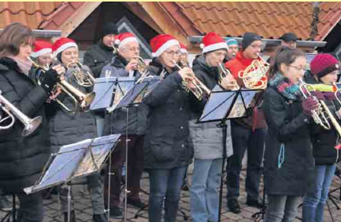
Der Posaunenchor spielt dieses Jahr an beiden Tagen. Am Sonntag wird es zudem ein Blaskonzert der Jäger geben und gegen 15.30 Uhr wollen auch der Weihnachtsmann und die Lichterfeen vorbeischnellen.

der schönsten Weihnachtsmärkte der Region. Kein Wunder also, dass die Organisatoren am bewährten Konzept festhalten. Seitens der „LemFörderer“ heißt es weiter: „Die Lichterfeen eröffnen am Samstag den Markt und heißen die Gäste willkommen, die sich unter anderem auch wieder mit dem Kirchkafee in der schönen Kirche und auch an einem Puppentheater im Rittersaal erfreuen können.“