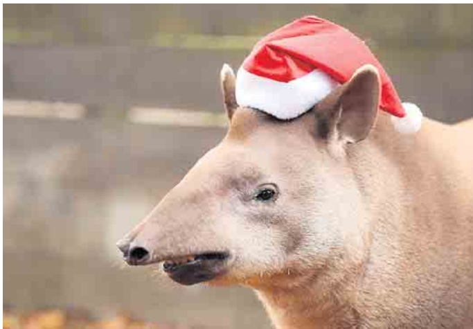
Auch er freut sich schon auf viele Besucher: Der „Weihnachtstapier“ im Tierpark Ströhen.

„Die Entdeckerweihnacht wird der einzige Weihnachtsmarkt in Deutschland sein, auf dem Elefanten zwischen den Ständen schlendern und man ihnen hautnah begegnen kann. Das ist selbst für einen Tierparkweihnachtsmarkt eine echte Besonderheit.“ Damit aber nicht genug. Mit liebevoll gestalteten Ständen und besonderen Attraktionen möchte die Entdeckerweihnacht eine Verbindung zwischen tierischen Begegnungen und weihnachtlichem Flair herstellen. Der Be-