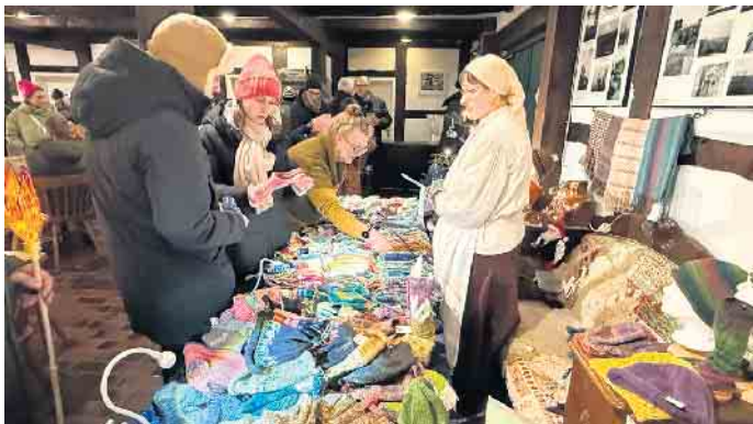
Jede Menge Wolliges galt es beim Hüder Weihnachtsmärchen zu entdecken.