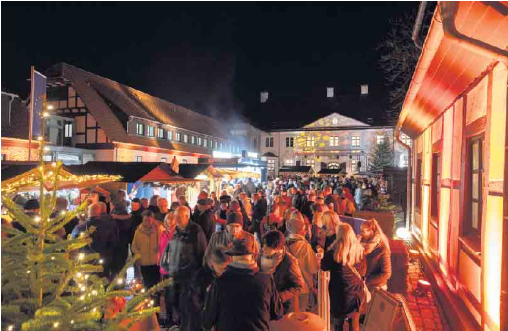
Die besondere Atmosphäre des Winterlichen Schlossvergnügens zieht jedes Jahr zahlreiche Besucherinnen und Besucher an.