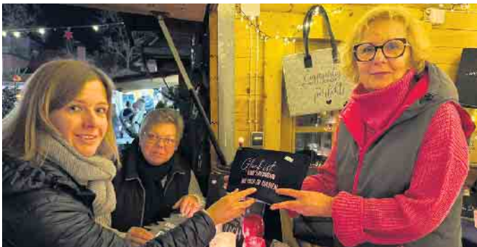
Schönes Kunsthandwerk begeisterte die Besucher beim Hüder Weihnachtsmarkt.