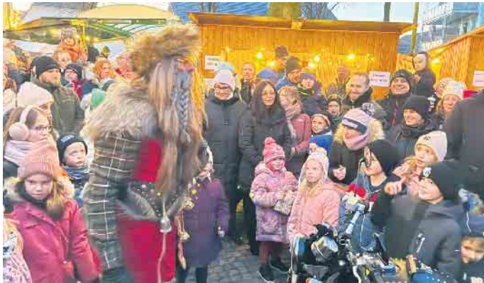
Im Nu war der Nikolaus von unzähligen Kindern umringt.

chen und vieles mehr. Wem der Sinn nicht nach Glühwein oder Bratwurst stand, der konnte sich an frisch gebackenen Waffeln laben. „Hier kommen die Menschen zusammen, klönen miteinander. Das ist einfach nur schön“, meinte ein Besucherin aus Dielingen. Sowieso gab es im Budendorf eine schöne Auswahl an Kunsthandwerk. Gestricktes, Genähtes, Kerzen und vieles mehr gehörte zum Angebot. Große Aufmerksamkeit zogen die naturbelassenen Kränze auf sich, die als Tisch- oder Türdekoration das Zuhause schmücken sollen. Es duftete nach frischer Tanne und die Kunsthandwerker selbst standen oft mit einem Lächeln in ihren Hütten. Am Nachmittag waren besonders viele Kinder auf dem Dielinger Adventsmarkt anzutreffen. Nicht ohne Grund: Sie erwarteten den Nikolaus. Und der kam auf seinem Motorrad angeknattert und begrüßte die kleinen und großen Gäste mit