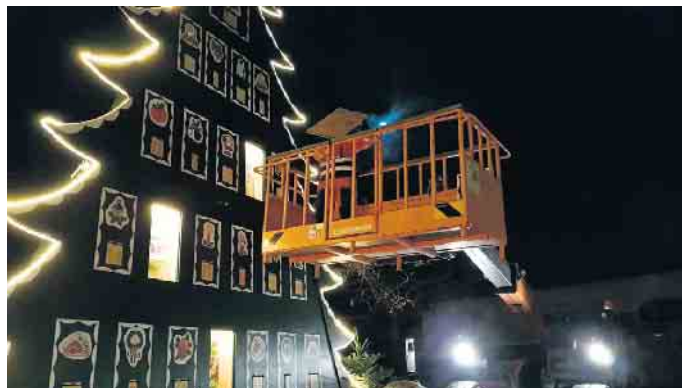
Ein riesiger Spaß mit einem riesigen Adventskalender: Was sich wohl dieses Mal hinter den Türchen der Haldemer Adventskalenders verbirgt?

Haldemer Str. 10 • 32351 Stemwede Mo-So 6-22 Uhr • www.hahme-markt.de