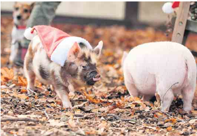
Glück mit den Schweinchen: Mit der „Entdeckerweihnacht“ soll eine Verbindung zwischen tierischen Begegnungen und weihnachtlichem Flair hergestellt werden.

Elefanten schlendern zwischen den Ständen umher: „Entdeckerweihnacht“ im Tierpark Ströhen läuft noch bis zum 15. Dezember