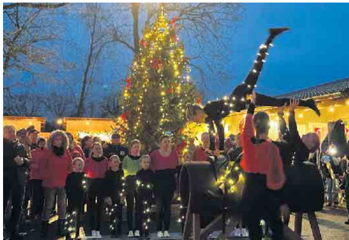
Lieb gewonnene Tradition: Auch die „Voltis“ aus Drohne sind mit ihren spektakulären Aufführungen wieder Teil des Programms.

Wäldchen am Sonntag, 14. Dezember, ab 14 Uhr. Weihnachtlich geschmückte Stände erwarten die jungen und junggebliebenen Besucher. Angeboten wird ein buntes Programm, um uns auf die kommenden Weihnachtstage einzustimmen. In diesem Jahr jährt sich die