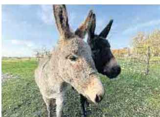
Janosch und Alfons fühlen sich wohl in Niedermehren.