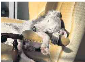
Galgo „Collin“ genießt das Leben bei seiner Familie in Niedermehren.