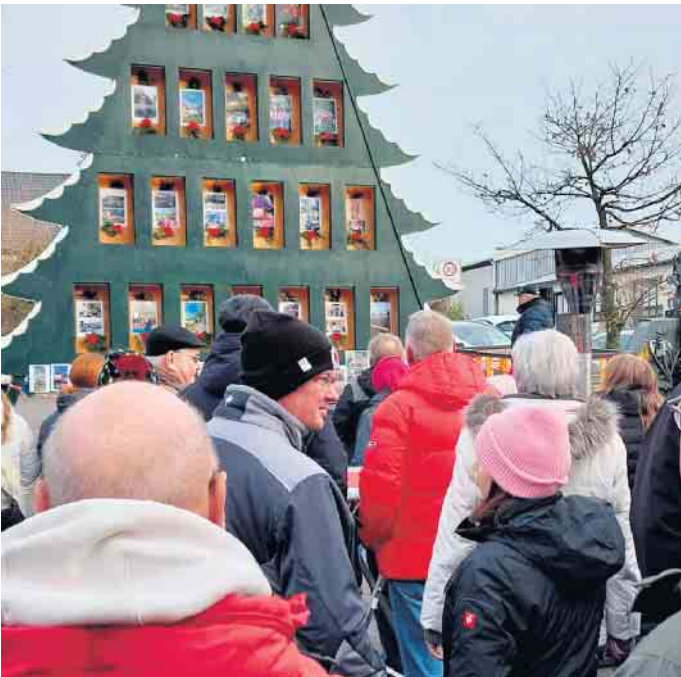
Türchenöffnung Heiligabend 2024.

innen und Teilnehmern fest die Daumen. Neben besinnlicher Musik und weihnachtlicher Atmosphäre sorgen wir natürlich auch für das leibliche Wohl. Warme und kalte Getränke, leckere Bratwurst vom Grill und für die Kinder kleine Aufmerksamkeiten warten auf alle Besucherinnen und Besucher. Wie in jedem Jahr gibt es außerdem eine Tombola mit vielen schönen Preisen - und auch unsere Los-Feen und Los-Elfen dürfen sich auf eine kleine Überraschung freuen. Kommt vorbei, bringt Familie und Freunde mit und genießt gemeinsam ein paar gemütliche Stunden in unserer Dorfmitte. Wir freuen uns auf viele Gäste, gute Gespräche und eine wunder-volle Adventszeit! Eure Dorfgemeinschaft Haldem...macht was e.V.