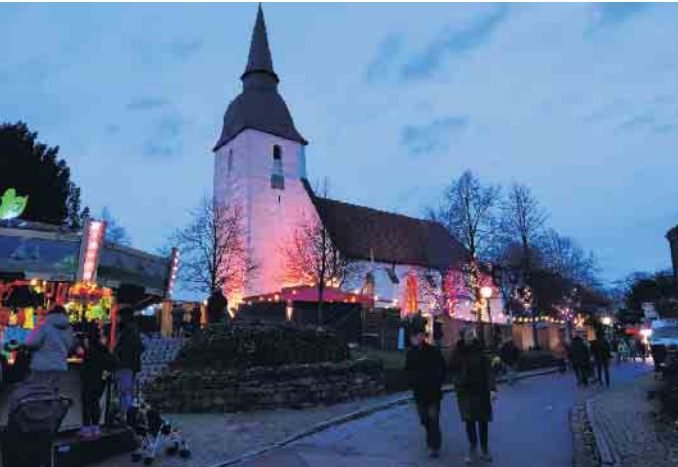
Im historischen Ortskern rund um die Leverner Stiftskirche geht es am 2. Advents-Wochenende wieder festlich zu.

Hier gibt es weitere Highlights zu entdecken