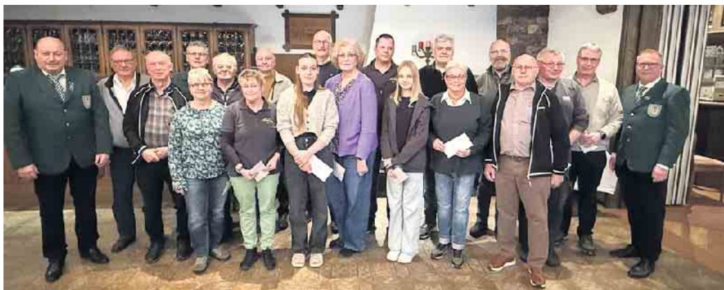
Die erfolgreichen Teilnehmer der Deutschen Meisterschaften im Sportjahr 2025.

Sportschützen feiern ihre Besten in Oppenwehe