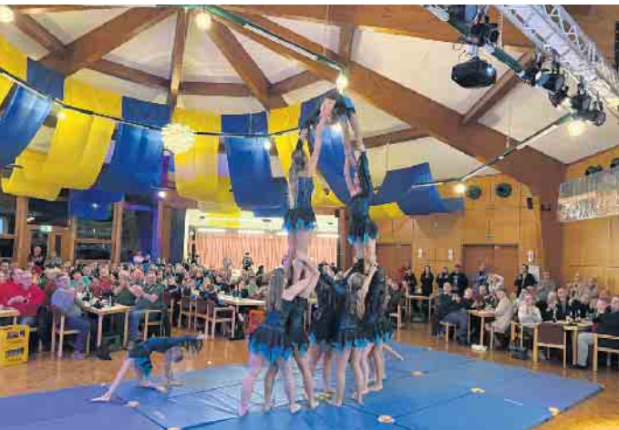
Die Show-Akrobatikgruppe aus Bad Oeynhausen unterhielt in der Pause die Gäste bei der Sportlerehrung.

dass Sportangebote in Stemwede vielfältig, lebendig und für alle Generationen zugänglich bleiben. Mit den Auszeichnungen würdigten die Gemeinde Stemwede und der Gemeindesportverband zwei Menschen, die mit viel Herzblut und unermüdlichem Einsatz ihren Verein bereichern. Die Geehrten erhielten im Rahmen der Veranstaltung nicht nur Urkunden und Anerkennung, sondern vor allem lang anhaltenden Applaus.