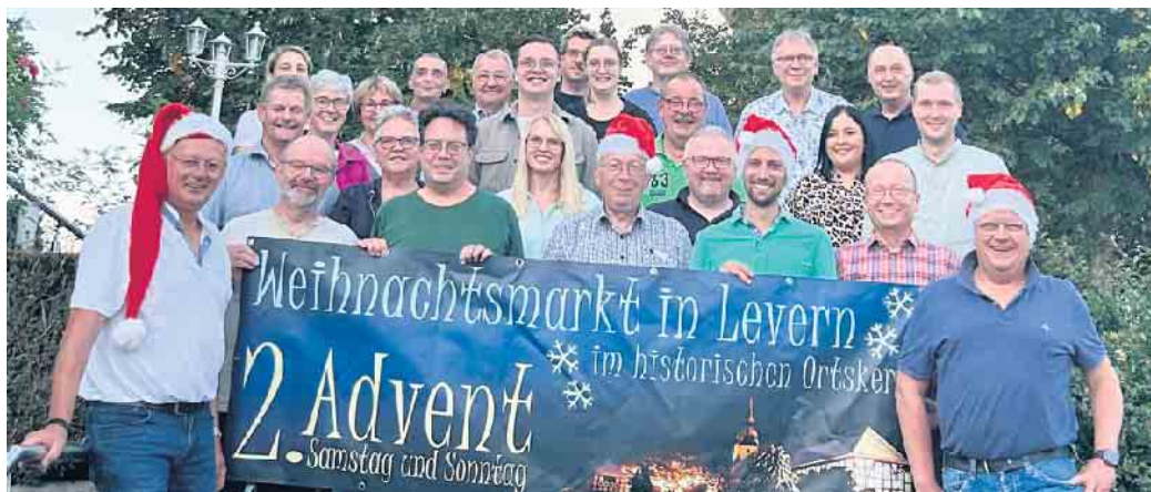
Der Vorstand und die Mitglieder des neuen Vereins „Weihnachten in Levern e. V.“ freuen sich schon auf den beliebten Markt am zweiten Advents-Wochenende.

Für die Jüngsten gibt es außerdem Stockbrotbacken an der Feuerschale mit dem Jugendreferenten und dem Förderverein der Grundschule Levern. Das Team des Hotel-Restaurants Schwiizeralp und der Skihütte bieten Glühwein mit und ohne Schuss an, Essen