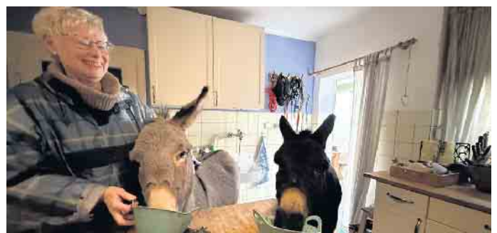
„Hier darf gelebt werden!“, sagt Marike Egmond. Janosch und Alfons bedienen sich in der Küche schon mal selbstständig.