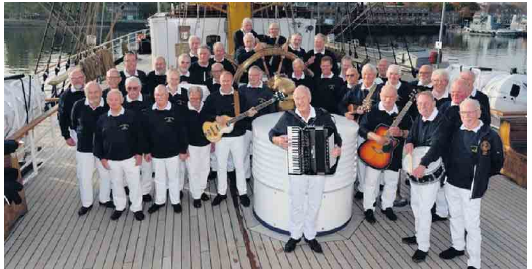
Für die passende Atmosphäre sorgt der weithin bekannte Bänder Shantychor gemeinsam mit der Sailor-Band.

Der Chor ist Teil der Marinekameradschaft von 1900 Bünde e. V. und gilt als ältester Shantychor Nordrhein-Westfalens. Seine Ursprünge reichen bis zum 25. Januar 1967 zurück, als eine Gesangsgruppe der Bänder Marinejugend den Grundstein für den ostwestfälischen Shanty-Gesang legte. Seither hat der Chor mit zahlreichen Auftritten im In- und Ausland die Stadt Bünde weit über die Region hinaus bekannt gemacht. Mit einem breit gefächerten Repertoire aus klassischen und mo-