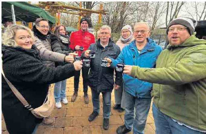
Mitglieder des Kleinendorfer Schützenvereins freuten sich auf ein gelungenes Winterfest.

Kleinendorf feiert stimmungsvolles heimeliges Wintervergnügen