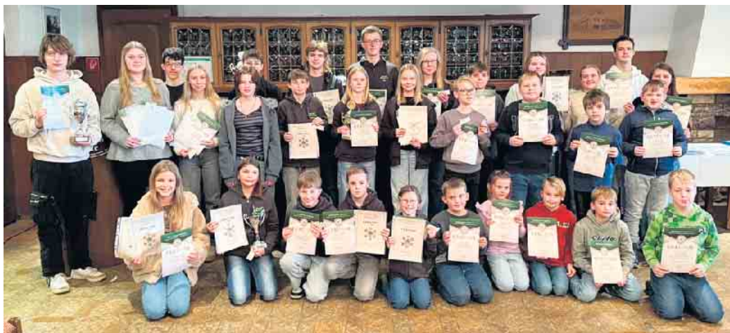
Der Schützennachwuchs konnte zahlreiche Titel und Auszeichnungen mit nach Hause nehmen.

OPPENWEHE (hm). Für alle Sportschützen im Schützenkreis ist es eine lieb gewonnene Tradition, die Besten unter ihnen zu ehren. Am Sonnabend versammelten sich die Grünröcke, um Pokale und Urkunden für ihre besonderen Leistungen entgegenzunehmen. Der Saal von Meiers Deelee in Oppenwehe