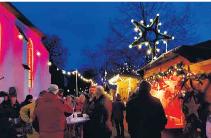
Rund um die mittelalterliche Stiftskirche, das Wahrzeichen des mehr als 1.000 Jahre alten Ortes, gibt es viel zu entdecken.

Zum Auftakt des Levrer Weihnachtsmarktes findet am Freitag, 6. Dezember, ab 19 Uhr, in der Stiftskirche Levern ein Nikolauskonzert statt. Das gestalten der Spielmannszug Levern und der Projektchor Vocaviva by Sarah Seeger. Anschließend können sich die Gäste im „Upwärm-Telt“ auf den Weihnachtsmarkt einstimmen.