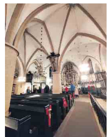
Die Stiftskirche ist in der Adventszeit auch drinnen festlich beleuchtet.

den Tagen bietet der Heimatverein auch Führungen im Turm und im mittelalterlichen Gewölbe der Stiftskirche an. Die Zeiten werden auf einem Aufsteller in der Kirche angezeigt - der Aufsteller ist auch Treffpunkt. Am Kirchplatz erklingt eine Dreh-