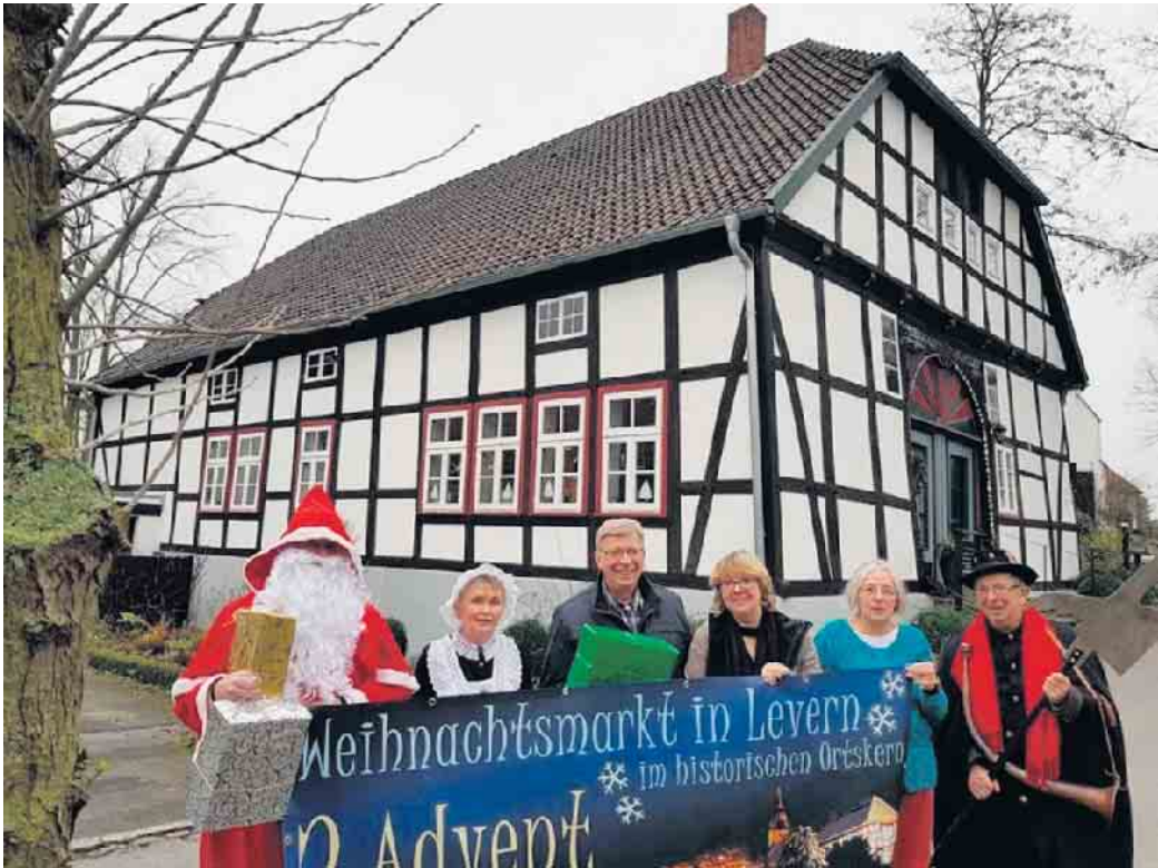
Das Team des Heimathauses freut sich auf einen schönen Weihnachtsmarkt am 2. Adventwochenende im historischen Ortskern.

Levern. Die erfolgten baulichen und gestalterischen Maßnahmen in den vergangenen Monaten links und rechts der Badallee haben auch den Blick auf die rund 300-jährige Badetradition in Levern wach werden lassen. Vergangenheit und Gegenwart vereint die diesjährige Sonderausstellung, die das Team des Heimathauses anlässlich des Weihnachtsmarktes zeigt. Wegen der sonstigen Aktivitäten im adventlich geschmückten Heimathaus ist der Platz für die Stellwandflächen begrenzt. Die angebrachten Aufzeichnungen, Fotos, Postkarten, vielfach mit dem Aufdruck Bad Levern sowie diverse Presseberichte dürften dennoch viel Interesse finden. Das erste Badehaus, schon im Jahr 1699 in Fachwerkbauweise errichtet, gab Anlass das Wasser der Schwefelquellen verstärkt für gesundheitliche Zwecke zu nutzen, insbesondere zur Linderung rheumatischer Erkrankungen