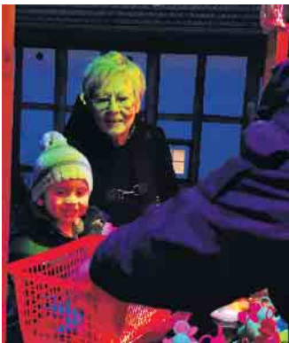
Noch immer ein Spaß für Jung und Alt: der Klassiker „Entenangeln“.