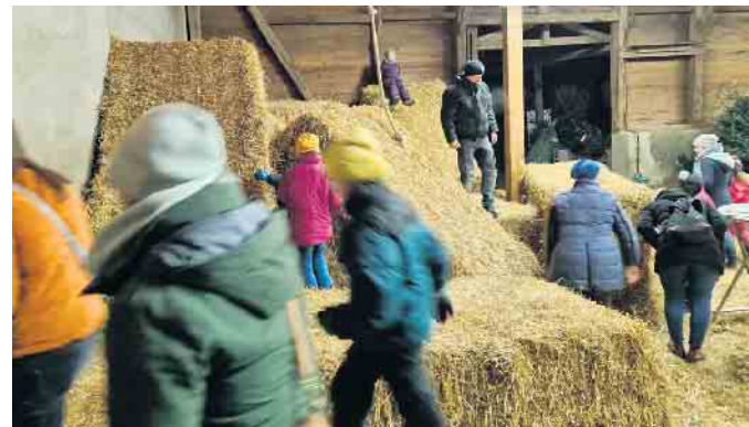
Kinder in der Strohburg

stalter bieten hier Eltern und Kindern eine Gelegenheit, gebrauchtes, gut erhaltenes Spielzeug in weihnachtlicher Atmosphäre der