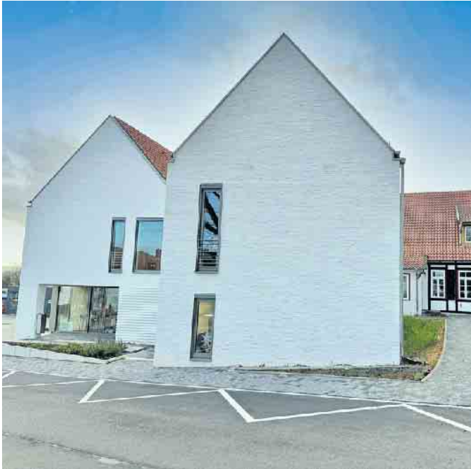
Eine aktuelle Aufnahme vom Amtshaus aus November. Anlässlich des Leverner Weihnachtsmarktes möchte die Stemweder Gemeindeverwaltung ihr neues Zuhause präsentieren und lädt für Sonntag, 8. Dezember, zu einem Tag der offenen Tür ein.

hen, wie sich Altes Amtshaus und Neubau zusammenfügen, so der Verwaltungschef. „Ich wurde schon häufiger auf eine solche Gelegenheit angesprochen. Es ist ja auch nachvollziehbar, dass die Stemwederinnen und Stemweder gerne wissen möchten, wie und wo sich die Gemeindeverwaltung neu aufgestellt hat.“ Herzstück des Verwaltungsneubaus ist sicherlich der neue Bürgerservice mit einem offenen Empfang sowie der Tourist-Info. Entstanden sind zudem aber auch Büros, ein Aufenthaltsraum oder auch der große Stemweder-Berg-Saal, in dem u.a. die Stemweder Ausschusssitzungen stattfinden. „Am 2. Advent präsentiert sich bei uns im Sitzungssaal dann auch der Stemweder Partnerschaftsverein“, berichtet Abrusatz. „Ich freue mich, möglichst viele Stemwederinnen und Stemweder zum Tag der offenen Tür bei uns im Amtshaus begrüßen zu können.“