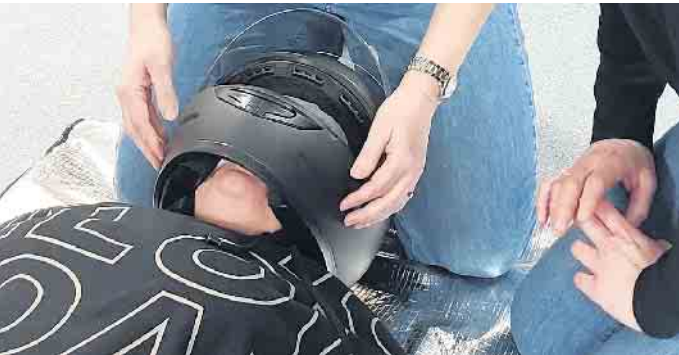
Bei einem Motorradunfall setzen die Ersthelfer den Helm ab, damit die Atmung überprüft werden kann.

Begeisterte Teilnehmerinnen durch abwechslungsreiche Schulung