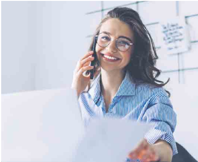
Schwindeln im Vorstellungsgespräch? Eher keine gute Idee. Besser ist es, seine Wissenslücken zuzugeben - oder sie vorab mit einer Weiterbildung zu schließen.

Arbeitgeber schätzen nicht nur Bewerber, die über fundierte Kenntnisse in Office-Anwendungen verfügen, sondern auch Ehrlichkeit und Offenheit. Eine Aussage wie „In Excel bin ich noch nicht so fit, aber ich mache gerade eine Weiterbildung“ wird von Arbeitgebern deutlich lieber gehört als der Satz „Da bin ich Profi“, der sich im Arbeitsalltag dann als falsch herausstellt. Hier gilt das Motto: Mut und Offenheit zur Wissenslücke - oder besser noch im Vorfeld Lücken schließen. (DJD)