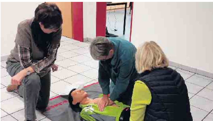
Die Herz-Lungen-Wiederbelebung - 30-mal drücken - zweimal beatmen - 30-mal drücken.