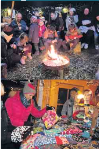
Illustration: Susan Groneweg