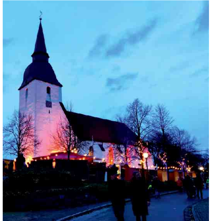
Rund um die mittelalterliche Levern Stiftskirche, das Wahrzeichen des mehr als 1.000 Jahre alten Ortes, geht es am zweiten Adventswochenende wieder stimmungsvoll zu.

Stiftskirche, das Wahrzeichen des mehr als 1.000 Jahre alten Ortes, gibt es viel zu entdecken. Bei der mittlerweile 34. Auflage des Weihnachtsmarktes in Levern gibt es viel Kunsthandwerk und Ausstellungen, Gäste können in mittelalterlichen Gewölben einkehren und sich natürlich mit Speisen und warmen wie kalten Getränken