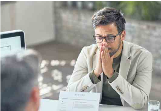
Schwindeln im Vorstellungsgespräch? Eher keine gute Idee. Besser ist es, seine Wissenslücken zuzugeben - oder sie vorab mit einer Weiterbildung zu schließen.

Jobsuchende, die sich unsicher in Office-Anwendungen fühlen, sollten daher über eine Weiterbildung nachdenken. Diese wird in unterschiedlichen Intensitätsstufen angeboten, vom Einsteiger- bis zum Profikurs. Einer der größten Bildungsträger in Deutschland, das