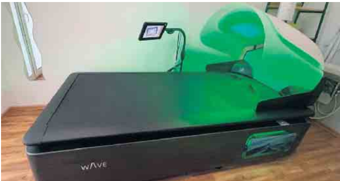
Der Hydrojet hat eine Aroma- und Lichttherapie, die auf uns in der dunklen Jahreszeit entspannend und wohltuend einwirkt.

Der Hydrojet arbeitet mit Wasserstrahlen, die Ihren gesamten Körper massieren. Sie liegen entspannt auf einem speziellen Wasserbett und genießen die gleichmäßige Massage. Das warme Wasser trägt zusätzlich zur wohltuenden Wirkung bei. Weiter hat unser Hydrojet eine Aroma- und Lichttherapie, die auf uns in der dunklen Jahreszeit entspannend und wohltuend einwirkt.