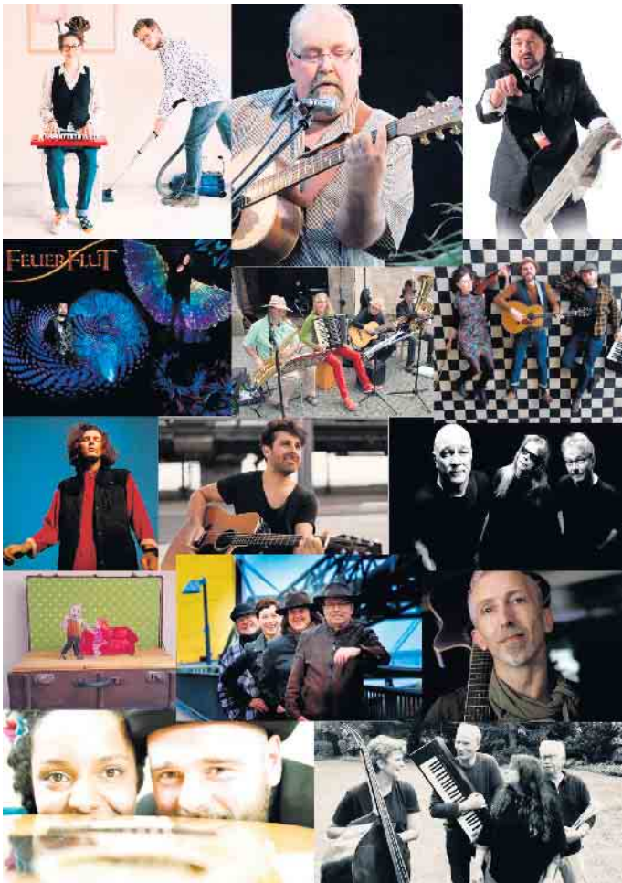
Eine Collage der Teilnehmer des 2. Stemweder Kulturkarussells: Grundsätzlich sind Bewerbungen aus allen Richtungen von Musik, Kabarett, Comedy oder sonstigen Bühnenprogrammen möglich.

Das Konzept des „Stemweder Kulturkarussell“ wurde als ein Angebot der Begegnung, der Kommunikation und des Austausches in der Kulturszene im Rahmen des Projekts „Dritte Orte - Häuser für Kultur und Begegnung im ländlichen Raum“, das vom Ministerium für Kultur und Wissenschaft des Landes Nordrhein-Westfalen gefördert wird, entwickelt. Dies teilen die Veranstalter in einer Pressemitteilung mit.