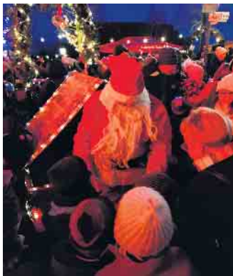
Er darf natürlich nicht fehlen - auch der Nikolaus hat sein Kommen wieder für beide Tage angekündigt.