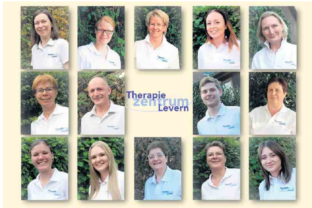
Das Team vom Therapiezentrum Levern

heitsspezifischen Themen. Abwechslung gehört ebenfalls in den Arbeitsalltag der vierzehn Mitarbeiter. Zusätzliche Therapien in Einrichtungen wie Pflegeheimen, Behindertenwerkstätten, Kindergärten und Firmen machen den Beruf interessant. Zum Therapieangebot gehören neben Krankengymnastik (KG), KG-ZNS, Manuelle Therapie, Manuelle Lymphdrainage, Massagen und Bäder. Das Therapiezentrum Levern gehört zu den wenigen Physiotherapeutischen Praxen, die medizinische Bäder mit Zusätzen, Unterwassermassagen und Stangerbäder anbieten. Auch die Behandlung von Kindern und von Patienten mit Kieferbeschwerden sowie Beckenbodentherapie und die Zulassungserweiterung T-Rena (Rehabilitationsnachsorge-Angebote der Deutschen Rentenversicherung) sind Bestandteil der Therapie. Reha-Sport, auch für Lungenkrankte, sowie Präventionskurse und betriebliche Gesundheitsförderung runden das vielfältige Angebot ab. Aktuell sucht das Team Verstärkung. Bewerber sind am Tag der offenen Tür (Am Heilbad 26 in Stemwede - Levern) herzlich willkommen. Weitere Information finden Sie unter www.therapiezentrum-levern.de