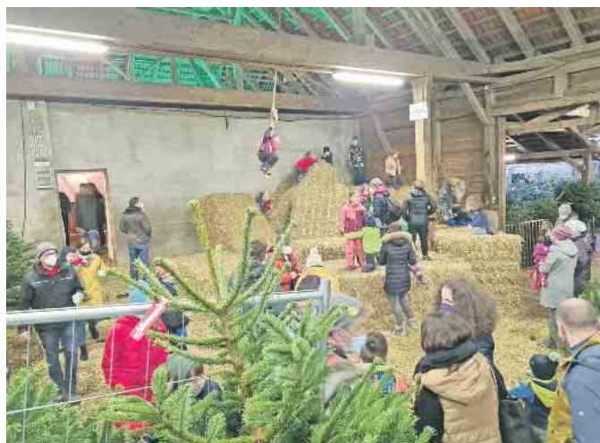
Strohburg für Kinder auf dem Bauernhof Driehaus

Driehaus Tannenbäume Driehauser Straße 5, 49179 Ostercappeln-Schwagstorf