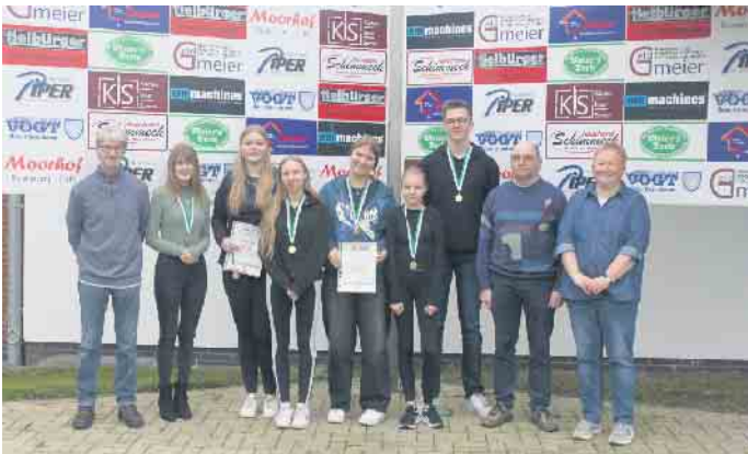
Der erfolgreiche Schützennachwuchs. Man freute sich, dass in diesem Jahr wieder deutlich mehr Jugendliche an den Kreismeisterschaften teilgenommen haben.