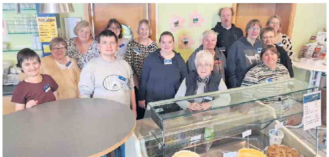
Team Café-House Wehdem

das Café-House auch von den Landfrauen Wehdem. Das Café-Team freut sich auf seine Stammgäste und auf neue Besucher jeden Alters.