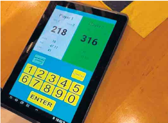
Die Ergebnisse aus dem Dartsspiel können digital über ein iPad verwaltet und abgelesen werden.

Neues Angebot: Ab sofort jeden Donnerstag Darts im Sportheim des TuS Dielingen