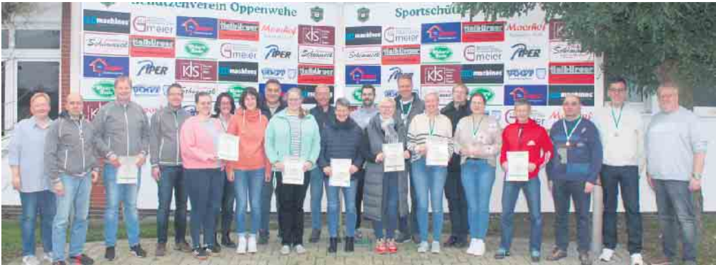
Der Schützenkreis Lübbecke hat die Kreismeisterschaften mit dem Luftgewehr im Schießsportzentrum in Oppenwehe ermittelt.

Schützenkreis Lübbecke ermittelt Kreismeisterschaften mit dem Luftgewehr - Erfolge in der Einzel- und Mannschaftswertung