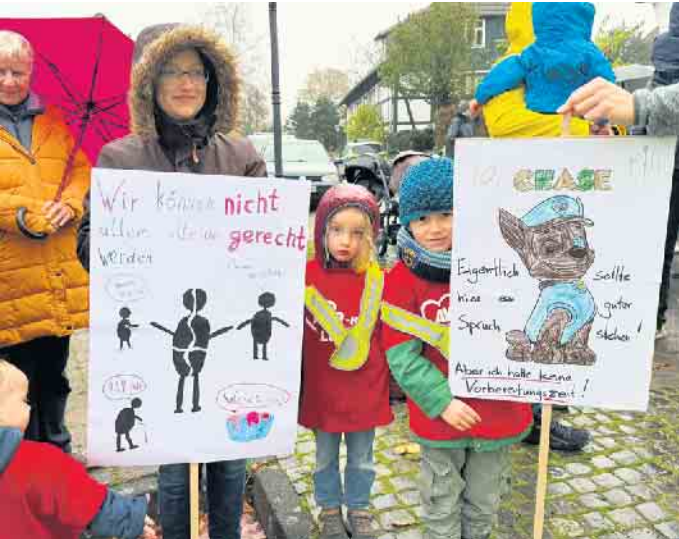
Mit einfallsreichen Plakaten und deutlicher Aussage haben sich viele Demonstranten auf den Weg gemacht.

„Viele können die Belastung kaum noch aushalten“: Demonstration der Stemweder Kitas vor dem Leverner Amtshaus gegen die Sparpläne der Landesregierung