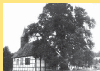
Historische Aufnahme: Die Klus nach 1648.