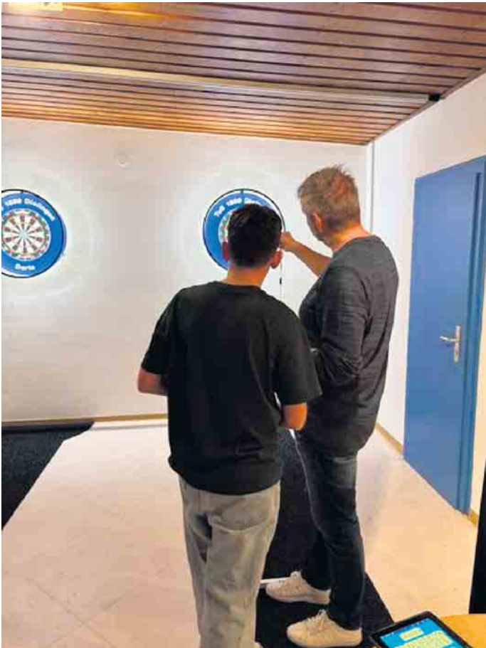
Im Sportheim des TuS Dielingen ist Platz für Dartscheiben geschaffen worden, um ein neues Angebot für alle im Verein anbieten zu können.

dendieck, beide Fans des Dartsports, überlegten im Sportheim des TuS Dielingen einen Platz für eine Dartscheibe zu schaffen, um ein neues Angebot für alle im Verein anbieten zu können. Die Idee,