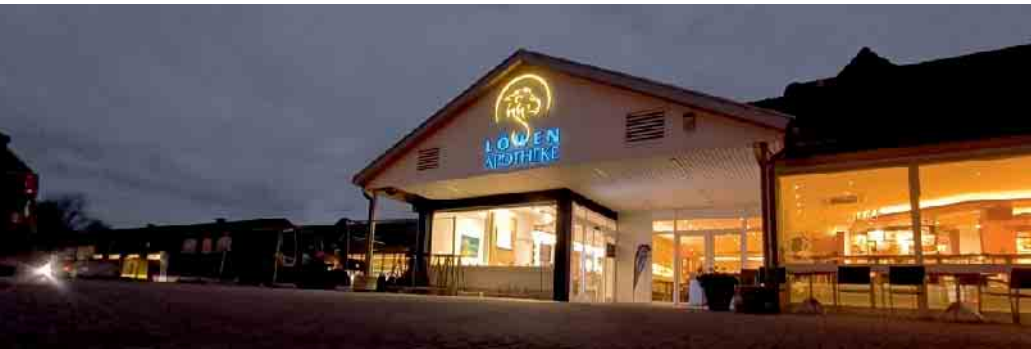
Viel Bewegung im Lemförder Ortskern: Die neuen Räumlichkeiten der Löwen Apotheke befinden sich seit dem 21. Oktober in der Hauptstraße 44 direkt neben der Bäckerei Schmidt gegenüber von Rossmann. Links daneben zu sehen sind das neue und das alte ALDI-Gebäude, wo Mitte November am frühen Abend noch tatkräftig am Um- bzw. Neubau gearbeitet wurde.

Am Eröffnungstag erwartet die Kundinnen und Kunden nicht nur ein neuer ALDI Markt, sondern auch ein Gewinnspiel: Die ersten 100 Besucherinnen und Besucher bekommen als Willkommensgeschenk jeweils ein Rubbellos, unter denen sich attraktive Sofortgewinne befinden. Als Hauptgewinn winkt ein ALDI Einkaufsgutschein über 500 Euro. Mit einem kostenlosen Kaffee- und Würstchenstand ist an diesem Tag zudem für das leibliche Wohl gesorgt.