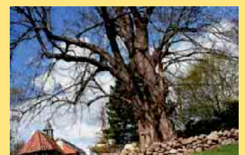
Im Mittelpunkt des kleinen Klusgartens fällt die über 360 Jahre alte Linde jedem Besucher direkt ins Auge.