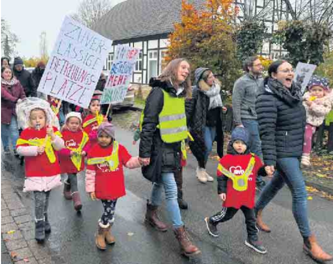
Eltern, Kinder und Erzieherinnen auf dem Weg zum Amtshaus in Lavern.