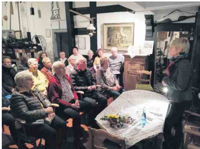
Der Heimatverein Levern freute sich über ein volles Haus