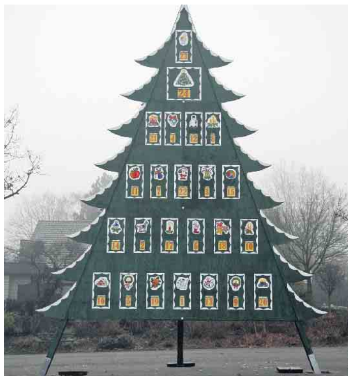
Der Adventskalender in Haldem wird wieder aufgebaut

Schon heute wünschen wir allen Teilnehmern viel Glück. Wir freuen uns auf interessante Geschichten zu den Kalenderbildern, auf eine besinnliche Vorweihnachtszeit und laden alle interessierten Einwohnerinnen und Einwohner ein, an diesen Tagen mit uns ein paar schöne Stunden zu verbringen. Eure Dorfgemeinschaft Haldem... macht was!