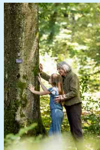
Ein Baum kann über Generationen hinweg als Ort der letzten Ruhe genutzt werden.

Der Anbieter FriedWald beispielsweise gewährt beim Kauf eines Baumes mit zwei Urnenplätzen eine Nutzungsdauer von bis zu 99 Jahren ab Eröffnung eines Waldes. Auch beim Erwerb eines Grabrechtes mit einer Ruhezeit von 15 bis 30 Jahren ist die biologisch abbaubare Urne nach Ablauf nicht mehr vorhanden. Es muss kein