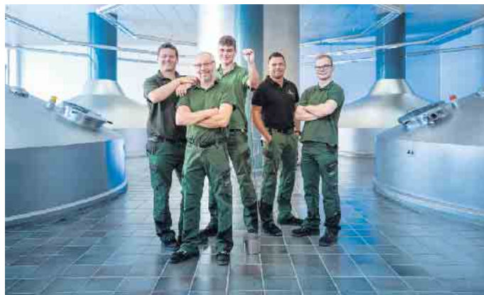
Brauer- und Mälzer-Azubis durchlaufen in drei Jahren alle Schritte der Bierherstellung und erlernen den Umgang und den Einsatz von Roh-, Hilfs- und Betriebsstoffen. Foto: djd/Brauerei C. & A. Veltins

Um die Poren und Fugen des Holzes zu schließen und ein Entweichen der Kohlensäure zu verhindern, aber auch um im Fassinnen eine geschmackliche Veränderung durch den Kontakt zwischen Bier und Holz zu vermeiden, mussten Küfer die Holzfässer mit flüssigem und extrem heißem Pech auskleiden. War die dünne Schicht beschädigt, musste mühsam eine neue aufgetragen werden. (djd)