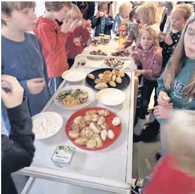
Das Buffet für die Wiedersehensfete