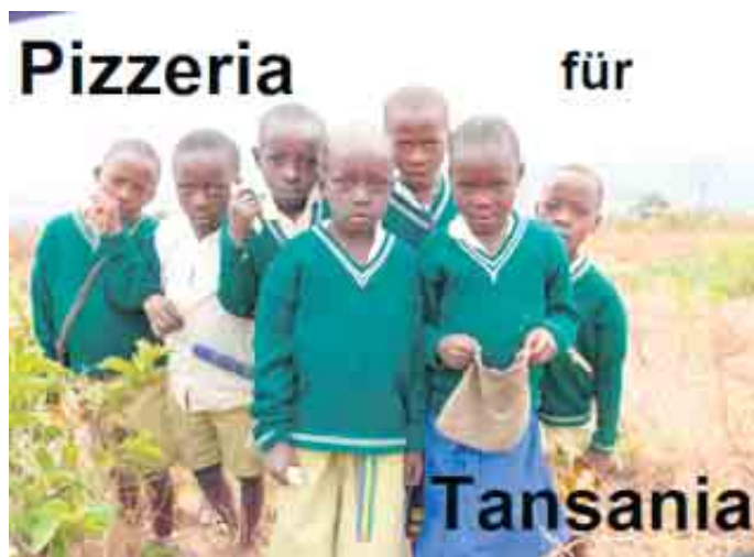
Pizza für Tansania