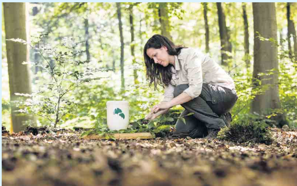
Die Asche in einer biologisch abbaubaren Urne geht nach einigen Jahren in den Waldboden über.

Um diese Frage zu beantworten, sind zwei Dinge von Bedeutung. Erstens ist wichtig, welche Art von Urne verwendet wurde. Zweitens, welche Nutzungs- und Ruhezeit für das Grab gelten. Zur Erklärung: In der Vergangenheit waren Urnen meistens aus Kunststoff, Keramik oder Metall und nicht abbaubar. Auch heute gibt es noch diese Urnen-Variante. Urnen verbleiben mindestens für die Dauer