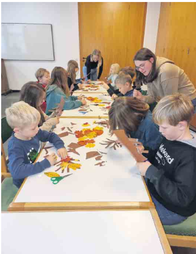
Konzentration in der Bastelgruppe