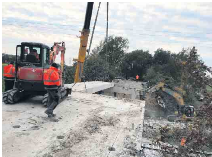
Mit Bagger und Kran ging es dem Brückenbauwerk an den Kragen. Die Arbeiten sind schneller vorangekommen, als geplant.