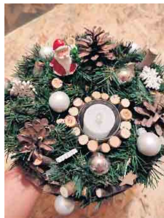
Gestecke aus Naturmaterialien