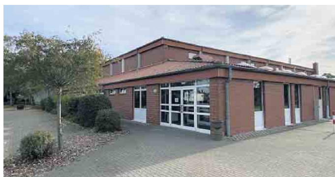
Ab sofort wird jeden Samstag zwischen 10 und 12 Uhr in der Dielinger Turnhalle geimpft.

Auch dieses Einvernehmen und der Zuspruch sind wieder einmal typisch Stemwede.“