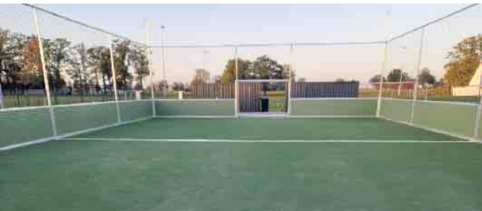
Teil des neuen Fitnessparks in Oppenwehe eröffnet

genmitteln des Vereins. Neben dem Mehrzweckfeld wird jetzt noch ein Fitnessbereich und ein Naturerlebnispark errichtet. Die Gesamtkosten dieses Projektes belaufen sich auf ca. 80.000 Euro, die Förderung beträgt 47.000 Euro. Wichtig ist dem FCO, dass dieses Mehrzweckfeld allen Nutzern offen steht. Neben den Sportgruppen des FCO, wird die Anlage auch von der örtlichen Grundschule und dem Kindergarten genutzt. Auch den Oppenweher Kindern und Jugendlichen steht das Feld in den Nachmittagsstunden jederzeit zur Verfügung und wird auch schon fleißig bespielt.