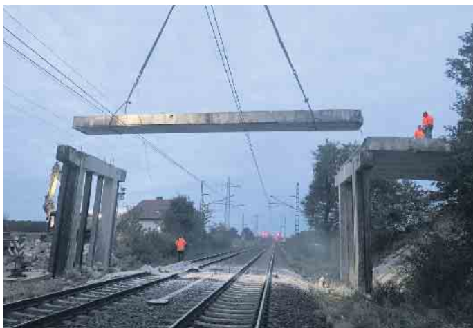
Die marode Brücke „In den Wiesen“ wurde Stück für Stück zurückgebaut. Während der Arbeiten ruhte der Bahnverkehr auf der Linie Bremen-Osnabrück für rund 50 Stunden.

nämlich gibt es erneut nächtliche Sperrpausen auf den Gleisen in Drohne. „Der Rückbau der Bahnbrücke ist inzwischen jedoch so weit fortgeschritten, dass wir die Sperrpause am 19. und 20. November wohl gar nicht mehr benötigen“, so Anja Bredemeier.