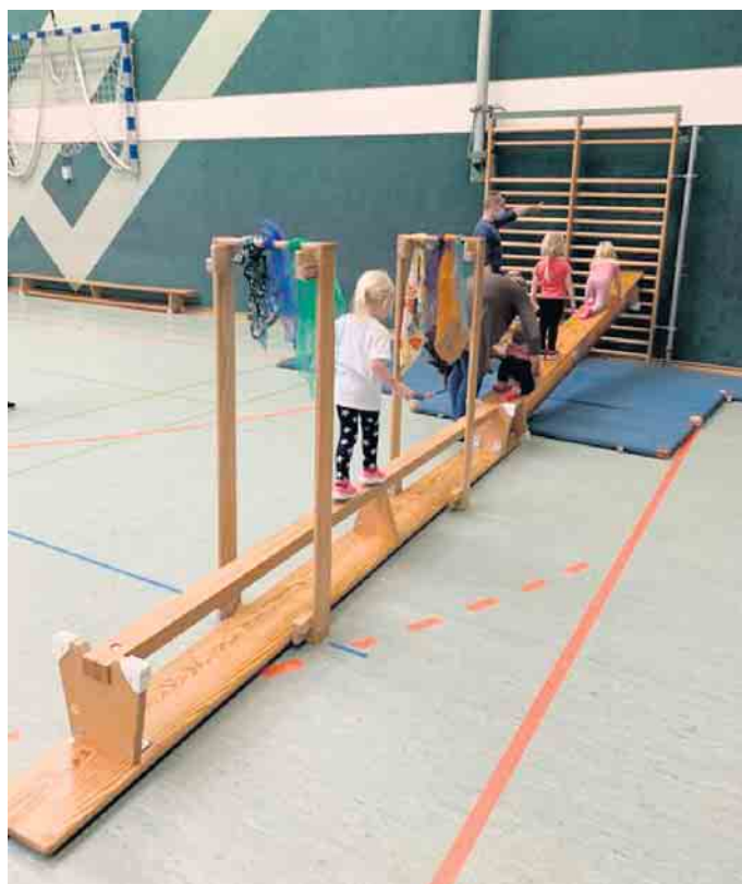
Viele interessante Angebote warten auf die Kids

Der Turnnachmittag findet wie folgt statt: Samstag, 19. November für alle Kinder von 5 bis 10 Jahren in der Zeit von 15 bis 17 Uhr in der Dielinger Zweifachsporthalle, Auf der Thüne 2, 32351 Stenwede. Mitzubringen sind Hallenturnschuhe oder Stoppersocken und Getränke. Dass keine Snacks/Getränke etc. angeboten werden, hat den Hintergrund, dass wir den Focus auf die Bewegung und den Spaß legen wollen. Natürlich darf und sollte jeder selbst sein Getränk mitbringen, denn Bewegung macht durstig. Die Übungsleiter des TuS Dielingen freuen sich auf viele Kinder, die gerne mal eine riesige Bewegungslandschaft mit geschulter Betreuung in der Turnhalle ausprobieren wollen. MD