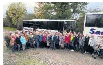
Die Reisegruppe der Landfrauen

Es gibt einiges neues zu entdecken. Dinge, die das Heim verschönern,