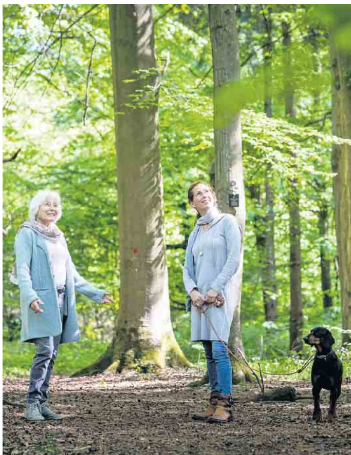
Viele Hinterbliebene lassen ihren Erinnerungen gern bei einem Spaziergang durch den Bestattungswald freien Lauf.

Zu besonderen Anlässen wie Jubiläen oder Geburtstagen wird schon einmal ein Glas Sekt am Baum des Verstorbenen getrunken oder ein kleines Picknick gemacht.