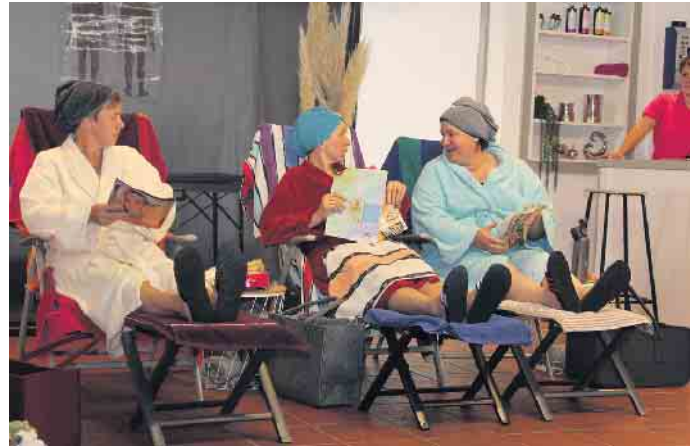
Die 3 Grazien machten den Lästerschwestern alle Ehre. Frivoles Treiben und deftige Sprüche: „De Sauna-Gigolo“