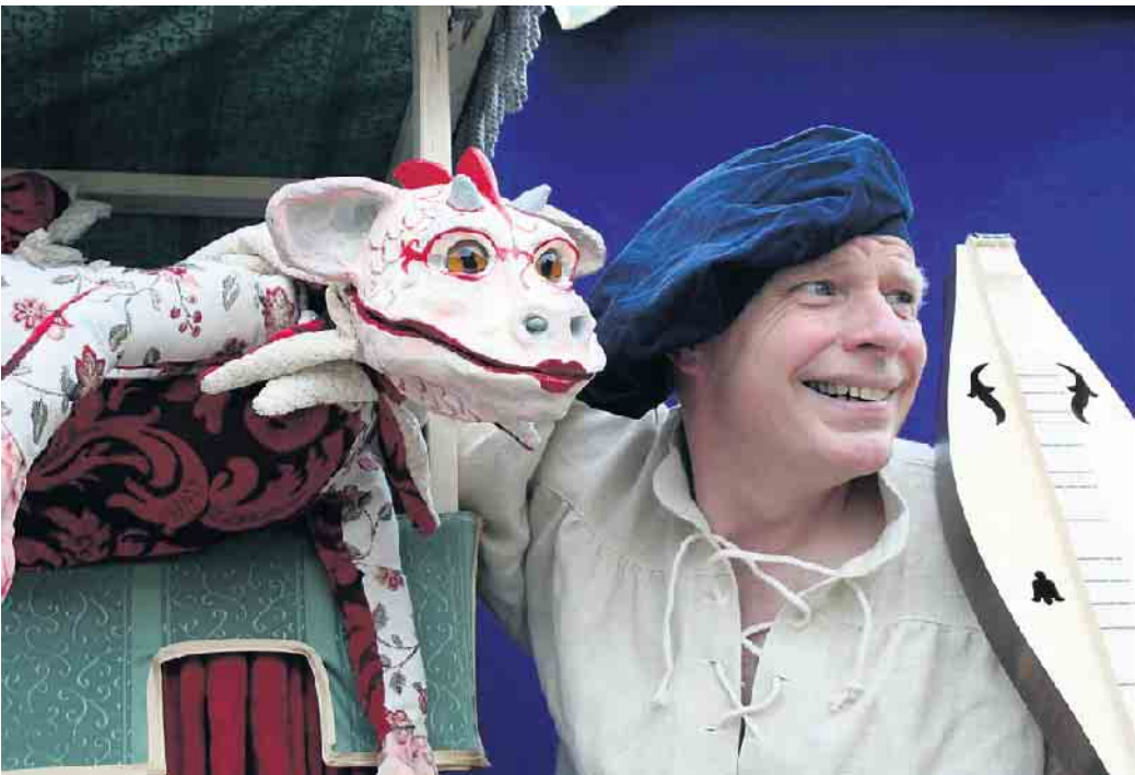
Ritterhelmpflicht mit drm Kindertheater „Töfte“

„Ritterhelmpflicht für kleine Drachen“ ist ein Kindertheaterstück für Knappen und Mägdelein ab 4 Jahren. Am Sonntag, 12. November, um 15 Uhr tritt das „Theater Töfte“ auf Einladung des JFK Stewwede mit dem Stück im Life House in Stewwede-Wehdm auf. Dieses Angebot wird parallel zum gleichzeitig in der Begegnungsstätte stattfindenden Bücherflohmarkt der Landfrauen angeboten. Damit haben die Eltern die Möglichkeit, in aller Ruhe nach Büchern zu stöbern, während die Kinder sich beim Kindertheater vergnügen. Die mutige Drachendame Lanze-lotte von Zackenschwanz hat sich in den Kopf gesetzt, zur Ritterin geschlagen zu werden. Da gibt es allerdings ein Problem: Sie hat