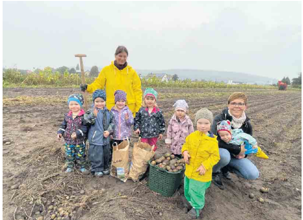
Die Erntehelfer nach getaner Arbeit

Wer auch bald zu den fleißigen Erntehelfern gehören möchte, darf gerne bis zum 30. November auf dem Anmeldeportal „Kivan“ des Kreises Minden Lübbecke ange-