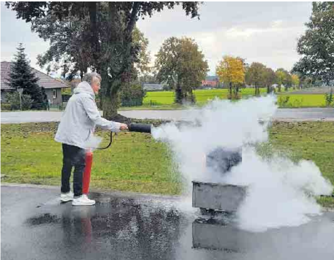
Auch praktische Erfahrungen konnten gesammelt werden

Hinterher konnten sich die Landfrauen bei einem Getränk und Bratwurst über die neuen Erfahrungen austauschen. Die nächsten Termine der Landfrauen Wehden sind das Pickertbacken am 14. November sowie die Fahrt zum Weihnachtsmarkt Hannover am 30. November.