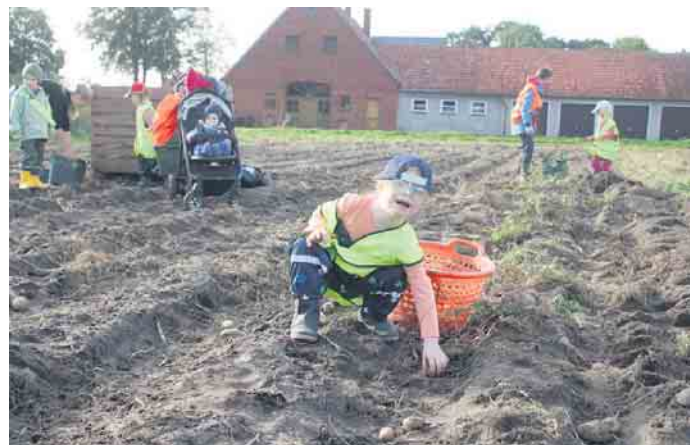
Voller Elan in die Furchen