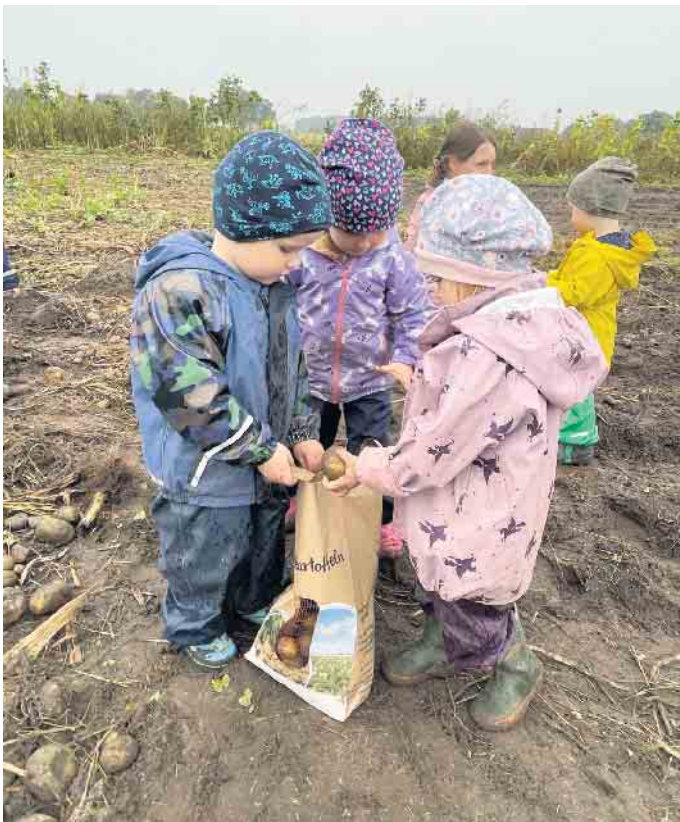
Halten die Kartoffeln der Überprüfung der „Kommission“ stand

meldet werden. Es betrifft das Kindergartenjahr vom 1. August 2024 bis 31. Juli 2025. Jeder ist willkommen, um sich in der Rappelkiste zu erkundigen!