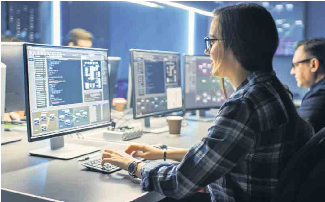
Die Absolventinnen und -absolventen des Studiengangs sollen Cybercrime-Angriffe frühzeitig erkennen und entsprechende Sicherheitsmaßnahmen planen und umsetzen können.

Rund 300 IT-Forensiker und Si-cherheitsexperten haben bereits ihren staatlichen Hochschulab-schluss gemacht. Insbesondere für IT-Fachkräfte bietet das Fern-studium die Möglichkeit, sich neben dem Beruf praxisnah und wis-senschaftsbasiert spezifisches Fachwissen anzueignen. Die an-gehenden IT-Sicherheitsexperten setzen sich vor allem mit dem technischen Vorgehen von Ha-ckern auseinander: Dem Daten-diebstahl von Smartphones und Tablets, dem Hacken persönlicher Profile in sozialen Netzwerken