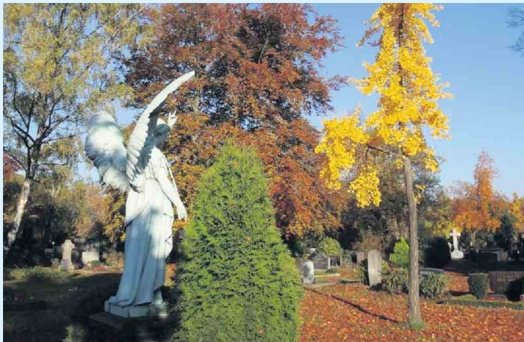
Die Totengedenktage im November bieten eine besondere Möglichkeit, uns an Verstorbene zu erinnern.

Los geht es gleich Anfang November mit Allerheiligen und Allerseele. Diese beiden Gedenktage werden von der Römisch-katholischen Kirche bereits seit dem 4. und 10. Jahrhundert begangen. Wird am 1. November in erster Linie den Heiligen gedacht, ist der 2. der Tag aller Verstorbenen. Die Friedhöfe besuchen die Menschen aber an beiden Daten besucht. Wurde früher vornehmlich Gebäck auf die Gräber gelegt, werden heute in erster Linie Kerzen und Grablichter aufgestellt - ein schöner Brauch in der dunklen Jahreszeit. Der nächste Gedenktag ist der Volkstrauertag. Er findet stets