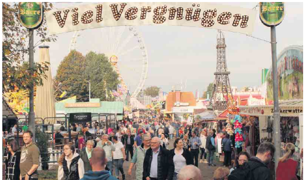
Der Vergnügungspark auf dem Brockumer Großmarkt lockte bereits am Sonnabend Tausende Besucher.

BROCKUM(hm). Der Brockumer Großmarkt im Herbst ist vielen Menschen im weiten Umkreis zu einer lieb gewonnenen Veranstaltung geworden. Am Wochenende ist in dem kleinen niedersächsischen Dorf am Fuße des Stembweder Berges nach zweijähriger Corona-Pause einmal mehr die „fünfte Jahreszeit“ angebrochen. Bei allerbestem Herbstwetter genossen Tausende Besucher am Wochenende das bunte Treiben. Sowieso ist es die attraktive Mischung aus Nervenkitzel und Vergnügen, Informationen und Musik, Sehenswertem und Kuriosum, Gaumenfreuden, Antikem und Modernem, Innovativem und Bewährtem, die den Reiz des Spektakels ausmacht. Für Hiesige übrigens ein Muss, dreimal täglich über den Großmarkt zu schlendern, in diesem Jahr bereits in der mindestens 462. Auflage.