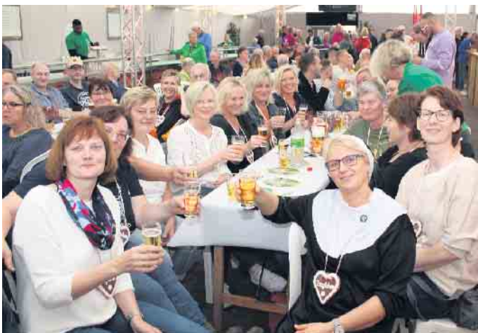
Gut gelaunt feierten die Stembweder Frauen bei der Eröffnung des Brockumer Marktes im Festzelt.