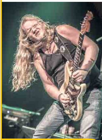
JOOST DE LANGE & THE ROCK/BLUES EXPERIENCE –