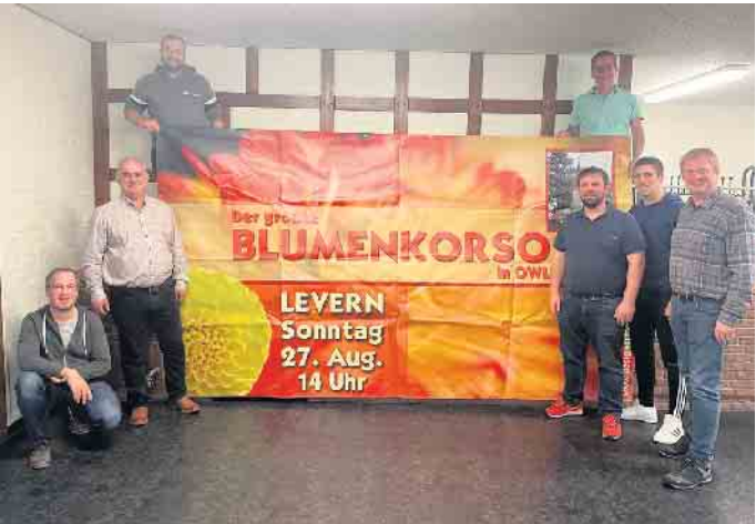
Vorstand und Könige des SV Levern

auch neue Teilnehmer gewinnen zu können. Daher möchten wir hiermit auch alle Interessierten einladen, die vielleicht mit einem bunt geschmückten Wagen oder einer Tanz- und, oder Musikgruppe oder ähnlichem am Umzug teilnehmen wollen, einen oder mehrere Vertreter ihrer Gruppe zu diesem Treffen am 18. November um 19.30 Uhr in die Schützenhalle in Levern zu schicken. Und für alle, die Angst vorm Aufbau der Blüten haben, diese müssen nicht selbst gezeichnet werden sondern werden vom Verein nach Bedarf besorgt.