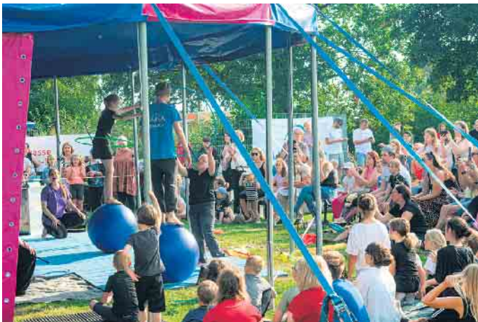
Die jungen Artistinnen und Artisten vom Jugendzirkus „Artistikka“ aus Damme zeigen den Gästen, was sie können.