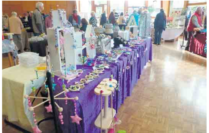
Am 26. Oktober findet in der Begegnungsstätte Wehden und umzu zum fünften Mal der Kunsthandwerkermarkt „STiK - Stewede ist kreativ“ statt.