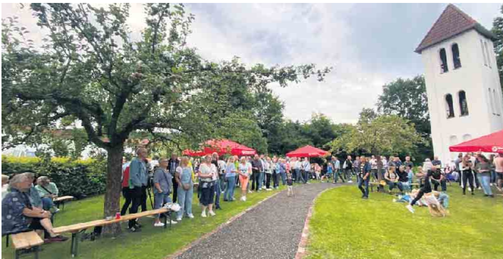
Das traditionelle Dorffest „Rock am Turm“ wurde von den Westruper Workshop-Teilnehmern besonders gelobt.