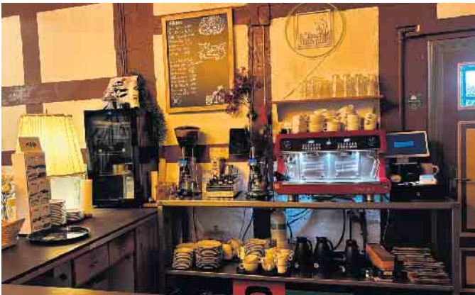
Kaffeeliebhabern wird im Lukas Hofcafé feinsten Bio-Kaffee der Rösterei Azul aus Bremen serviert - handgeröstet, regional und aromatisch.