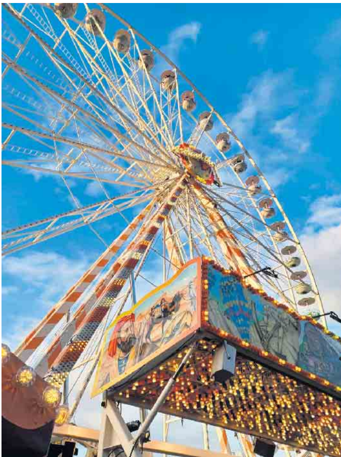
Das Riesenrad ist nicht nur das Wahrzeichen des Brockumer Marktes, sondern auch seit jeher ein beliebter Treffpunkt und schon bei der Anfahrt vom Auto oder Bus aus zu sehen.