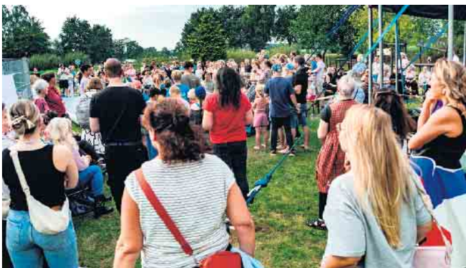
Viel Betrieb auf der Wiese hinterm Haus: Mehrere hundert Gäste waren zum Jubiläumsfest auf das Gelände des Kinderhauses am Ortsrand von Dielingen gekommen.

Ich weiß noch genau, wie ich mich damals fühlte: allein... einsam... fremd... verletzt. Die anderen Kinder waren neugierig, offen, sie waren schon angekommen.