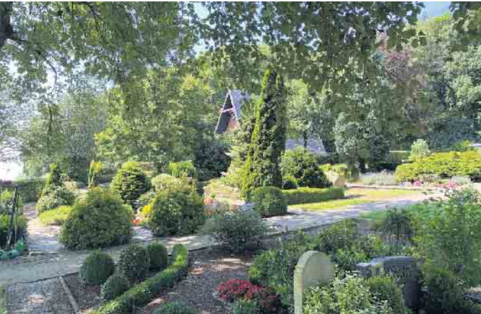
Am Friedhof in Arrenkamp geht es los. In der Friedhofskapelle findet am 22. Oktober die erste öffentliche Infoveranstaltung statt.

Ab dem 22. Oktober gibt es wöchentlich öffentliche Infoveranstaltungen: Bürgerbeteiligung zur klimafreundlichen Neugestaltung startet