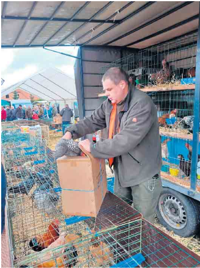
Das Beste kommt auf dem Brockumer Markt wie immer zum Schluss. Am Dienstag mischen der Viehmarkt und die Tierschau das Marktgeschehen ordentlich auf.

Alles in allem eine große Mixtur aus Nervenkitzel und Vergnügen, aus Informationen und Musik, aus Sehenswertem und Gaumenfreuden, aus Innovativem und Bewährtem. Echte Tradition mit dem guten Gespür für was Neues. Mit regional und überregional gestreuter Werbung, neuen