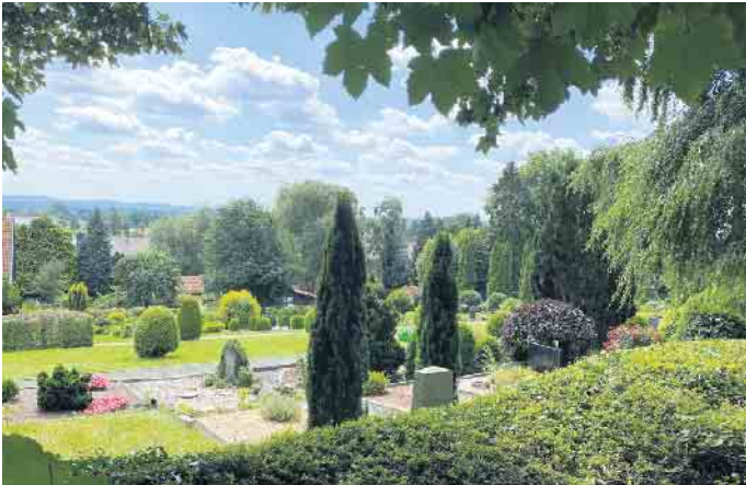
Die Stemweder Friedhöfe (hier zu sehen Wehden) haben allesamt eine lange Tradition und sind wichtige Bestandteile der dörflichen Kultur. Die Gemeinde will die gemeindlichen Friedhofsflächen nun unter Aspekten des Klimaschutzes aufwerten.

Höhe von rund 2,1 Millionen Euro aus dem bundesweiten Aktionsprogramm „Natürlicher Klimaschutz in kommunalen Gebieten im ländlichen Raum“ zur Verfügung. Die Beteiligung der Öffentlichkeit ist dabei ausdrücklich erwünscht. „Unsere Friedhöfe sind Orte der Erinnerung, der Begegnung und der Kultur“, betont Bürgermeister Kai Abruzat. „Gleichzeitig stehen sie - wie viele andere Bereiche der kommunalen Infrastruktur - vor einem Wandel. Immer mehr Menschen wünschen sich alternative Bestattungsformen, pflegeleichte Grabstellen und naturnahe Anlagen.