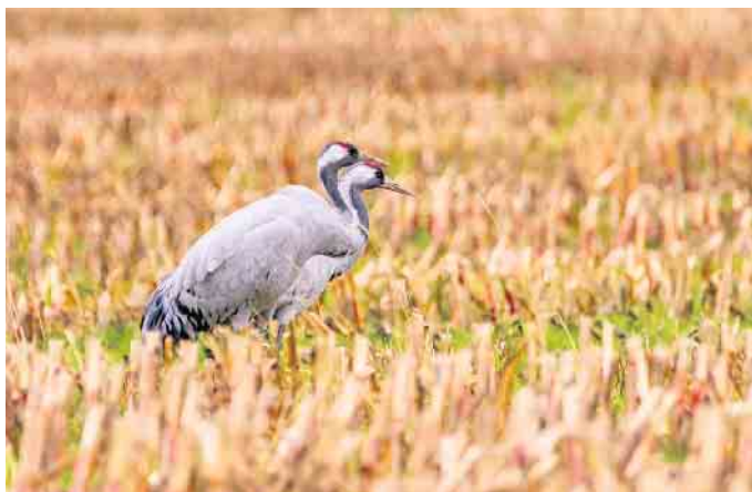
Zwei Kraniche auf einem abgeernteten Maisacker.