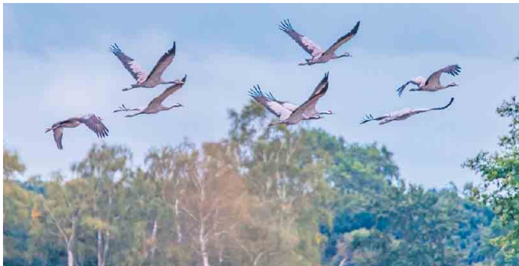
Kraniche im Flug.

Mo. bis Fr. 10 bis 12:30 und 13 bis 16 Uhr, Sa. 10 bis 14 Uhr