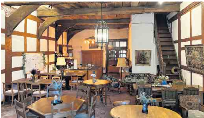
Historisches Kleinod und überaus gemütlich: Das Dielencafé in einem alten Fachwerkgebäude bietet nicht nur Schutz bei schlechtem Wetter, sondern auch viele spannende Details aus längst vergangenen Tagen zu entdecken.

Lukas Hofcafé in Húde bietet leckeres Frühstück, selbstgebackene Kuchen, Bio-Kaffee und ein historisch-rustikales Wohlfühl-Ambiente