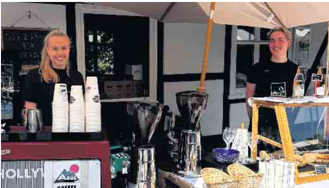
Das Service-Team von Lukas Hofcafé in Húde verwöhnt die Gäste gerne mit einem leckeren Frühstück am Morgen oder selbstgebackenen Kuchen und Torten am Nachmittag.

Brot. Dazu servieren wir Ihnen feinsten Bio-Kaffee der Rösterei Azul aus Bremen - handgeröstet, regional und aromatisch, ein echter Genuss für Kaffeeliebhaber. Am Nachmittag laden wir zu einer feinen Auswahl an selbstgebackenen Kuchen und Torten ein. Besonders beliebt: unsere hausgemachten Dinkelwaffeln, frisch und goldbraun serviert. Wer es lieber herzhaft mag, freut sich über frisch belegte Fischbrötchen, Pommes und weitere kleine Leckereien. Unser Hofcafé bietet außerdem den passenden Rahmen für Familienfeiern, Trauerfeiern, Kaffeekränzchen oder gemütliche Zusammentreffen - alles in stimmungsvoller, ländlicher Atmosphäre. Schauen Sie vorbei, lassen Sie sich verwöhnen und genießen Sie entspannte Stunden - wir freuen uns auf Sie!“ Zum Ambiente: Bei schlechtem Wetter wird es beim Lukas Hofcafé erst so richtig gemütlich. Eine alte Fachwerkdiele bietet als „Dielencafé“ nicht nur Schutz vor Regen und Kälte, sondern auch eine kleine Reise in die bäuerliche Vergangenheit. Die originalgetreue Einrichtung versprüht rustikalen Charme und in fast jeder Ecke lässt sich ein weiteres spannendes Detail entdecken. Ein historisches Kleinod, das für Besucher absolut sehenswert ist und eine Wohlfühl-Umgebung, in der die regionalen Leckereien gleich doppelt so gut schmecken. Reservierungen unter Telefon: 0160 3519363