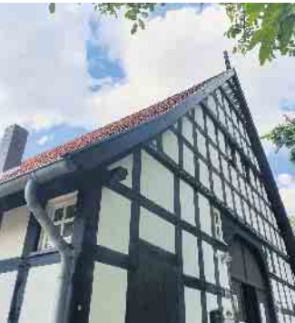
Heimathaus Wehdem.

Das Heimathaus Wehdem öffnet am 12. Oktober, von 14:30 bis 18 Uhr, das letzte Mal in diesem Jahr seine Türen. Zum Saisonabschluss präsentiert das Heimathaus seine Dauerausstellung vor der Winterpause. Es werden kostenlose Führungen durch die Ausstellung angeboten.