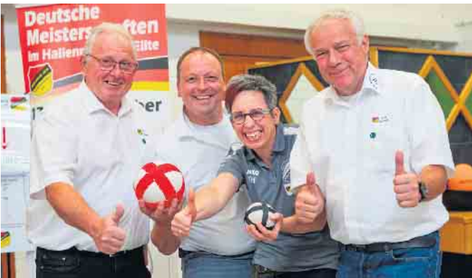
Der RSC Niedermehren nutzt auf dem Stenweder Marktes die Gelegenheit, um auf die Deutschen Meisterschaften im Hallenrad sport Elite 2025 in Lübbecke hinzuweisen. Der RSC Niedermehren ist Ausrichter des sportlichen Groß-Events.

ren die Europameisterinnen vom RV Mainz-Ebersheim das Ranking an. Weiter geht es beim Deutschland Cup in Fürstenwalde, wo neben Mainz-Ebersheim auch der RMSV Aach mit zwei Vierer-Teams, der RV „Vorwärts“ Neuenkirchen sowie der RSV Steinhöring um die nächsten Qualifikationspunkte fahren.