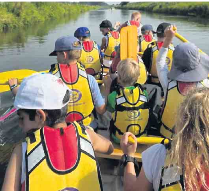
Ferienspiele in Stemwede