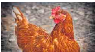
Am 11. und 12. Oktober findet die 98. Ortsschau des Rassegeflügelzuchtvereins Oppenwehe in der Ausstellungshalle des Vereinsheimes statt. (Symbolfoto)

se des im Vorfeld durchgeführten Malwettbewerbes überreicht. Der Sonntagmorgen beginnt um 10 Uhr mit dem traditionellen Frühschoppen, in dessen Rahmen die Siegerehrung vorgenommen wird und einige Auszeichnungen und Ehrungen verliehen werden. Für das leibliche Wohl der Besucher und Gäste wird gesorgt.