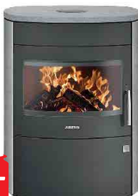
Justus Usedom 7 Speckstein 7 kW