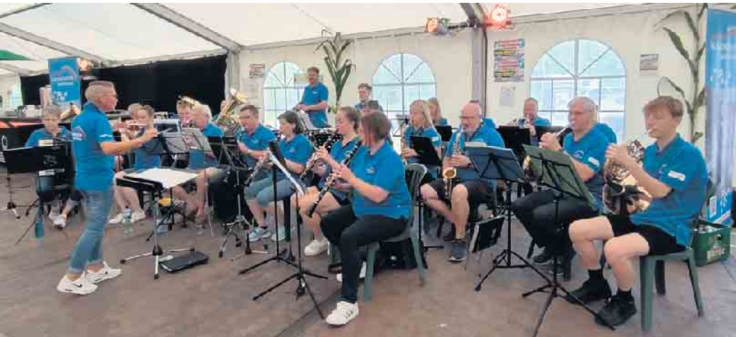
Gab den Takt an: Das Blasorchester Bad Holzhausen lieferte traditionelle Klänge zur Markteröffnung mit Fassbieranstich im großen Festzelt.

Das kann sich sehen lassen: 60 Aussteller haben auf der Gewerbeschau des Stewweder Marktes in Levern gezeigt, was die heimische Wirtschaft zu bieten hat.