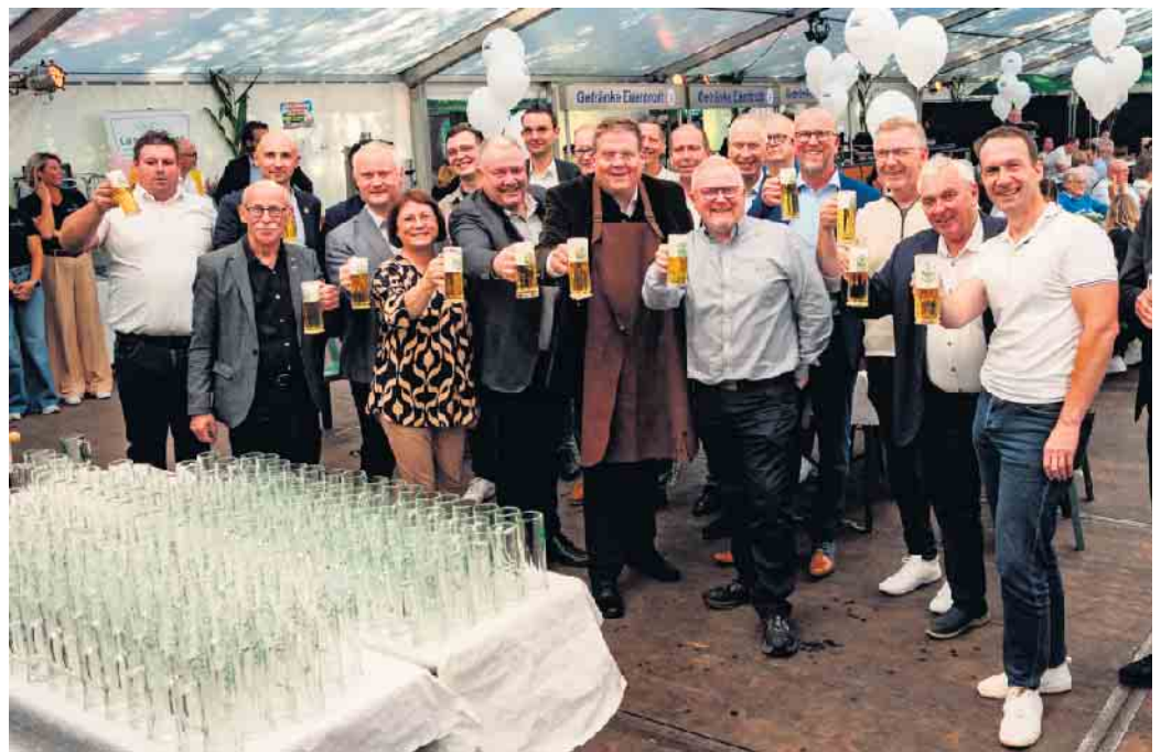
Stemweder Markt 2025 - Gruppenbild mit Dame! Mit zwei Fass Freibier haben die Festgäste ihre Gläser auf eine gelungene Veranstaltung erhoben.

Und so durften althergebrachte Rituale wie der klassische Fassbieranstich auch bei der offiziellen Eröffnung natürlich nicht fehlen. Im Falle des Stemweder Marktes übrigens sogar mit zwei Fass