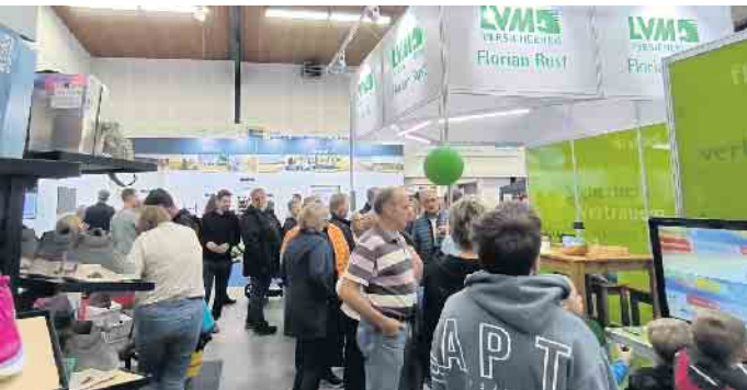
Am Stand der LVM Rust gab es viele interessante Informationen und immer wieder reichlichen Besucherandrang zu entdecken.

me offenbar „zu gut“ gewesen war, zog es dafür am Sonntag hunderte Stewwederrinnen und Stewweder auf die Gewerbeschau, wo es dann auch zu vielen guten Gesprächen und erfolgreichen Einkaufserlebnissen kam. Man war sich einig: Das kann sich sehen lassen!