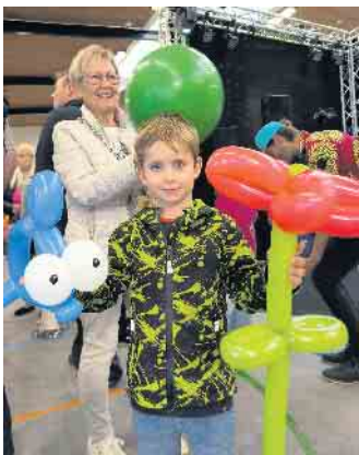
Die Werke eines extra für die Gewerbeschau engagierten Luftballonkünstlers zauberten den kleinen Besuchern ein Leuchten in die Augen.

„Die Gewerbeschau ist ein Schaufenster für Qualität, Vielfalt und Innovationskraft“, lobte Kai Abruszat. Und auch die Aussteller selbst zeigten sich am späten Sonntagnachmittag zufrieden. Nachdem am Samstag bei hochsommerlichen Temperaturen das Wetter für große Besucherströ-