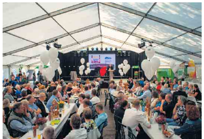
„Ein Markt, der mit Menschen wirbt, die etwas auf die Beine stellen“: Zur Markteröffnung grüßte der Bürgermeister die örtliche Unternehmerschaft mit zuversichtlichen Worten.