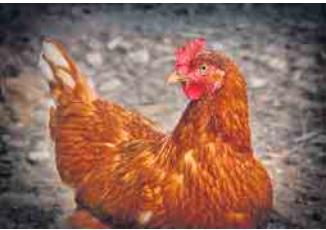
Am 11. und 12. Oktober findet die 98. Ortsschau des Rassegeflügelzuchtvereins Oppenwehe in der Ausstellungshalle des Vereinsheimes statt. (Symbolfoto)

270 Enten, Hühner, Zwerghühner, Tauben und Ziergeflügel geben umfassenden Einblick in die Vielfalt der Rassegeflügelzucht