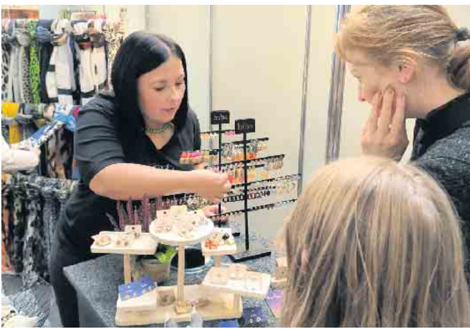
Fotografin Marina Ziegler warb auch für Schmuck und schöne Dinge.