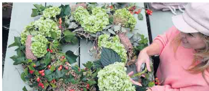
Mit Efeu, Eukalyptus, ein paar Zweigen mit roten Früchten und Hortensienolden lässt sich ein natürlich-schöner Türkranz zaubern.