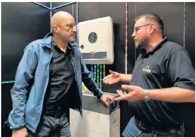
Vertieft ins Fachgespräch: Die Hilker Solar mit Sitz in Rahden bietet eine Vielzahl von Dienstleistungen in der Photovoltaikbranche an.