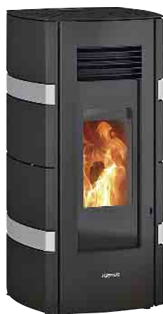
Justus Pelletofen Sia weiss 8 kW