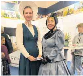
Hoher Besuch aus der Vergangenheit: Beim Stemweder Markt schauten sogar die historischen Stiftsdamen gerne neugierig vorbei.