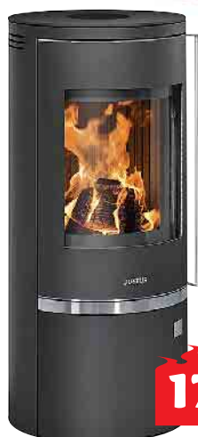
Justus Faro Top Stahl 6 kW