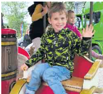
Ein nostalgisches kleines Kinderkarussell lockte die kleinen Marktbesucher am Sonntagnachmittag an.