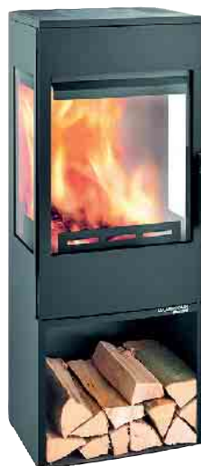
Haas + Sohn Salzburg 7 kW