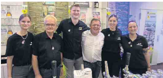
Fröhlich und gut gelaunt ging es beim Team vom E-Center Hartmann zu, das während der Markttagge in der kleinen Festhalle für die Getränke sorgte.