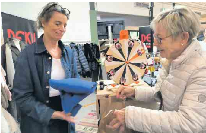
Neue Lieblingsteile und tolle Markt-Rabatte gab es beim Stand der „DEKU Modewelt“ zu ergattern.