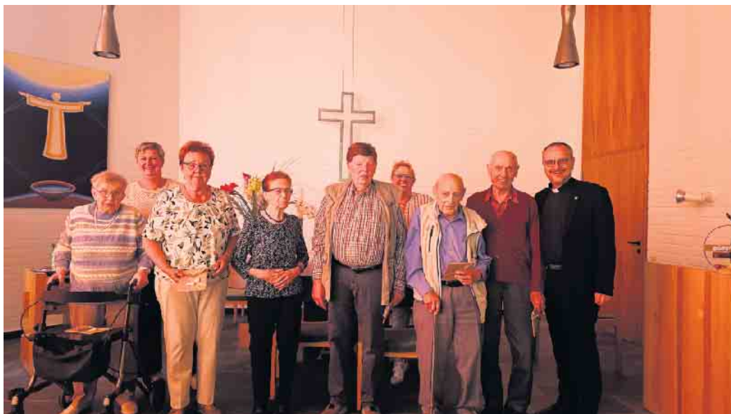
Die geehrten Jubilarinnen und Jubilare.

Geburtstagskaffeetrinken für die Seniorinnen und Senioren des ersten Pfarrbezirks der Kirchengemeinde Dielingen