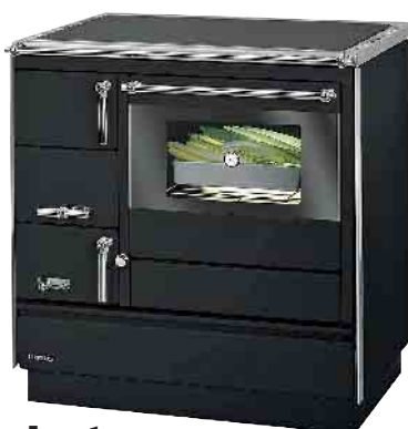
Justus Kochmaschine Linz 7 kW