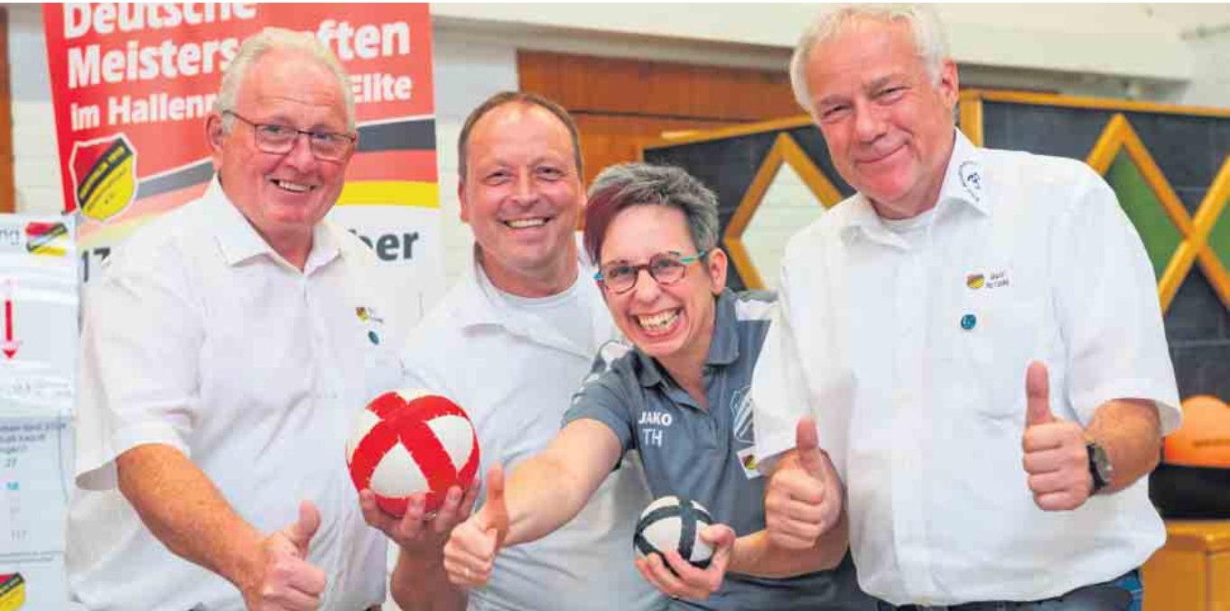
Der RSC Niedermehren war bei der Gewerbeschau des Stenweder Marktes dabei und nutzte die Gelegenheit, um auf die Deutschen Meisterschaften im Hallenradsport Elite 2025 in Lübbecke hinzuweisen.