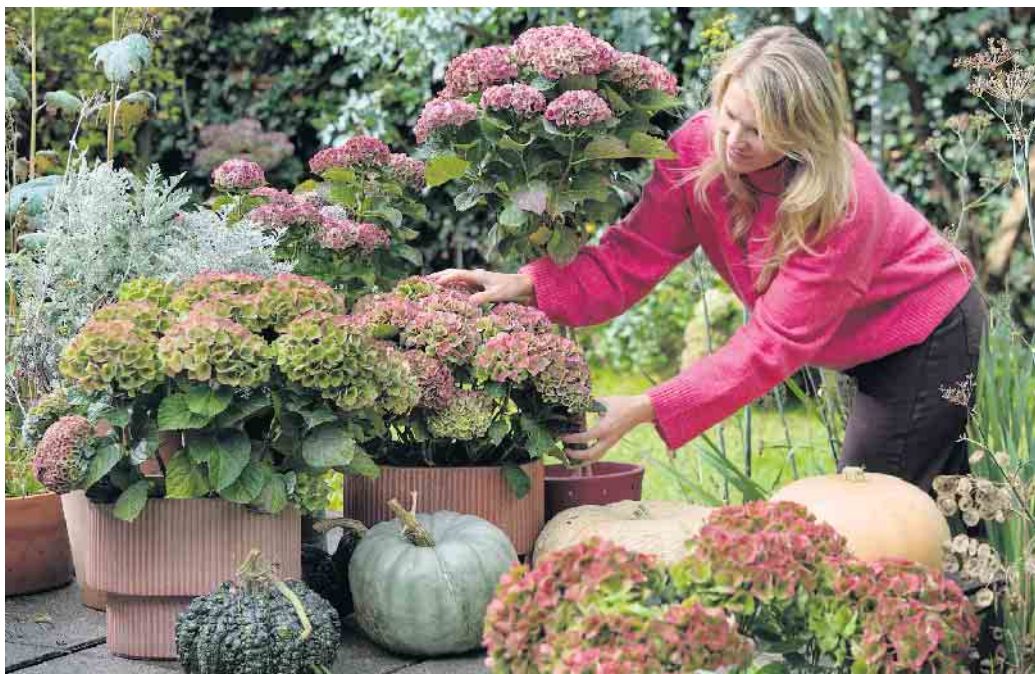
Auf der Terrasse oder vor dem Hauseingang machen sich Hortensien in Töpfen gut, kombiniert mit verschiedenen farbigen Kürbissen.

Auch die eigenen Vierwände dekorieren die Menschen hinsichtlich des Erntedankfests - um den Herbst mit all seiner Fülle zu genießen. Kürbisse sind nun Verkaufsschlager. Sie werden vor den