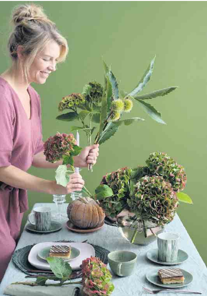
Für die Erntedanktafel kann man aus der Fülle der Natur schöpfen: Esskastanienzweige und Hortensien machen sich wunderbar zusammen in einer Vase. Der herbstliche Kürbis wirkt zwischen dem eleganten Geschirr wie ein Kunstwerk.

Jahr an - unter den alten Dolden, die wiederum als Schutz gegen Frost dienen. Daher ist es wichtig, bewusst Zweige auszuwählen, die im hinteren Bereich und nicht zu nah beieinander liegen - um die Gefahr zu minimieren, im kommenden Sommer eine unschöne Lücke in der Hortensie zu haben. Ein Jahr später wird sie sich aber bereits wieder gefüllt haben - also keine Sorge!