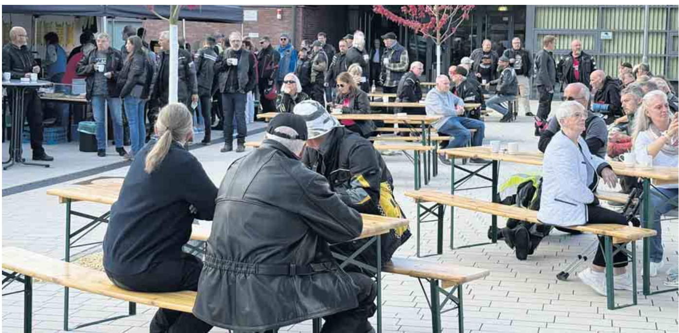
Das Bikertreffen am Life House ist auch ein lebendiges Fest mit Livemusik, leckeren Snack und heißem Kaffee.

bestimmt gut investiert.“ Doch das Treffen ist weit mehr als Fachsimpelei unter Gleichgesinn- ten. Es ist ein lebendiges Fest mit rhythmischem Knattern von Kolonnenfahrten, dazu Livemusik, der Duft von frischem Kaffee und Snacks und das herzliche Lachen der Szene. Jung und Alt, Lederja- cke oder Jeans - hier zählt nur die gemeinsame Leidenschaft fürs Motorrad.