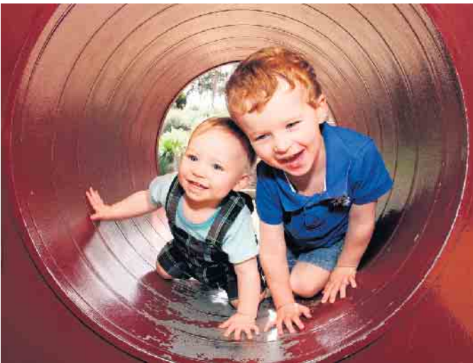
Spielstraße, Wettkämpfe und vieles mehr: Draußen auf der großen Wiese am Gemeindezentrum in Haldem ist für jedes Kind etwas Passendes dabei (Symbolfoto).

CVJM Dielingen-Haldem e.V. lädt für diesen Sonntag zum traditionellen Familienfest am Gemeindezentrum in Haldem ein