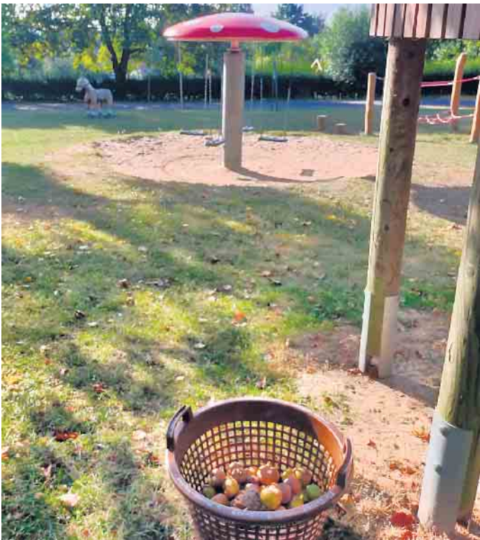
Die Idee funktioniert: In den aufgestellten Körben ist bereits einiges an Fallobst drin.

Gelände sauber halten und Stolperfallen vermeiden: auf dem Westruper Spielplatz am Freudeneck stehen jetzt Körbe für Fallobst bereit