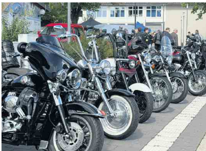
Fachsimpelei unter Gleichgesinnten: Benzingespräche gab es zuhauf beim 19. Bikertreffen am Wehdemer Life House.