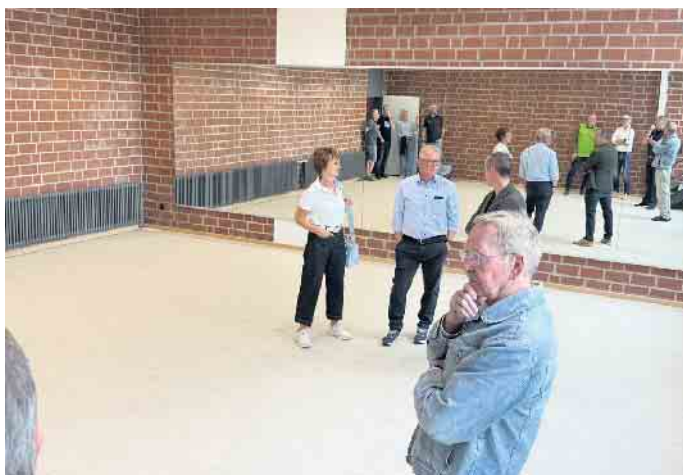
Mit großen Spiegeln ist der neue Gymnastikraum versehen.