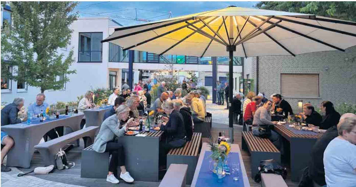
Im stimmungsvollen Innenhof der Firma Depenbrock klang der Abend in lockerer Atmosphäre aus. Bei guten Gesprächen und leckerem Essen nutzten die Mitglieder des Gewerbevereins die Gelegenheit zum Netzwerken.