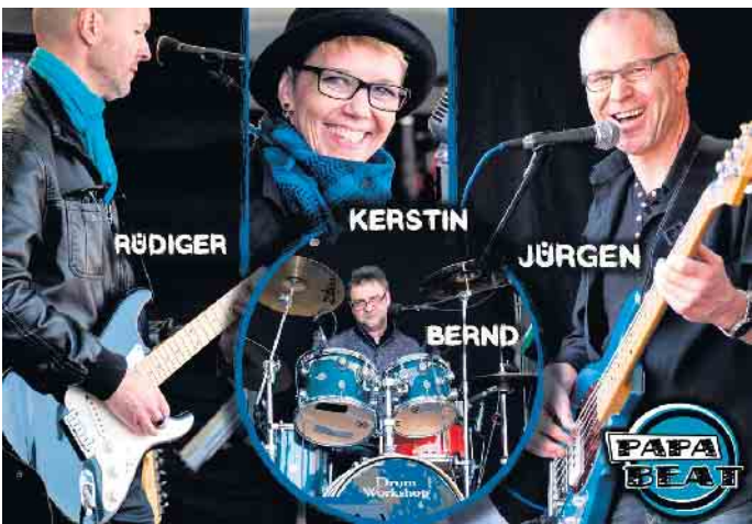
Die vier Bühnenerfahrenen Musiker der Oldie-Band Papa Beat bieten handgemachte Kultsongs der 60er, 70er und 80er Jahre.

Dazu kommen Rock-Kracher von ZZ Top oder Gary Moore. Puristisch, dynamisch, druckvoll! Bob Seegers „Old Time Rock’n’Roll“