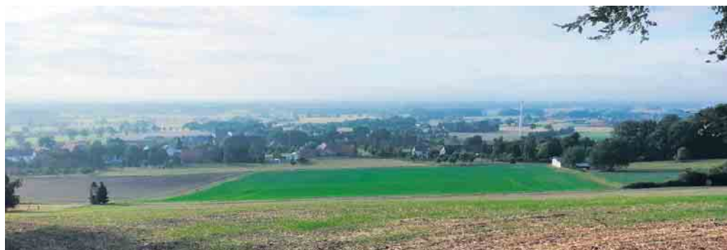
Ein gewohntes Bild für alle Westrufer: Von der „Opa Fritz“-Bank am Waldrand eröffnet sich ein wunderschöner Blick aufs Dorf und das Wiehengebirge.

Westrup, ein traditionsreicher Ortsteil der Gemeinde Stemmwedde, liegt idyllisch am Südhang der Stemmwedder Berge. Mit