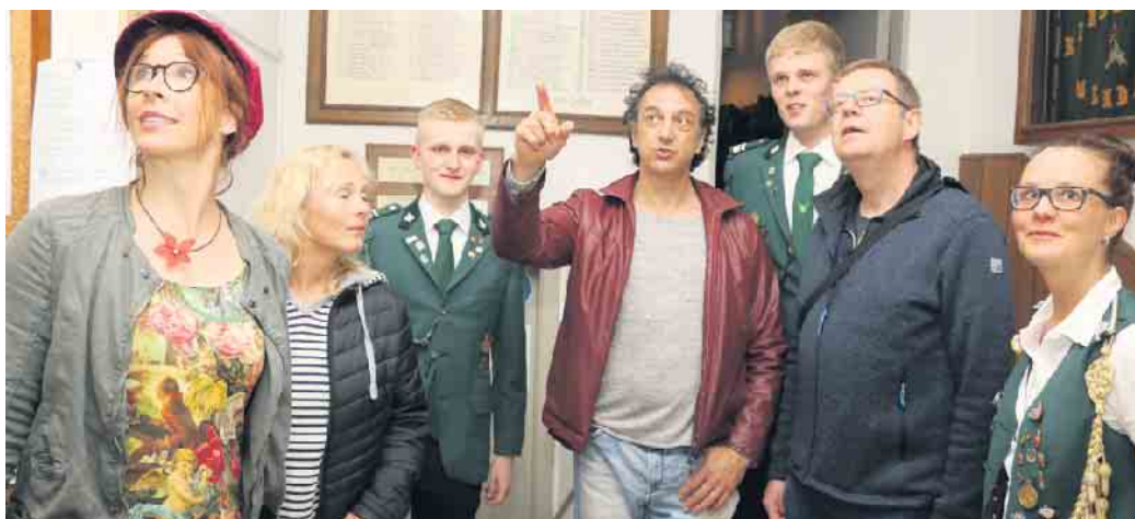
An 14 Drehtagen, an über 40 Schauplätzen in Wehdem und Umgebung ist mit über 300 Darstellern ein liebenswertes „Gesamtkunstwerk“ entstanden.