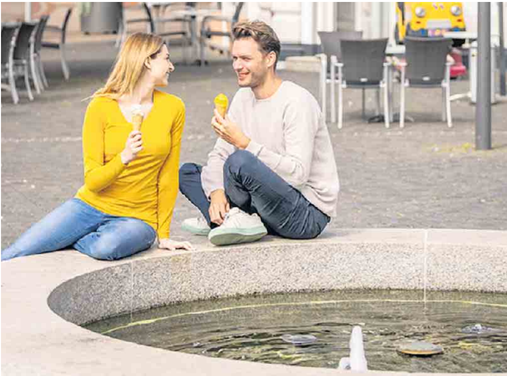
Bei einem herbstlichen Stadtbummel und hoffentlich guten Wetter schmeckt das Eis besonders gut.

Die Veranstalter - der Gewerbebund Rahden in Kooperation mit der Firma Krencky - hoffen auf gutes Wetter und zahlreiche Besucher an beiden Tagen.