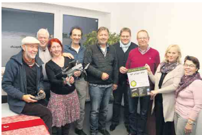
Im Jahre 2019 hat der Verein Leben in Wehdem e.V. anlässlich der 1050-Jahre-Jubiläumsfeier einen Film gedreht: den Wehdem-Krimi.

Am 26. September haben alle Steweder die Gelegenheit, die witzigen Filmszenen noch einmal auf großer Leinwand zu erleben