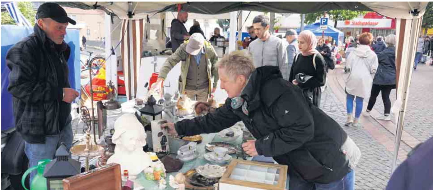
Das umfangreiche Angebot der Händler lädt an beiden Tagen zum Schauen und Bummeln ein und wird kaum Wünsche offenlassen. Nahezu alles, was das Sammlerherz begehrt oder im Haushalt noch fehlt, ist hier zu finden.

Besucher können in der Innenstadt nicht nur trödeln, sondern auch die „Schnäppchen“ der Rahdener Einzelhändler ergattern