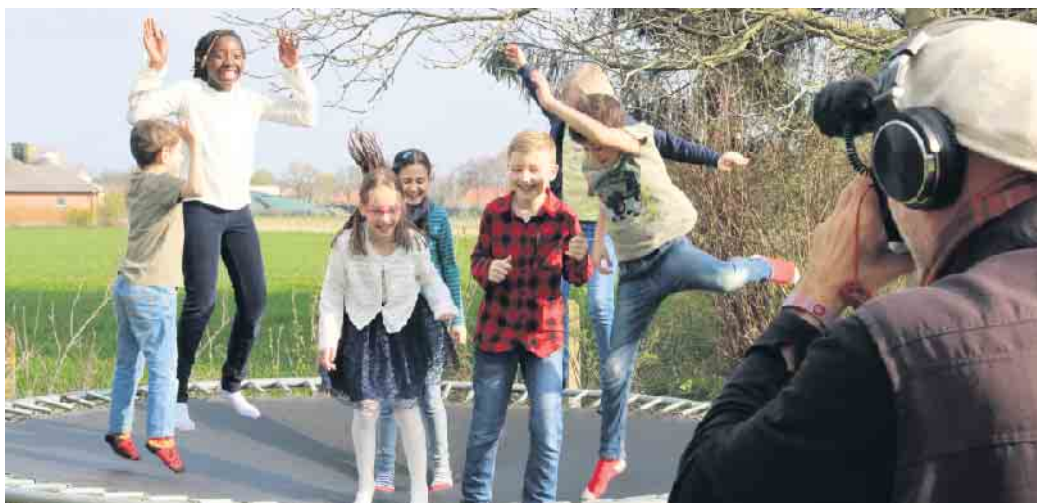
Wer erinnert sich noch an die Dreharbeiten bei Wind und Wetter und war selbst als Darsteller dabei? Der Verein Leben in Wehdem freut sich auf viele Gäste zur Kinovorführung.

Wehdem / Quernheim. Im Jahre 2019 hat der Verein Leben in Wehdem e.V. anlässlich der 1050-Jahre-Jubiläumsfeier einen Film gedreht: den Wehdem-Krimi.