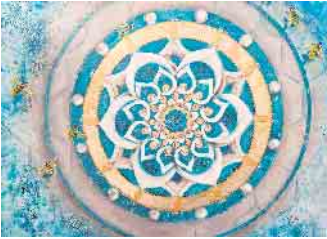
Mandala mit Acrylfarben

Der JFK Stewede bietet einen Kurs an. Er bietet die Möglichkeit die Malerei mit Acrylfarben kennenzulernen. Jeder kann Motive nach eigenem Wunsch auswählen.