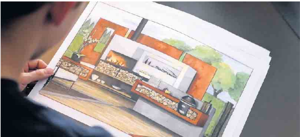
Als Ofen- und Luftheizungsbauer baut man nicht nur Öfen, sondern übernimmt auch handwerkliche Arbeiten eines Maurers, Schweißers, Dachdeckers, Malers, Gas- und Wasser-Installateurs sowie

Halbjahr stehen sechs Wochen Berufsschule und eine Woche überbetriebliche Ausbildung auf dem Programm. Eine Verkürzung der Ausbildung ist möglich. Nach der Gesellenprüfung stehen viele Türen offen: Ofen- und Luftheizungsbauer arbeiten sowohl für Industriebetriebe, die Öfen in Serie herstellen, als auch in Kleinbetrieben, die Kachelöfen individuell nach Kundenwünschen errichten. Mit etwas Berufserfahrung kann man seinen Meister machen, Fach- und Führungsaufgaben übernehmen und im Betrieb aufsteigen. Oder man wagt mit dem Meistertitel die Selbstständigkeit. Eine Weiterbildung als Techniker in der Fachrichtung Heizungs-, Lüftungs-, Klimatechnik ist ebenso möglich. Und ein nachfolgendes Bachelor-Studium im Studienfach Versorgungstechnik eröffnet weitere Karrierechancen. Einen #ofenhelden Infotalk findet man kostenfrei unter https://wir-sind.ofenhelden.info . Ofenbauer informieren hier über ihren abwechslungsreichen Beruf. Wer ihn kennenlernen möchte, sollte sich nach einem ein- oder mehrwöchigen Praktikum bei einem Ofenbauerbetrieb in der Nähe erkundigen, unter www.ofenhelden.info gibt es dazu mehr Informationen. (DJD)