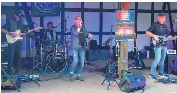
„Papa Beat“ zeigte sich in Bestform und begeisterte die Fans auf dem Mühlengelände.

in Bestform. Songs, wie „Green River“ von CCR, „Jumping Jack Flash“ von den Rolling Stones, „Born to be wild“ von Steppenwolf oder „Allright now“ von Free brachten die Tanzfläche zum Beben und die Gäste zum Johlen. „Die Menschen haben richtig Spaß bei der guten Musik“, freute sich Oppenwehes Ortsheimatpfleger Dirk Priesmeier. Er schätzte, dass wohl annähernd 300 Menschen aller Generationen gekommen waren und bei besten sommerlichen Wettervoraussetzungen ausgelassen unter freiem Himmel auf dem Mühlengelände feierten.