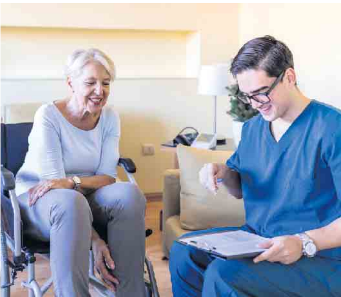
Ein Pflegeberuf bringt viel Kontakt mit anderen Menschen mit sich.