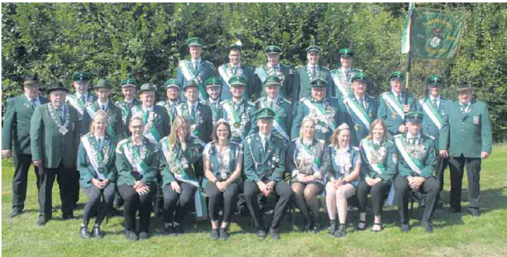
Die Jungschützenkönige 2024.