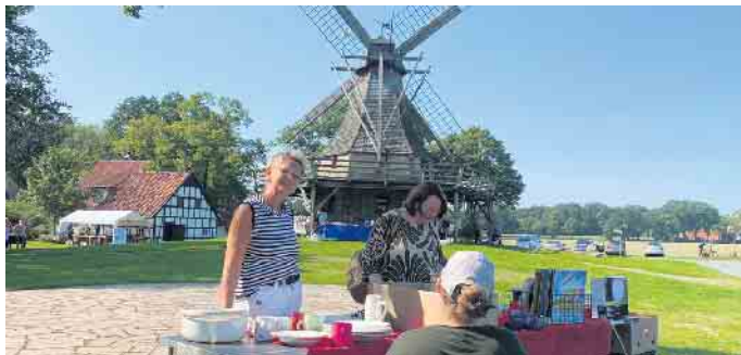
Unter Mühlenflügeln machte der Handel beim Flohmarkt besonderen Spaß.

Unter der Galerie an der Mühle hatten Kunsthandwerker ihre Stände aufgebaut, boten handgefertigte Schmuckarbeiten, Honig und individuelle Handarbeiten an. Außerdem sorgte ein Flohmarkt auf dem Mühlengelände für regen Handel unter freiem Himmel.