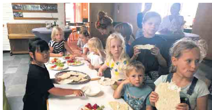
Leckere Matzen mit Quark und Obst