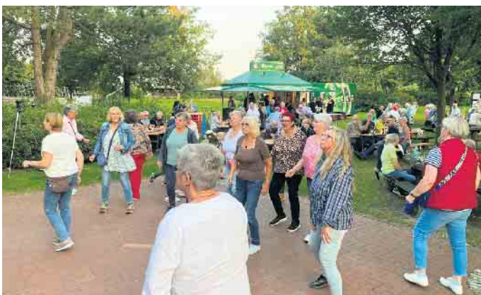
Die Tanzfläche war stets gut gefüllt.