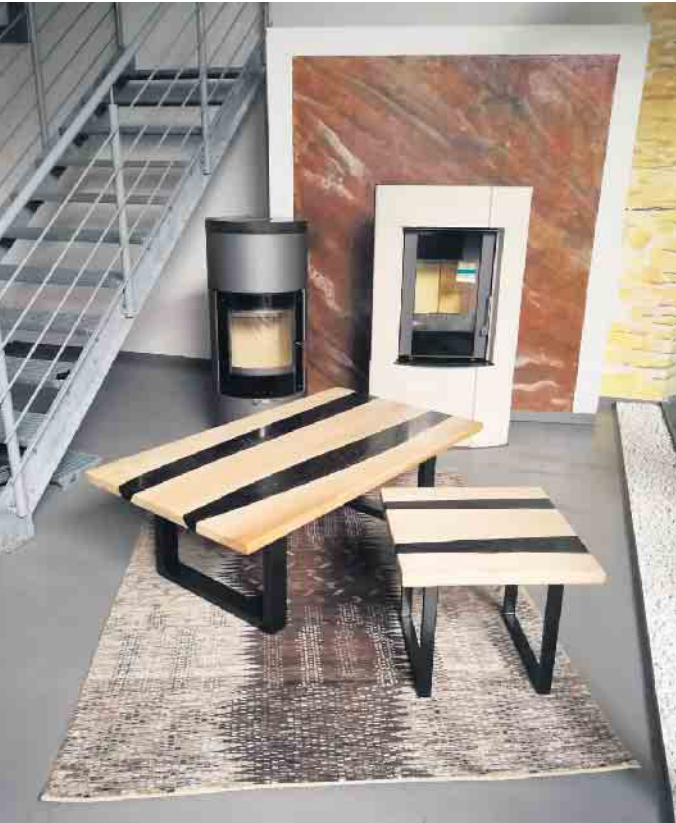
„TreLi Treppen“ ist auch im Bereich Epoxidholzarbeiten wie Flusstische, Uhren, Servier- und Schneidebretter sowie Geschenkartikel tätig.

der Optik zu gewährleisten. Wer sich selbst von der Vielfalt des Angebots überzeugen möchte, kann nach vorheriger telefonischer Absprache das Treppenstudio von TreLi besuchen, Telefon 05773 9119797. Weitere Anlaufstellen für einen persönlichen Kontakt sind der Pönmärkt in Hunteburg vom 11. bis 13. Oktober und der Brockumer Großmarkt vom 26. bis 29. Oktober im Gewerbezelt. „Wir freuen uns auf Ihren Besuch!“, lädt der Meisterbetrieb alle Interessierten recht herzlich ein.