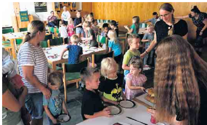
Andrang bei der Frühstücksausgabe

Neben bekannten Kinderkirchen-Schlagnern lernten die Besucherinnen und Besucher diesmal ein neues Bewegungslied kennen: „Hallo, ciao, ciao, guten Tag, moin,