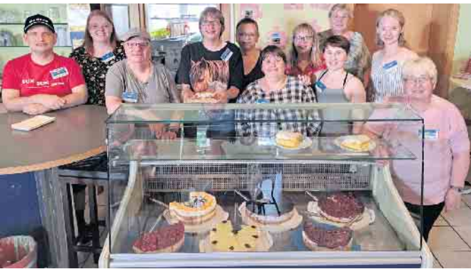
Team Café-House Wehdem

Nicht die Perfektion zählt, sondern das gemeinsame Handeln. Ob Waffeln backen, Kaffee einschenken oder Tortenstücke verteilen - jeder hat seine Aufgabe gefunden. So haben auch Menschen mit einem Handicap die Möglichkeit sich in ihrer Freizeit für andere zu engagieren.