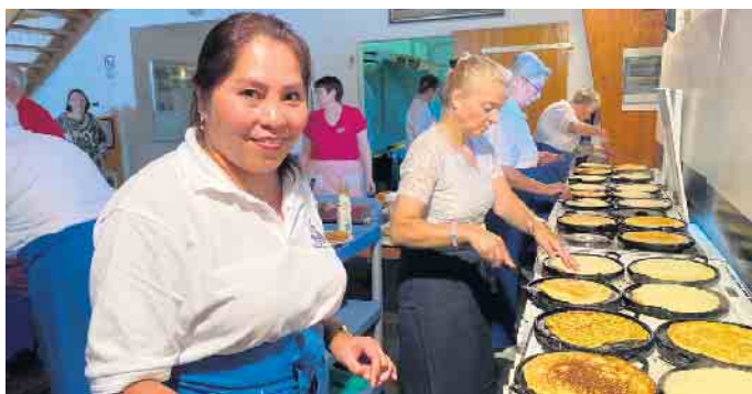
Beim Pickertbacken in der Altmaschinenhalle kommen die Helferinnen aus den Reihen des Mühlenvereins ganz schön ins Schwitzen.