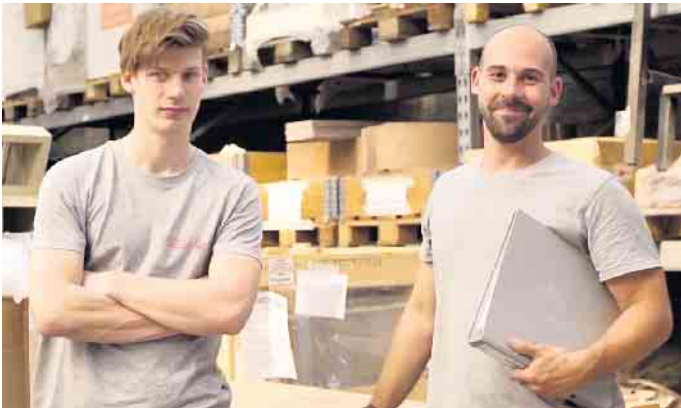
Viele Nachwuchskräfte kommen über ein Praktikum zu ihrem Beruf als Ofen- und Luftheizungsbauer.

Vielseitige Handwerkskunst braucht kreative Köpfe Ofen- und Luftheizungsbauer ist ein Handwerksberuf mit guten Perspektiven. „Wir sind die einzigen, die Feuer ins Haus bringen dürfen“, sagt etwa eine junge Auszubildende. Nach wie vor liegen Holzfeuerstätten als Wärme-Design-Objekte und als krisensichere regenerative Heiztechnik im Trend. Um ihre Zukunft müssen sich die Auszubildenden also keine Sorgen machen. Die Ausbildung selbst ist außergewöhnlich vielfältig und