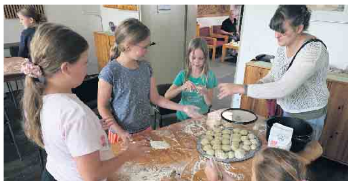
Volle Konzentration bei der Matzen-Herstellung