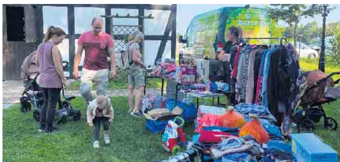
Der Flohmarkt auf dem Leverner Mühlengelände bot allerlei gutes Gebrauchtes.