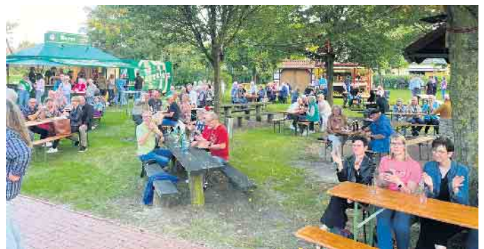
Hunderte Besucher waren gekommen, um einen lauschigen Sommerabend unter großen Eichen zu genießen.