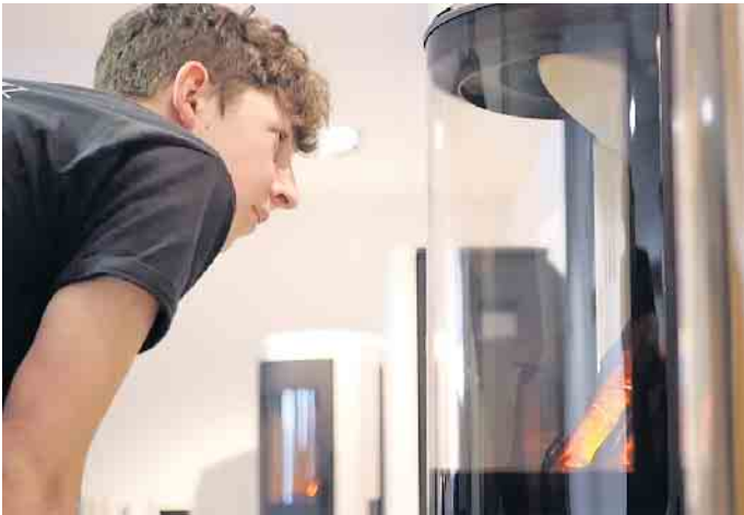
Die Ausbildung zum Ofen- und Luftheizungsbauer bietet ausgezeichnete Zukunftsperspektiven.

Hauses. Nach der Ausbildung stehen viele Türen offen Für die Ausbildung ist ein bestimmter Schulabschluss nicht vorgeschrieben. Einige beginnen mit einem Haupt-, Mittel- oder Realschulabschluss, andere steigen nach dem Abi ein. Die Ausbildung dauert in der Regel drei Jahre im dualen System, pro