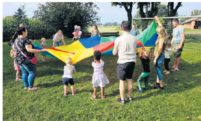
Action mit dem Schwungtuch