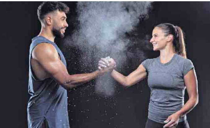
Wer gerne mit Freunden ins Fitnessstudio geht, kann sein Hobby durch ein duales Studium auch zum Beruf machen.

Datenverarbeitungssysteme speziell für die Sport-, Fitness- und Gesundheitsbranche zu entwickeln. (djd)