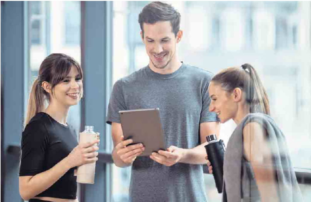
Fitnessstudios leisten einen wichtigen Beitrag zur Gesundheitsversorgung. Auch hier werden dringend Fachkräfte gesucht.

Doch um in der Bevölkerung Bewegungsmangel, Fehlernährung und Übergewicht reduzieren zu können, werden dringend Spezialisten benötigt, die gesundheitsfördernde Interventionsmaßnahmen entwickeln. Für angehende Fachkräfte bietet sich etwa ein duales Bachelor-Studium im Bereich Gesundheitsmanagement an der Deutschen Hochschule für Prävention und Gesundheitsmanagement (DHfPG) an. Dabei kann man das Studium mit einer beruflichen Tätigkeit kombinieren. Mehr Infos auch zu den Bachelor-of-Arts-Studiengängen Fitnessökonomie, Sportökonomie, Gesundheitsmanagement, Fitnesstraining und Ernährungsberatung gibt es unter www.studieren-mit-gehalt.de . Der Start ist jederzeit möglich, die Präsenzphasen können an einem der elf Studienzentren in Deutschland, Österreich und der Schweiz oder in digitaler Form absolviert werden. Dazu erhalten