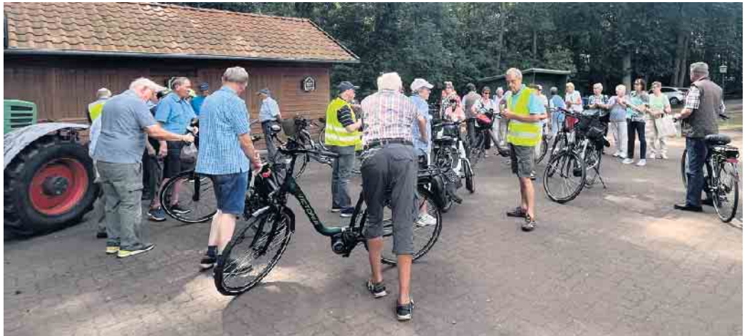
Begrüßung durch den 2. Vorsitzenden

Noch einmal rechts ab auf die Ilweder Straße und unser Ausgangspunkt das Ilweder-Wäldchen war nach 23 Kilometern wieder erreicht. Hier wurden