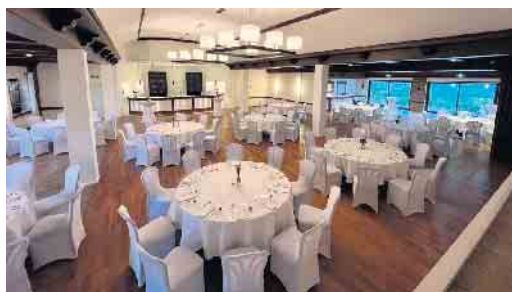
Blick in den Saal

Fangmann Event GmbH & Co. KG, der Betreiber vom Gasthof Rosengarten, schafft im Gespräch mit dem Stewweder Boten Klarheit. Kurz auf den Punkt gebracht: Nichts davon ist wahr! Ganz im Gegenteil: Größere Investitionen in den Saal und in