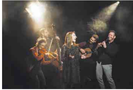
Crazy Freilach.