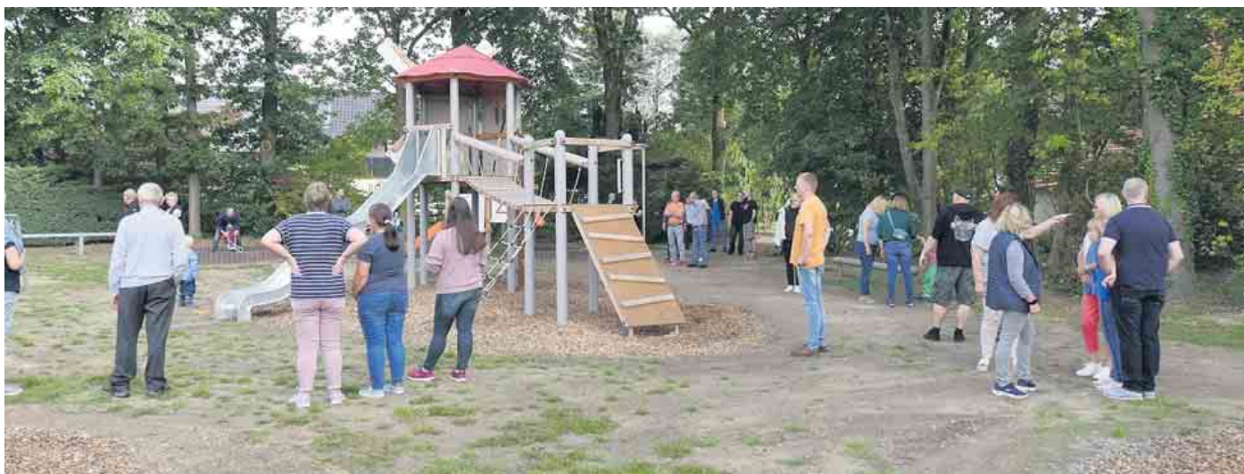
Kleine Mühle für kleine Leute

chem Wetter, kühlen Getränken, Bratwurst und Eis zu einer runden Sache mit Lust auf mehr.