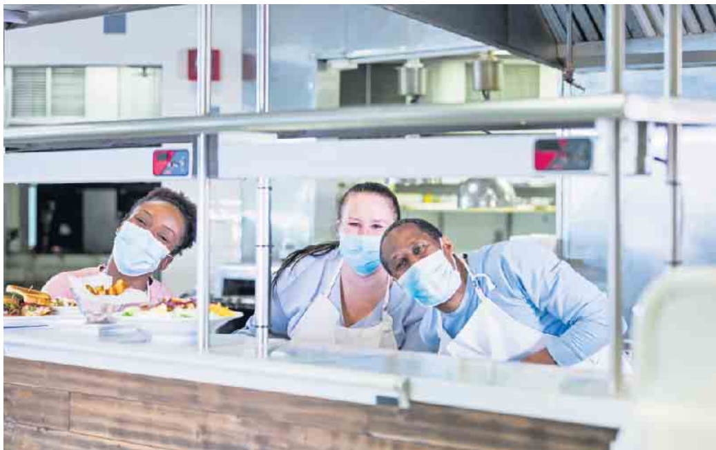
In der Systemgastronomie in Deutschland arbeiten Menschen aus rund 120 Nationen.

Die Systemgastronomie setzt in der Ausbildung auf interkulturelle Kompetenz