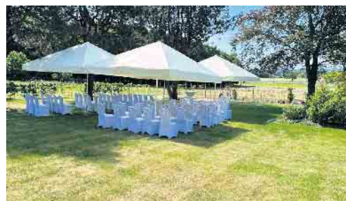
Der Bereich für offene Trauungen

den Außenbereich wurden getätigt. So erstrahlt der Saal nun in einem freundlichen und hellen Glanz und ist mit seinem