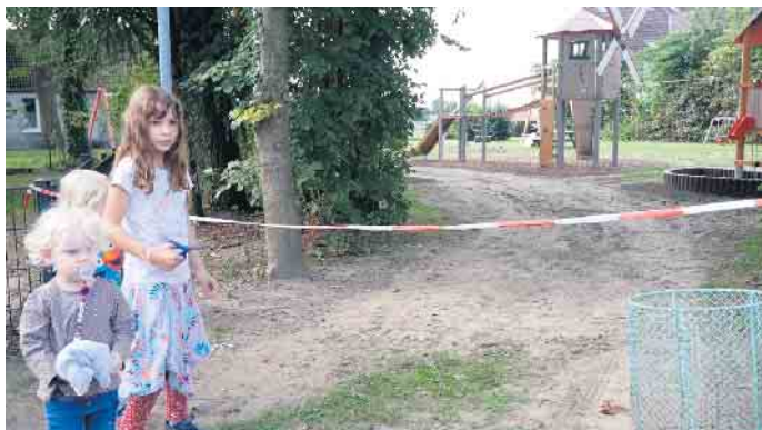
Ein Schnitt vor dem Ziel