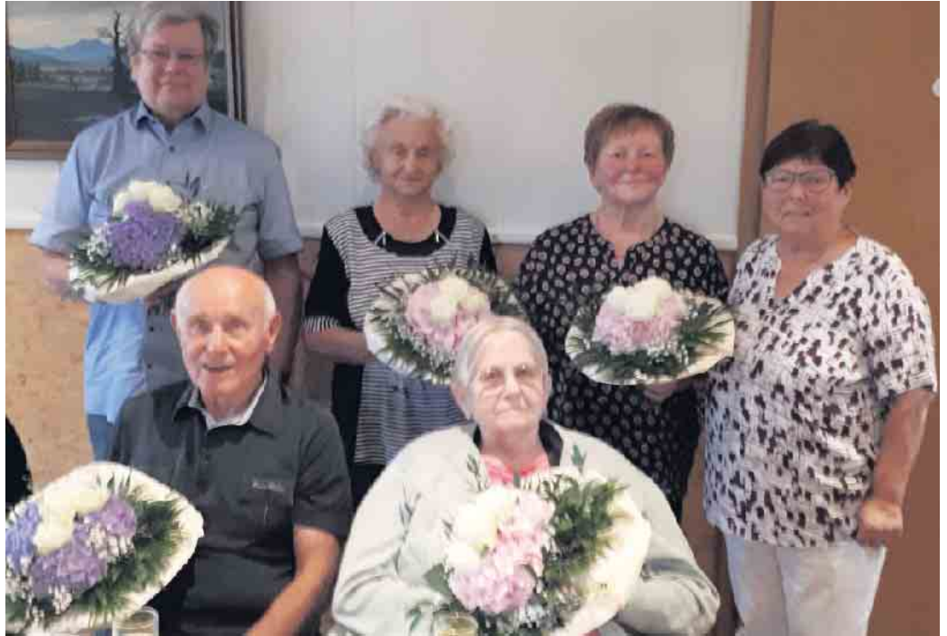
Die anwesenden geehrten Mitglieder