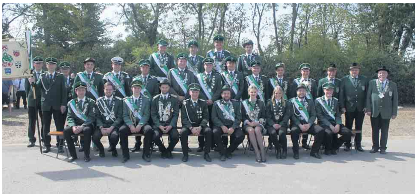
Kreislungsschützen*innen.