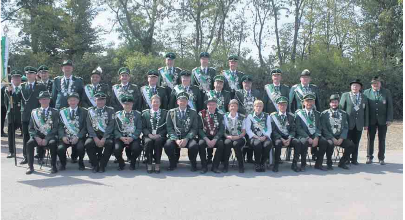
Schützenkönige*innen 2022.

Die Schützen im Lübbecke Land freuen sich über eine gelungene Schützenfestsaison. Nach dem in den letzten beiden Jahren auch das Schützenleben fast nicht möglich war, haben die Schützen dieses Jahr genutzt und ihr Vereinsleben wieder aktiv zu leben.