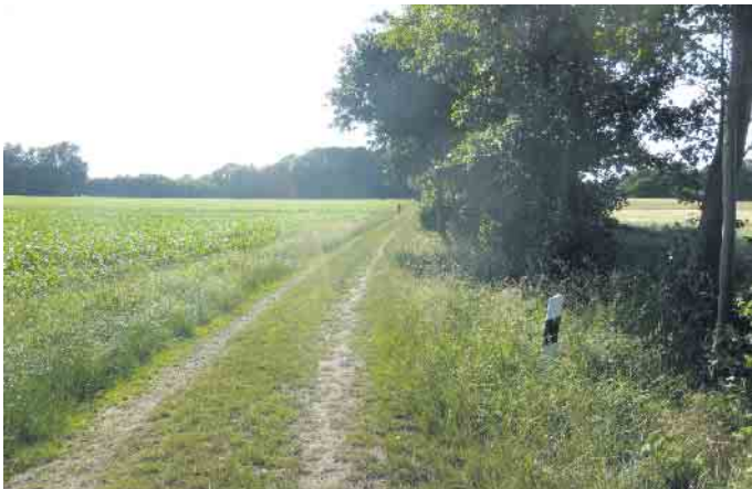
Der Weg Auf der Imlage in Lavern, bevor er fahrradtauglich saniert wurde.

Die Gemeinde Stemwede soll noch fahrradtauglicher werden. Diese Marschrichtung haben die Mitglieder des Stemweder Betriebsausschusses vorgegeben. In der Ausschusssitzung Ende August wurde beschlossen, das bestehende Wirtschaftswegekonzept noch einmal dahingehend zu prüfen, welche gemeindeeigenen Straßen und Wege für den Radverkehr qualifiziert werden können.