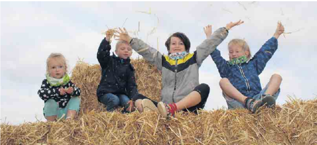
Für die jüngsten Besucher ist die Strohpuppe das Highlight beim Kleifest.