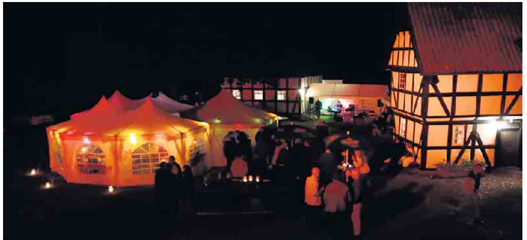
So wurde in 2019 das Hoffest gefeiert.

Ein Großbetrieb mit tausenden von Tieren, eingepfercht in enge Ställe? - Unvorstellbar für den Landwirtschaftsmeister, für den die Lebensqualität seiner Stall- und Weidenbewohner und somit die Güte und Natürlichkeit seiner Erzeugnisse nicht nur in professioneller Hinsicht an erster Stelle steht! Bei Wehdebrocks