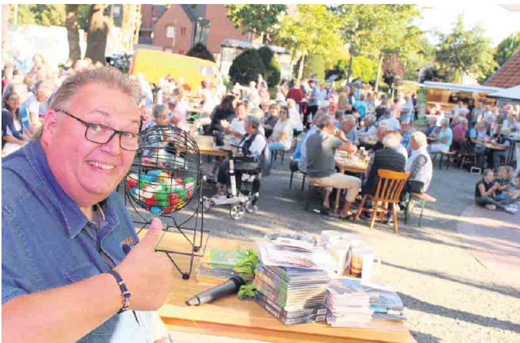
Der als „Bingo-Bär“ bekannte Kult-Moderator Michael Thürnau drehte die Bingokugeln.

HÜDE (hm). Besser hätte die Stimmung kaum sein können: auf dem Hüder Dorfplatz lachen die Besucher mit der Sonne um die Wette. Alle Plätze sind besetzt, wer keinen Sitzplatz mehr gefunden hat, steht ein Stehtischchen. Eines haben alle gemein - sie haben Bingo-Karten vor sich liegen und warten erwartungsfroh bis der als „Bingo-Bär“ bekannte Moderator Michael Thürnau vom NDR die Bingo-Kugeln rollen lässt und die ersten Zahlen verkündet. Konzentriert und gespannt warten die Mitspieler darauf, fünf aufeinanderfolgende Zahlenreihen in waagerechter, senkrechter oder diagonaler Reihe anzukreuzen. Dann wird „Bingo!“ gerufen. Die meisten Besucher wissen genau, wie es geht, denn jeden Sonntag läuft die Bingo-Sendung im Fernsehen auf N3 um 17 Uhr. Zwischen den Ziehungen der Bingo-Zahlen erzählt Thürnau kleine Anekdoten und macht Witze. Die Stimmung ist fröhlich mit dem vertrauten Moderator, der betonte, dass es ihn sehr freue wieder einmal am Dümmer, diesem herrlichen Naturparadies, zu sein. Der Dorfverein versorgte indes die Gäste mit Kaltgetränken und für den kleinen Hunger zwischendurch war auch gesorgt. Wie der beliebte Kult-Moderator mit seiner Bingo-Show zum Dümmer See kam? Darüber