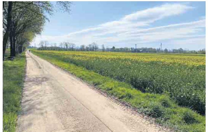
Fahrradtauglich und gut zu befahren: Der Weg Auf der Imlage wurde mit Schotter und Brechsand saniert