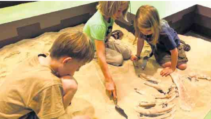
In der großen Familienausstellung „BodenSchätze - Geschichten aus dem Untergrund“ heißt es mitmachen, anfassen und ausprobieren.

den Führung gibt es viel Neues zu entdecken - und garantiert auch jede Menge Spaß. Die KulturBUNT Veranstaltung findet am Sonntag, 7. September, statt. Abfahrt ist um 14 Uhr mit Fahrge-meinschaften ab Amtshof Lemförde. Außerdem für Radelfreunde um 13 Uhr ab Apotheke Dielingen. Die Kosten für das Museum mit Führung betragen 18 Euro, Kinder kostenlos. Die Teilnehmerzahl ist begrenzt. Anmeldungen bei Claudia Schaaf-Gendig, Telefon 05474 333 oder E-Mail claudia.schaaf@gendig.net Informationen und Vorbestellungen auch per E-Mail unter kulturbunt@web.de.