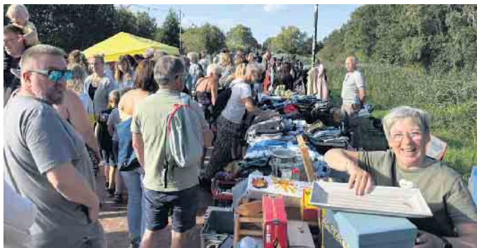
Gut gelaunte Verkäufer und neugierige Schnäppchenjäger: der Flohmarkt am Dümmer See.

Hüde ans Seeufer des Dümmer. Offiziell Nachtflohmarkt, praktisch Nachmittagsrennen: Bewaffnet mit Rucksäcken, Taschen, scharfen Augen und jeder Menge Neugier, herrschte zwischen den just aufgebauten Ständen bald ein buntes Gedränge. „Ich woll-