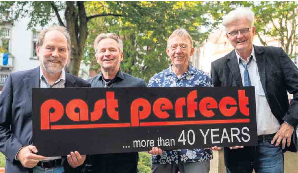
Kein bisschen müde: Zum Repertoire der Band „past perfect“ gehören zahlreiche bekannte Hits. Das Publikum darf auf eine exquisite und breite Mischung aus der Rock- und Popwelt der letzten sechs Jahrzehnte gespannt sein.

Stemweder Kulturring präsentiert: „past perfect... more than 40 years“