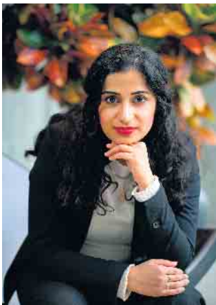
Bundestagsabgeordnete Schahina Gambir

Bundestagsabgeordnete Schahina Gambir und Landtagsabgeordneter Benjamin Rauer kommen am 30. August ins Dielinger Bürgerhaus - Stemweder Ortsverein stellt Wahlprogramm vor