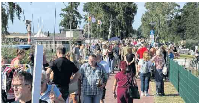
Dicht war das Gedränge beim Flohmarkt auf dem Deich des Dümmer Sees.

Wenn die Schnäppchen dem Sonnenuntergang vorausseilen