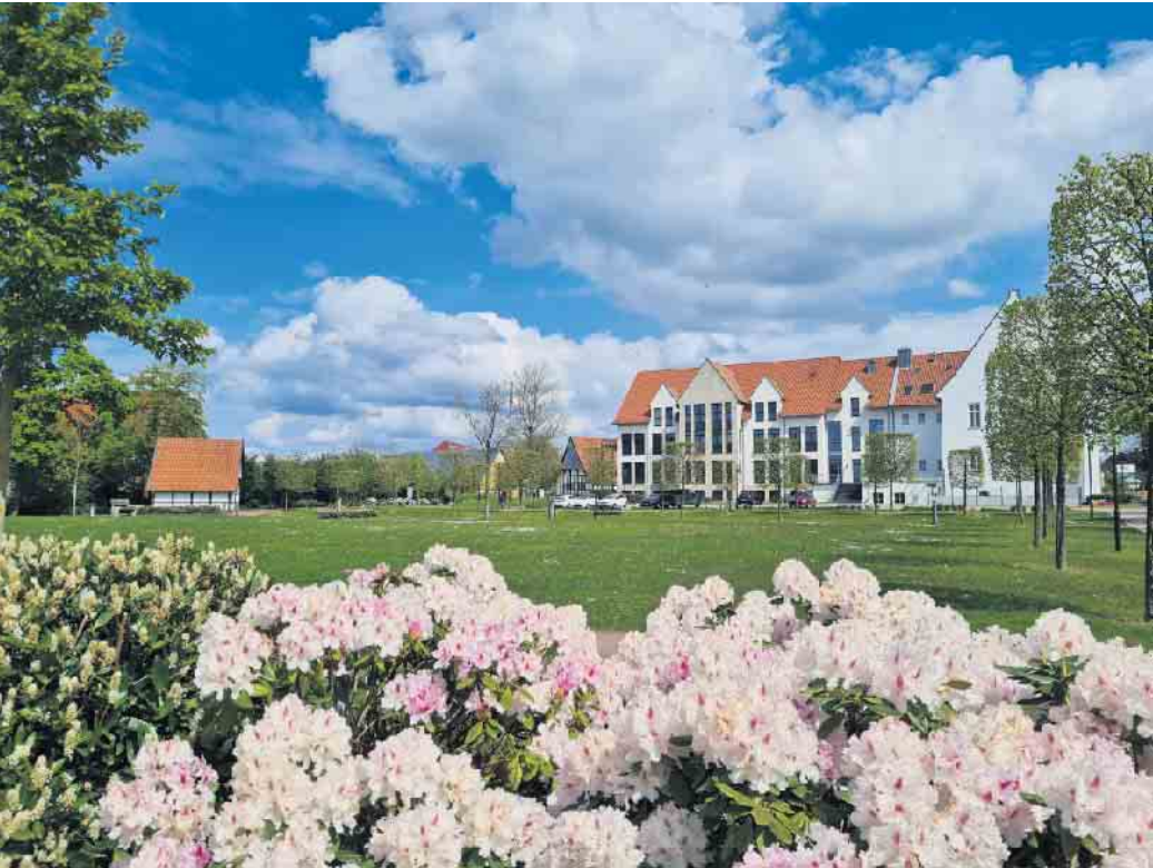
„Wir möchten viele Menschen einladen, einen schönen Tag im Lemförder Bürgerpark zu erleben“, erklären die „LemFörderer“ und weisen damit auf die Veranstaltung „Picknick im Park“ im Herzen des Fleckens hin.

LemFörderer laden für Samstag zum „Picknick im Park“ in Lemförde ein - Vereine bieten Leckereien und Getränke an - Theater, Musik und Aktionen für Kinder sorgen für Unterhaltung